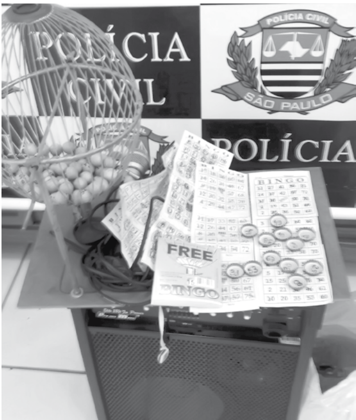
A Polícia Civil de Ouroeste tem agido para punir e evitar a proliferação do jogo ilegal e apreendeu equipamentos e objetos usados em bingo clandestino