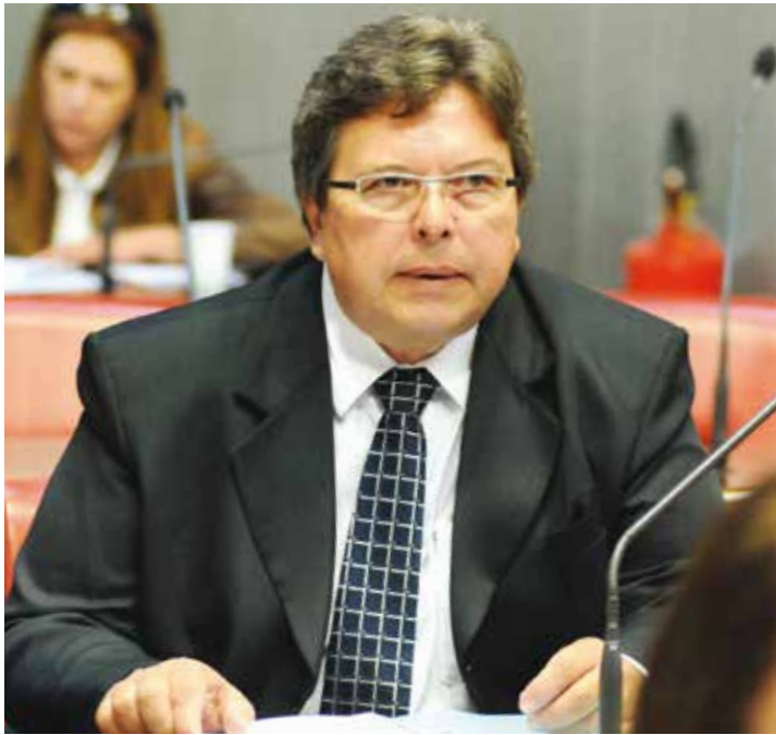
“O turismo é um setor que gera muito emprego e renda para a população dos municípios”, destaca o deputado Carlão Pignatari

gera muito emprego e renda para a população dos municípios, nas mais diversas áreas, como lazer, negócios, tradições, gastronomia, enfim, alguma coisa que possa atrair pessoas”, destaca o deputado Carlão Pignatari.