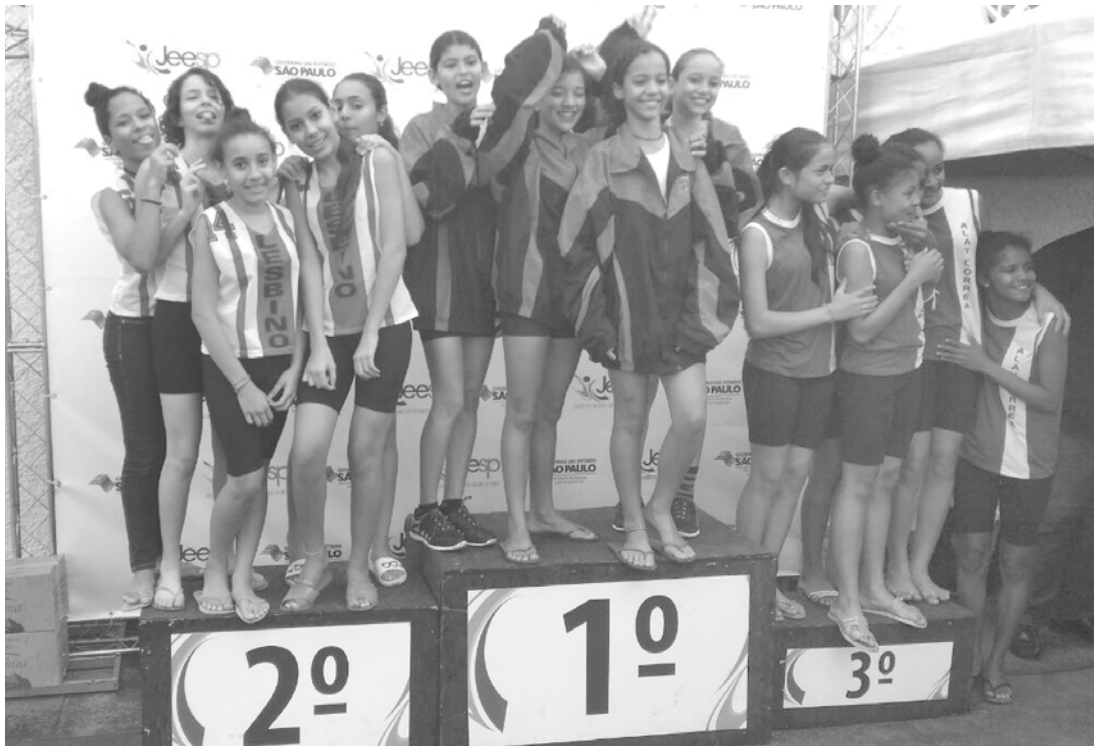
As alunas da escola Lesbino, de Populina, conseguiram a medalha de prata no revezamento 4 x 75 na final dos Jogos Escolares do Estado de São Paulo