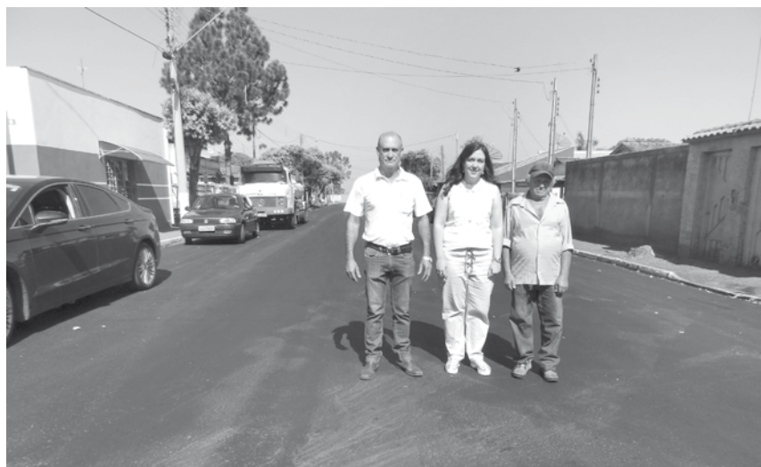
A Administração vistoriou outro trecho recuperado na Rua Borba Gato, que também vai garantir melhorias na infraestrutura da cidade