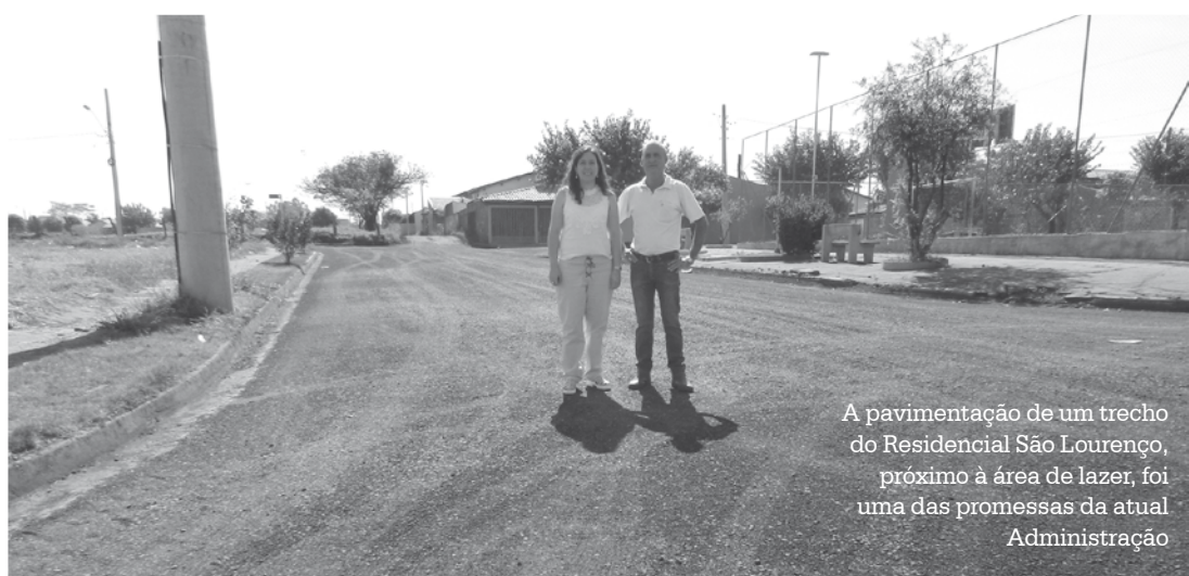
A pavimentação de um trecho do Residencial São Lourenço, próximo à área de lazer, foi uma das promessas da atual Administração