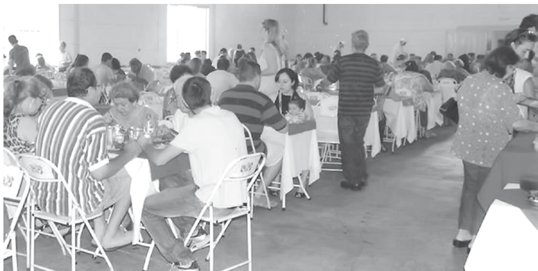
Verba para manter em funcionamento todo esse conjunto de projetos vem das ações promovidas pela “Associação Pátria do Evangelho”

O evento terá início às 11h30, no Salão de Festas da “Meimei”, localizado na Rua Pernambuco e mais uma vez espera atrair um grande público, com um cardápio variado que inclui: churrasco, tutu de feijão, costela, farofa, torresmo, arroz branco, macaronada e saladas variadas. Os ingressos estão à venda pelo valor de R$ 20 - adulto.