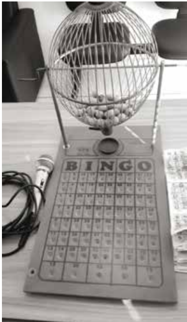
O bingo comercial, cujo intuito consiste em arrecadar dinheiro para fins particulares, é proibido e a infração é prevista na Lei das Contravenções Penais