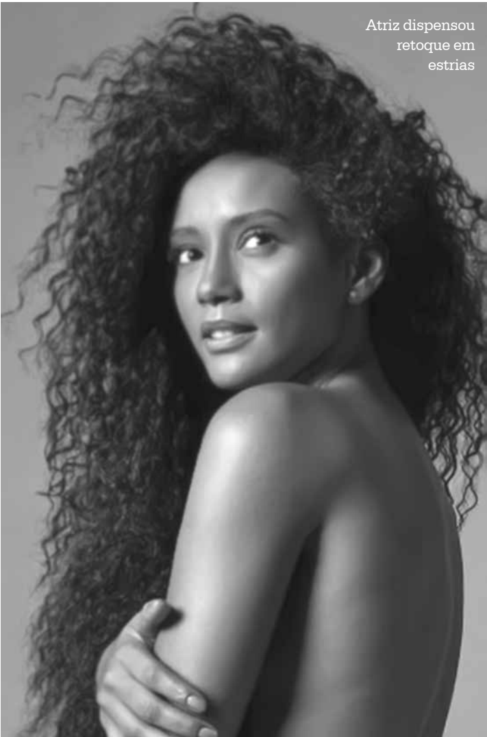
Atriz dispensou retoque em estrias