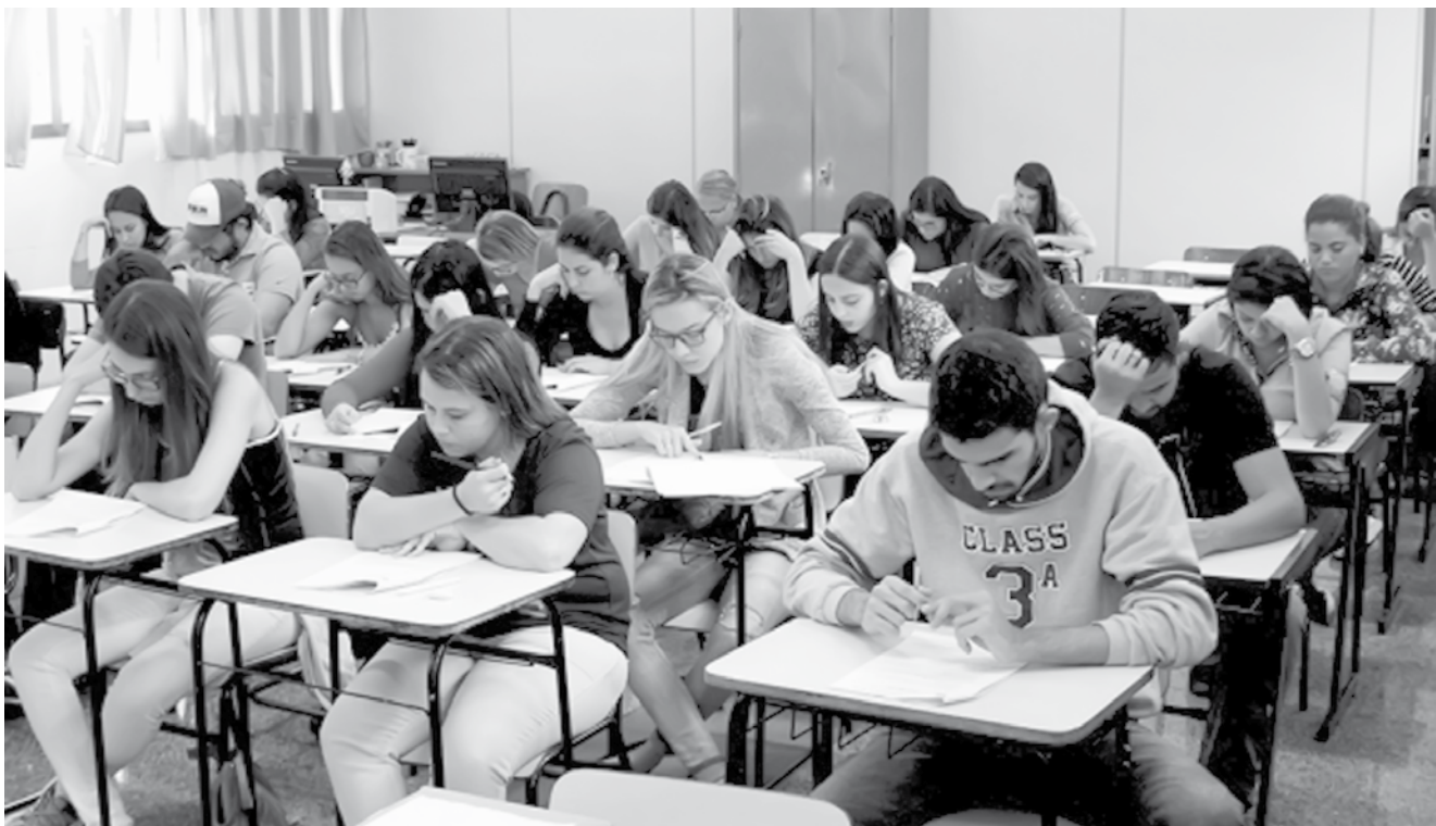
Vagas são para estudantes de níveis médio, técnico e superior

Não falar, não debater, não mostrar que esse é um problema de saúde pública só agrava o quadro. Falar abertamente tira a vergonha e a culpa. O suicídio é um problema de saúde pública que pode e deve ser combatido.