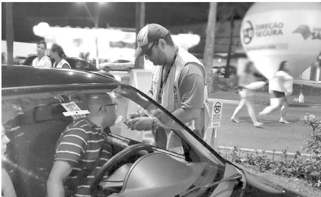
Detran.SP dá dicas para quem vai pegar a estrada no feriado prolongado da independência do Brasil

O aparelho só pode ser usado quando o veículo estiver estacionado. Mesmo durante paradas temporárias em semáforos ou pedágios, a utilização do celular, seja para ligações, para enviar e ler mensagens ou para acesso a sites e redes sociais é proibida e o condutor poderá ser multado. A multa para quem fala ao celular é de R$ 130,16, além disso o condutor recebe quatro pontos na habilitação porque é infração média. Já quem dirige apenas com uma das mãos por estar segurando ou manuseando o aparelho celular com a outra comete infração gravíssima e recebe multa de R$ 293,47 e sete pontos na habilitação. DVD e fones de ouvido – Dispositivos de entretenimento, como telas e aparelhos de DVD só são permitidos para os passageiros do banco de trás. Para motorista só pode caso haja mecanismo de bloqueio automático quando o veículo estiver em movimento. Infringir essa norma é infração grave (multa de R$ 195,23, cinco pontos na CNH e retenção do veículo para regularização). O condutor também não deve utilizar fones de ouvidos conectados a aparelhagem sonora enquanto está ao volante. Do contrário, cometerá infração média (multa de R$ 130,16 e quatro pontos). Nada de dirigir com sono – Fechar os olhos, mesmo que por alguns segundos, em alta velocidade na estrada implica em percorrer uma distância considerável sem prestar atenção no trânsito. Um motorista com sono sente dificuldades em manter os olhos abertos e focados, além dos pensamentos ficarem vagos