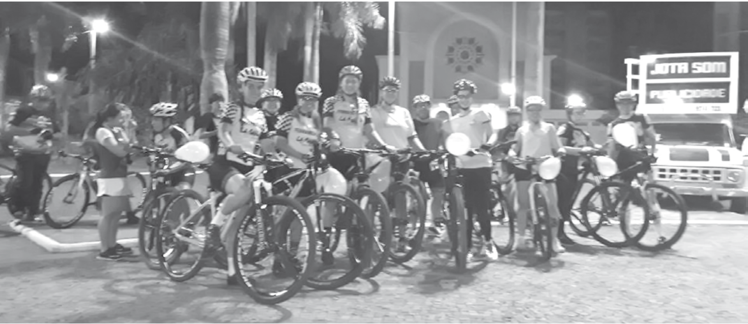
Primeira ação foi corrida e pedal na praça Joaquim Antônio Pereira