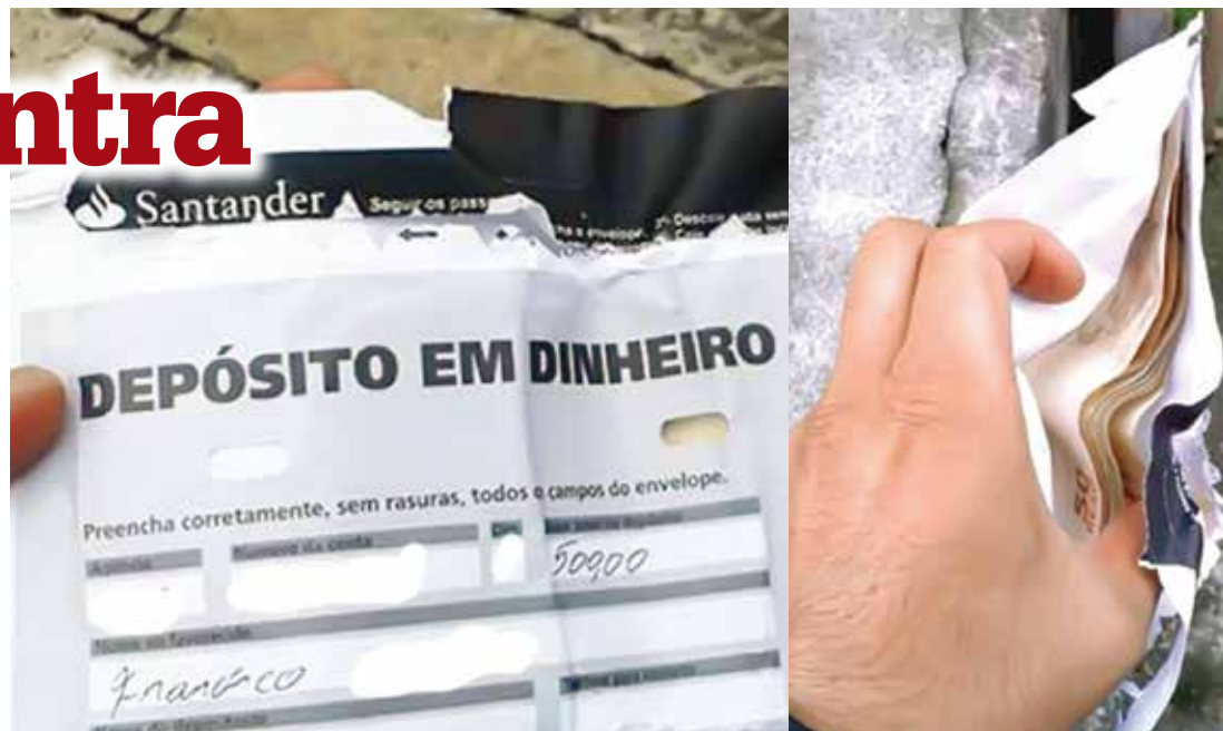
Envelope com R$ 500 foi encontrado na Rua Rio Grande do Sul, na região central do município

Quando já estava desacreditado de recuperar o dinheiro, o empresário recebeu um telefonema informando que