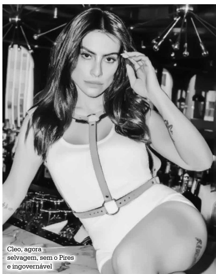
Cleo, agora selvagem, sem o Pires e ingovernável

Nem só de polêmicas vive a atriz. Cleo conta em entrevista à “Revista Vip” deste mês que é engajada em projetos sociais e até mantém um fundo para ajudar os menos favorecidos. “Eu não gosto de comprar briga ou ser polêmica, mas eu vou me defender, sacou?”.