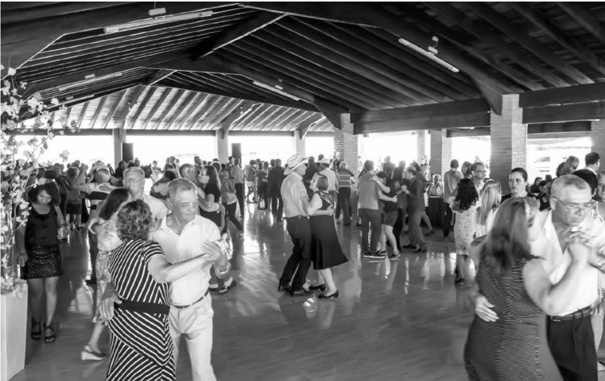
Macedônia sediou, recentemente, no salão multiuso, baile voltado à Melhor Idade. Na oportunidade, fizeram parte do evento seis municípios da região. A animação ficou por conta da banda Força do Sol