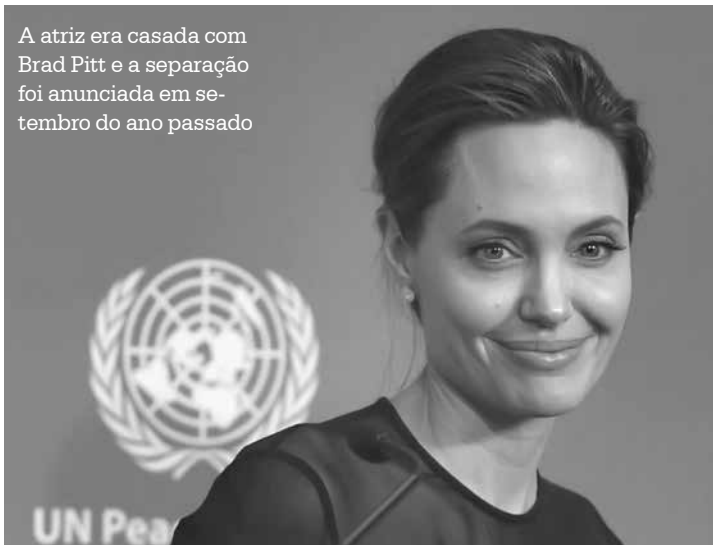
A atriz era casada com Brad Pitt e a separação foi anunciada em setembro do ano passado