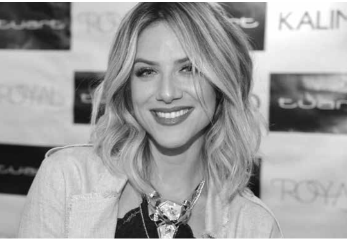
Atriz investe na carreira de youtuber e já tem 1,3 milhões de inscritos

Ela diz não sentir pressão para estar na TV. “O mundo hoje é da internet”, defende. Sou da época da televisão e estive presente nessa transição. Hoje, tenho mais reconhecimento do público estando na internet do que na TV.”