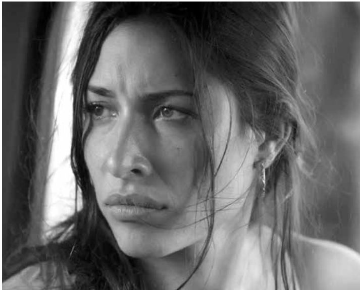
A emissora informou que não vai se pronunciar