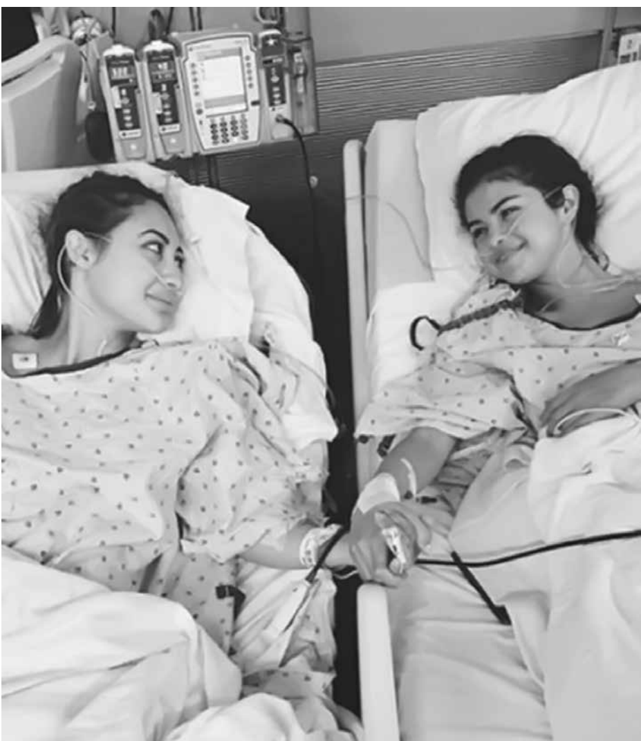
Selena Gomez compartilhou imagem após transplante

Após a cirurgia, Selena contou que precisou de recuperação até que pudesse revelar a novidade. “Eu estou muito ciente de que meus fãs notaram que eu não estava aparecendo muito por parte do verão e questionando porque não estava promovendo meu novo trabalho, do qual estou muito orgulhosa. Então eu descobri que precisava de um transplante de rim devido ao meu lupus e estava me recuperando. Foi o que eu precisei fazer pela minha saúde em geral”, frisou a artista, agradecendo também ao apoio da sua família e da equipe de médicos responsável por ela.