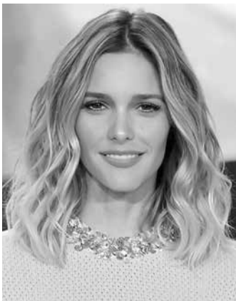
A apresentadora da Globo chegou a ter o carro apreendido recentemente no Rio de Janeiro

que foi ao local, na Gávea, para retirar o veículo. O bloqueio da carteira de Fernanda já foi feito e, se for pega no volante, a global pode ter o direito de dirigir cassado por até dois anos.