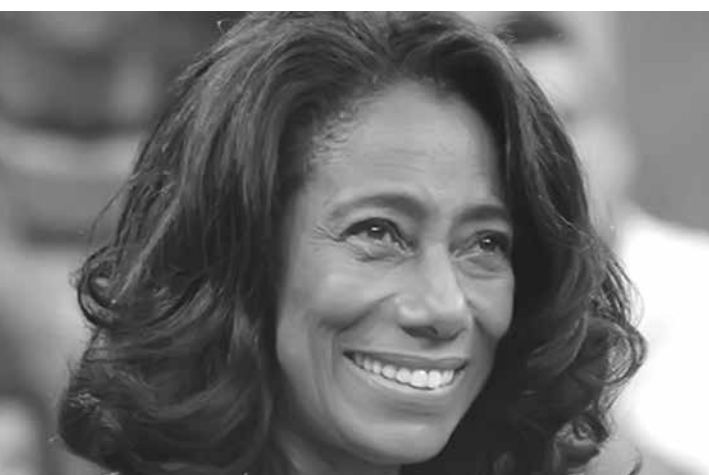
A jornalista não queria que vissem o seu rosto nas reportagens