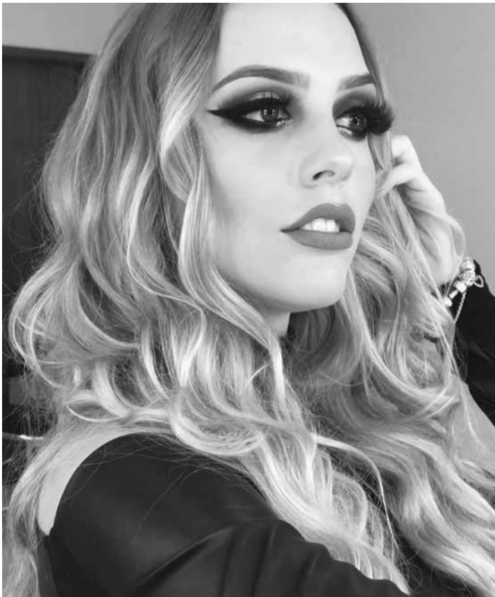
Amanda Nunes aniversaria hoje, recebendo os parabéns da galera.