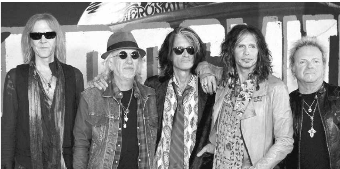
A banda foi na contramão de outros artistas que pediram alimentos orgânicos

Salmão grelhado com salada, e coxas de peru com legumes no vapor. Além disso, a banda quer muffins de blueberries, receita exclusiva de Tyler. Enquanto isso, a turma do Bon Jovi exigiu máquina de lavar e secar.