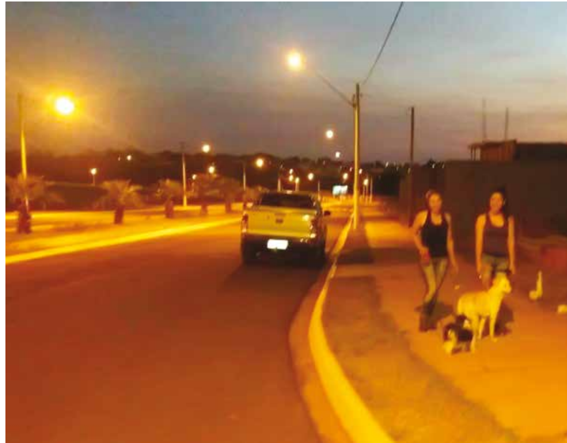
Com calçadas largas e planas, iluminação diferenciada, o PreVitta já se tornou um novo ponto para quem pratica caminhadas