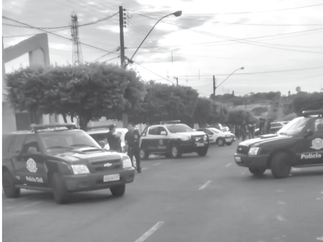
As prisões ocorreram em cidades da região

em Fernandópolis (4), Santa Rita d'Oeste (1), Araçatuba (4), Estrela d'Oeste (7), Meridiano (1). Alguns mandados de prisão não chegaram a ser cumpridos, sendo que os indiciados não localizados em seus respectivos endereços são considerados foragidos da Justiça. Os presos foram encaminhados para a Cadeia Pública de Guarani d'Oeste, exceto uma mulher, que permanecerá detida em Nhandeara.