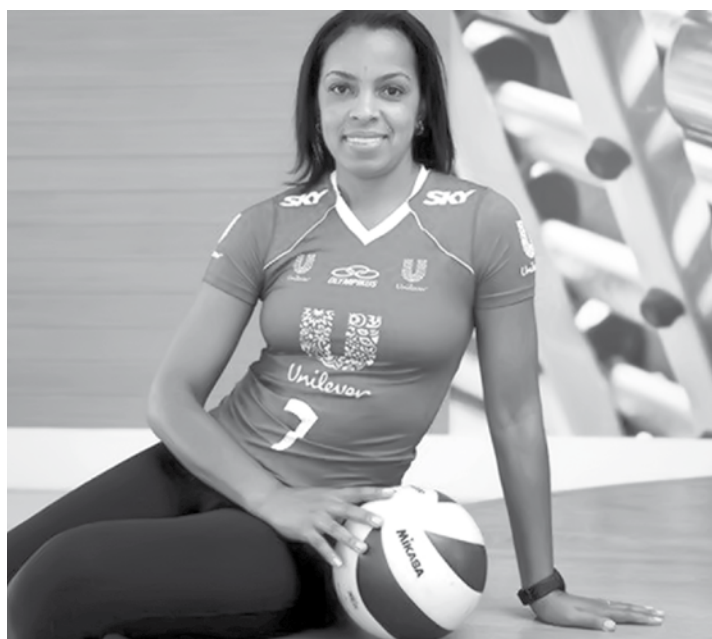
Em Fernandópolis, 'Fofão' participará de dois eventos com entrada gratuita ao público

Atleta mais vitoriosa do vôlei brasileiro estará em Fernandópolis falando sobre a importância do esporte