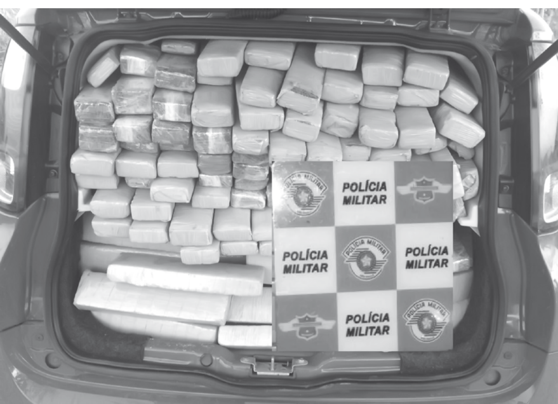
Maconha e cocaína estavam no porta-malas de um Fiat Uno