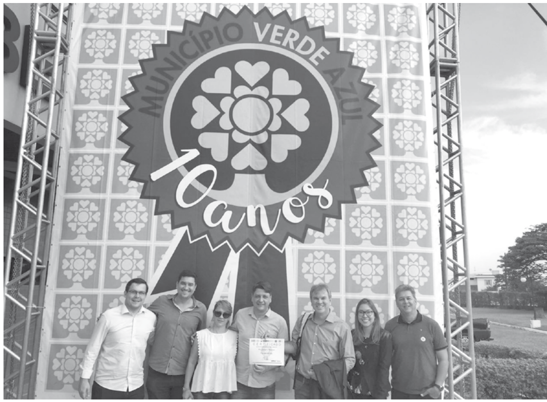
Fernandópolis desde o início do ano desenvolve trabalho e projetos em prol ao meio ambiente

Fernandópolis, que desde o início do ano desenvolve um amplo trabalho e projetos em prol ao meio ambiente, foi destaque em mais uma pré-certificação com expressiva vantagem entre os demais 644 municípios que também concorrem ao selo. "Conquistamos mais uma vez o prêmio destaque no selo e isso é motivo de muita alegria, sinônimo de um trabalho intenso e em conjunto. Agradeço toda equipe do Meio Ambiente que com