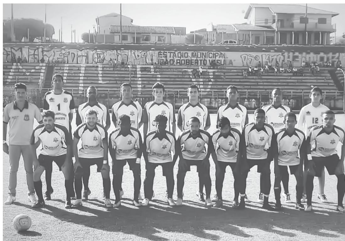
Clube Atlético Ouroeste – C.A.O. levou o título de vice-campeão da Copa Interior 2017