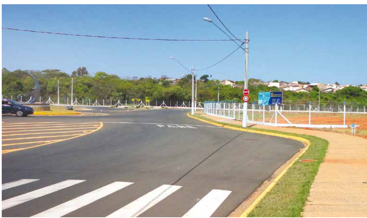
O PreVitta é hoje o maior e mais bem estruturado empreendimento da cidade