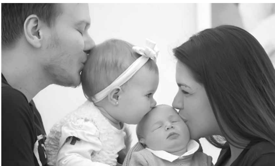
Casal comemorou dois meses de vida do filho mais novo