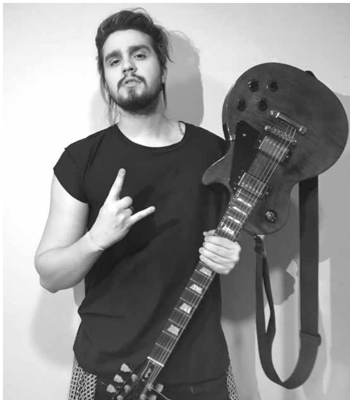
Luan Santana posa com guitarra

do, amor multiplicado. 2 meses de amor! Deus é contigo, filhão! Amor infinito”.