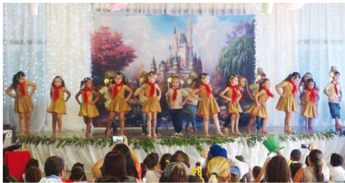
No dia 21 de setembro, cada sala de aula apresentou seu produto final