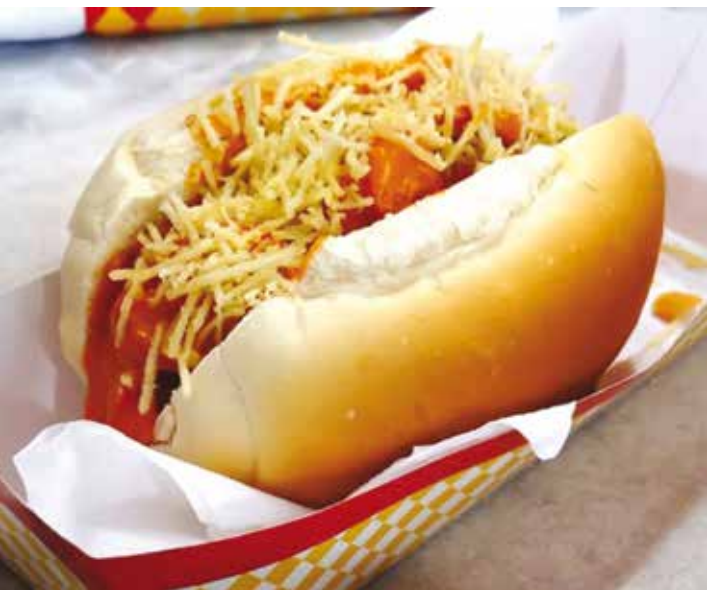
O preço do cachorro-quente é de apenas R$ 5,00