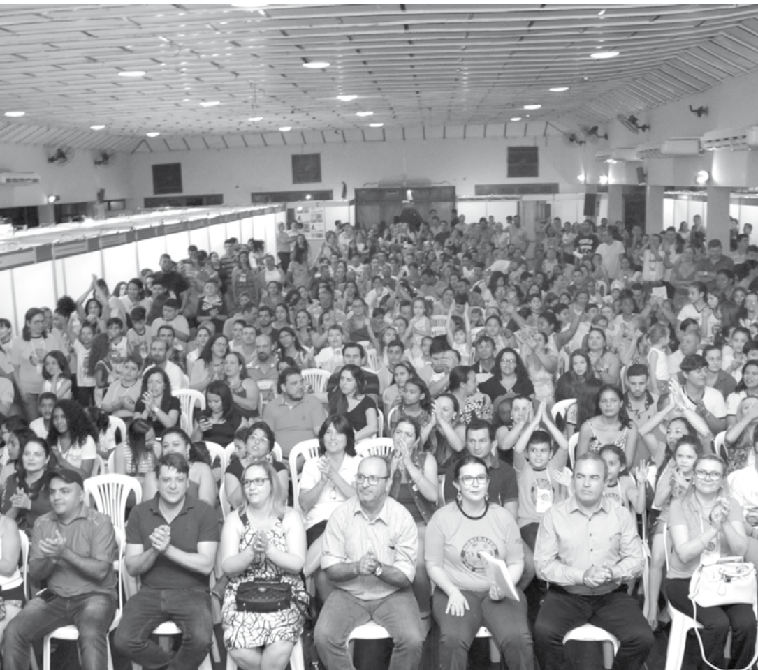
Evento contou com a participação de um grande público