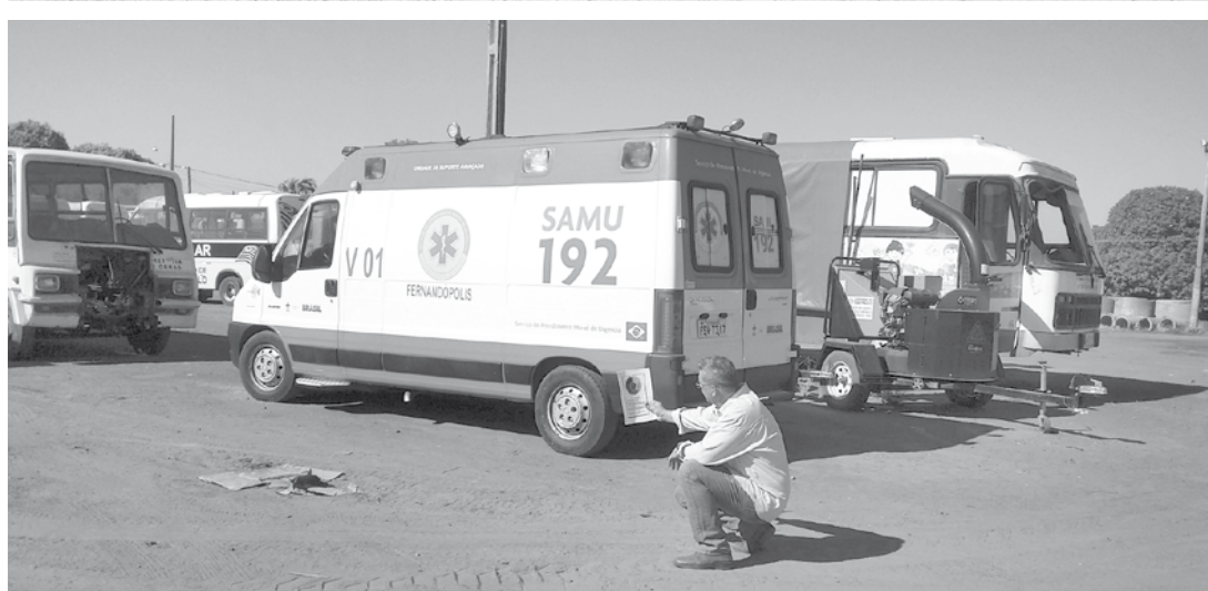
No total foram vistoriados 50 veículos