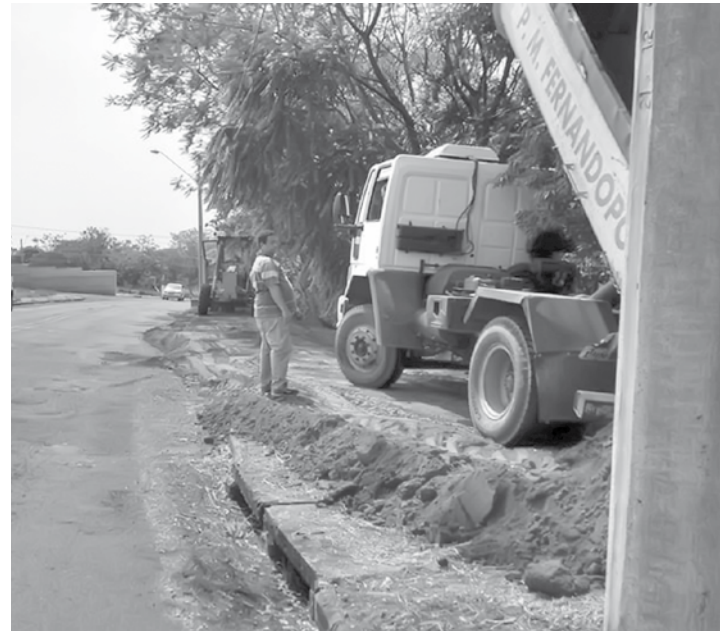
Parceria entre poder público e população garante melhoria para a cidade