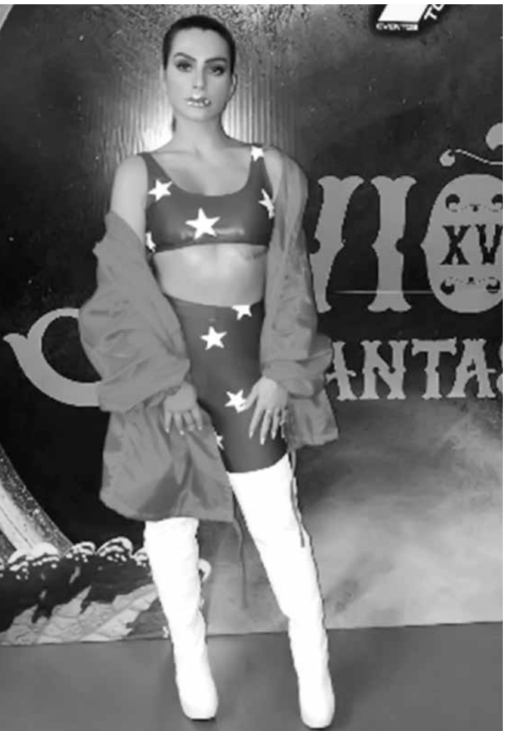
Solteira, atriz contou que agora está focada em seus projetos

Solteira desde que terminou com o ator Rômulo Neto, em fevereiro de 2016, Cleo disse que aproveitou bastante essa fase: “Já estive mais soltona na pista, eu diria (risos). Dando uma certa passada de rodo, sabe? Todos sabem como é... Estou mais tranquila agora, mais introspectiva. É muito bom estar solteira. Consigo focar com mais clareza nas coisas que eu gosto e nos meus projetos.”