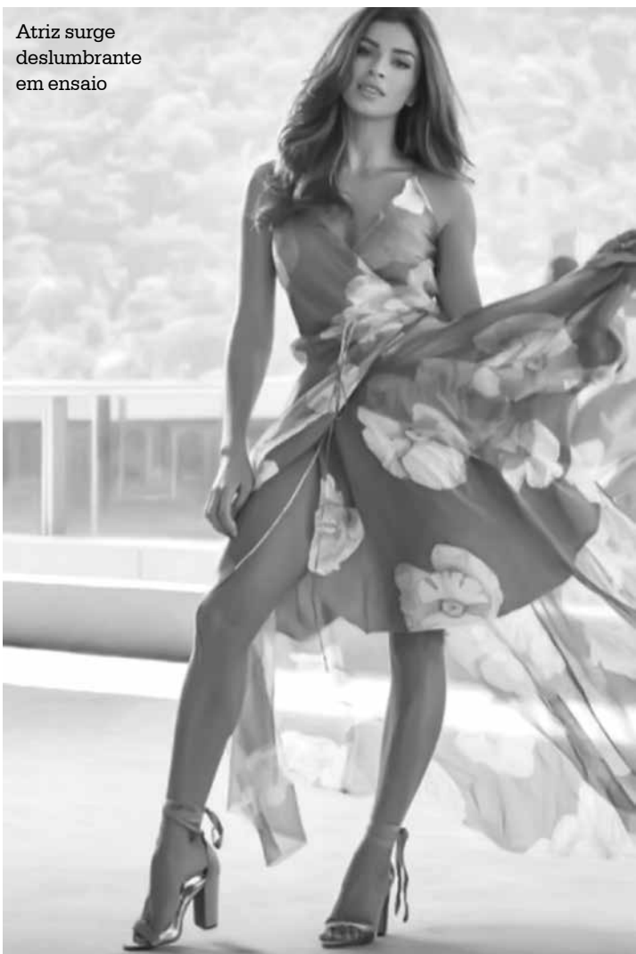
Atriz surge deslumbrante em ensaio