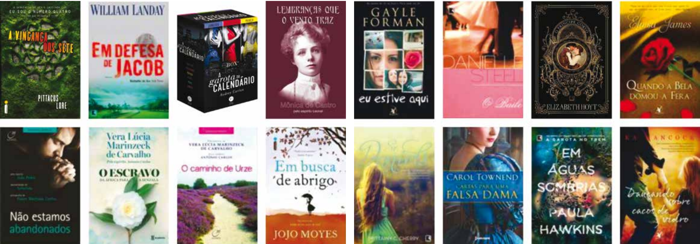
São dezesseis novos livros à disposição dos leitores

rios, vídeos educacionais/motivacionais, elaboração de trabalhos escolares e acadêmicos, material/estudo para concursos públicos, entre outros. Todas as atividades disponíveis na Biblioteca são oferecidas à população de segunda à sexta, das 8h às 17h.