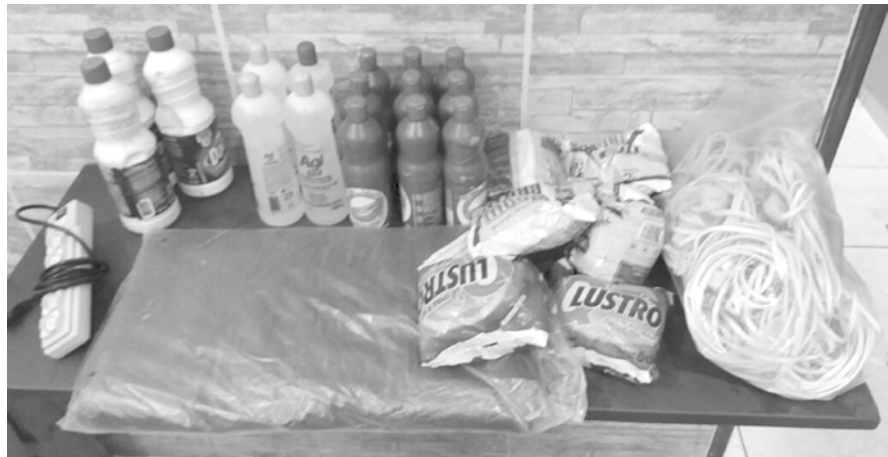
Objetos furtados da igreja valem mais de R$ 11 mil, mas foram vendidos pelo acusado por apenas R$ 58