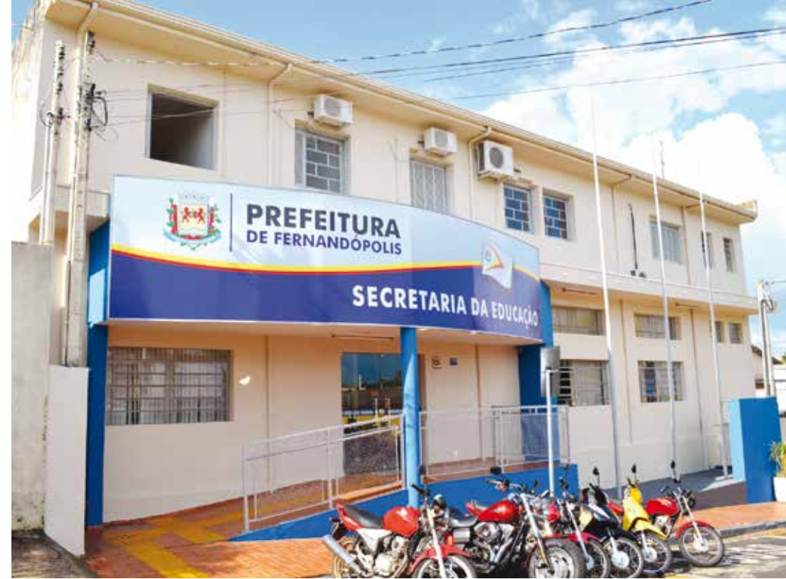
Mais informações podem ser obtidas nas escolas da rede municipal ou na Secretaria Municipal de Educação

também por uma escola agrícola, a EMEF Melvin Jones. Para efetivar a matrícula, os pais devem levar os seguintes documentos da criança: duas fotos 3x4, cópias da certidão de nascimento, RG, CPF e carteira de vacinação (frente e verso); dos pais ou responsáveis é necessário apresentar: cópias do RG e CPF e comprovante de residência. É importante destacar que o primeiro ano do ensino