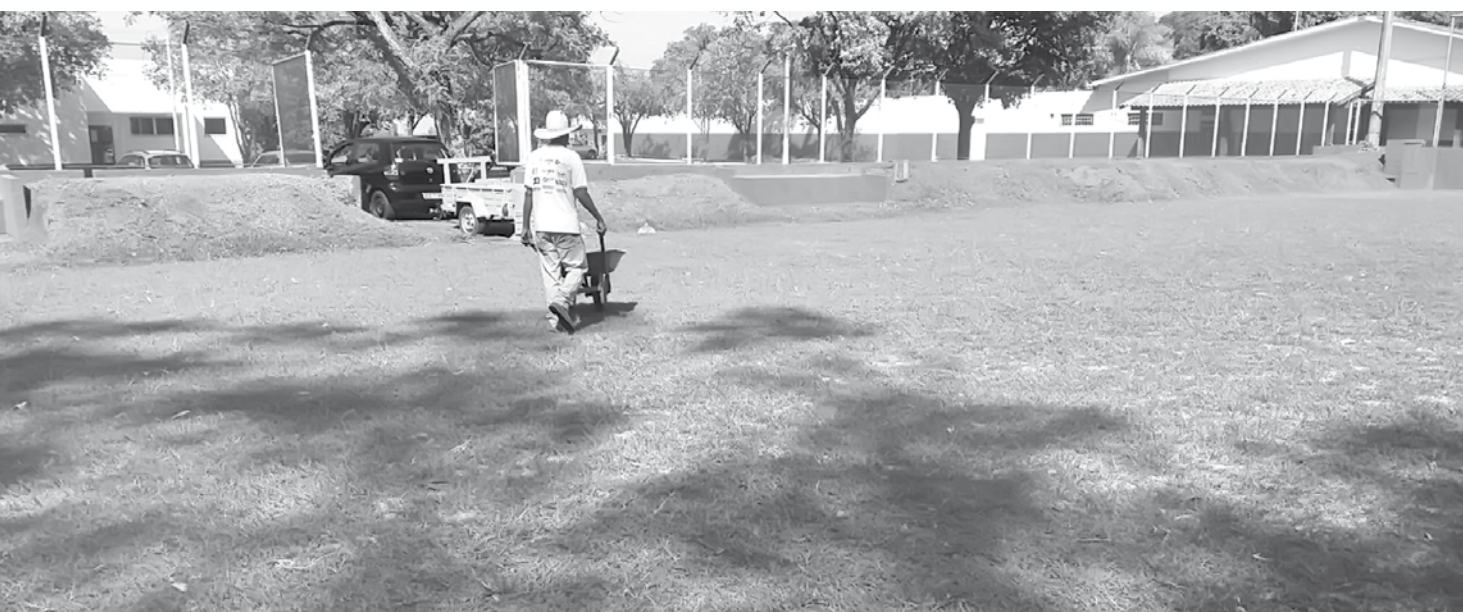
Reforma deve durar cerca de 30 dias