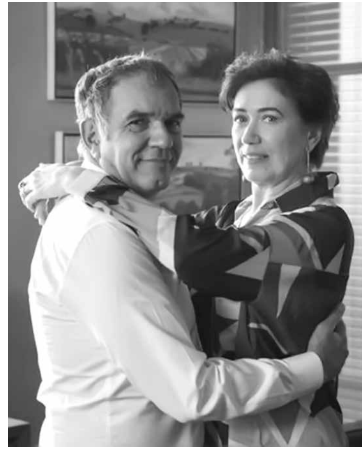
Ator quer um final feliz para Eurico e Silvana

car em choque quando descobrir que Nonato é transformista. Mas como gosta dele e sabe que conviveu todo esse tempo com um homem de bem, acredito que vá passar por cima dessa diferença — torce. Pelo menos a postura conservadora do personagem não rendeu puxões de orelha: — Nunca o chamaram de homofóbico ou machista, talvez porque eu procure deixá-lo leve, engraçado. Recebo muito carinho nas ruas. As pessoas sabem que ele é das antigas, mas que tem um bom coração.