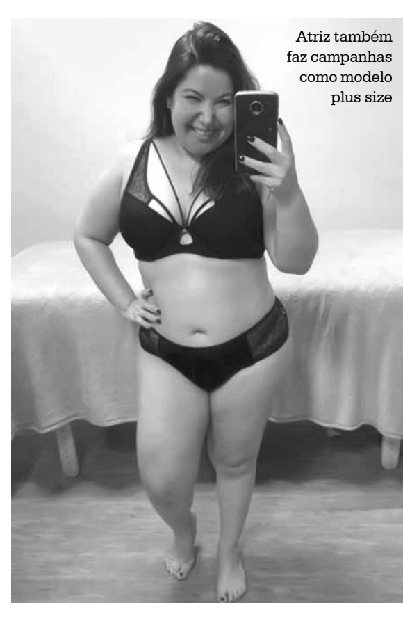
Atriz também faz campanhas como modelo plus size

Débora Nascimento e José Loretto estão grávidos. O anúncio foi feito na tarde desta quarta-feira no Instagram da atriz. "Amor multiplicado. Agora somos três. Débora. José. Bella", postou ela, já revelando o sexo e o nome da bebê. Vai ser menina! José Loretto, de 33 anos, e Débora, de 32, estão começaram um relacionamento nos bastidores da novela "Avenida Brasil", em 2012, e se casaram em maio do ano passado, numa cerimônia em segredo, e também fizeram uma celebração no Rio.