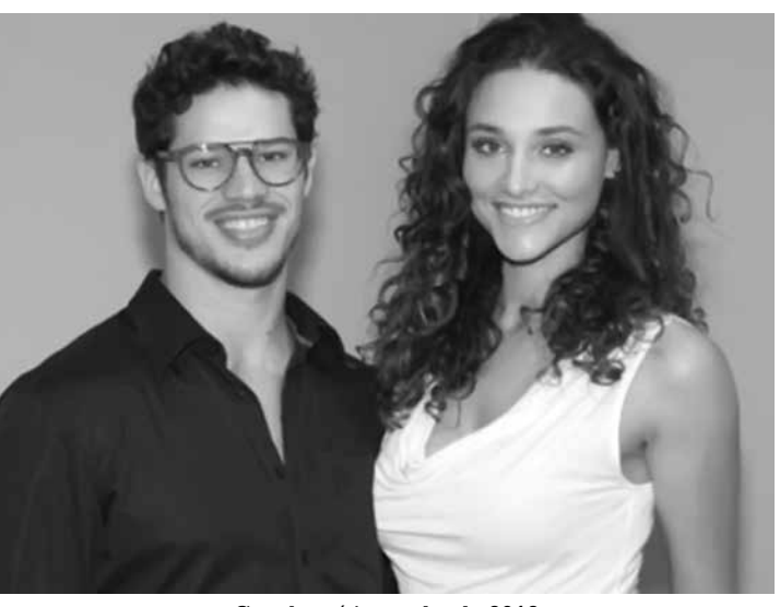
Casal está junto desde 2012

Débora Nascimento e José Loretto estão grávidos. O anúncio foi feito na tarde desta quarta-feira no Instagram da atriz. "Amor multiplicado. Agora somos três. Débora. José. Bella", postou ela, já revelando o sexo e o nome da bebê. Vai ser menina! José Loretto, de 33 anos, e Débora, de 32, estão começaram um relacionamento nos bastidores da novela "Avenida Brasil", em 2012, e se casaram em maio do ano passado, numa cerimônia em segredo, e também fizeram uma celebração no Rio.