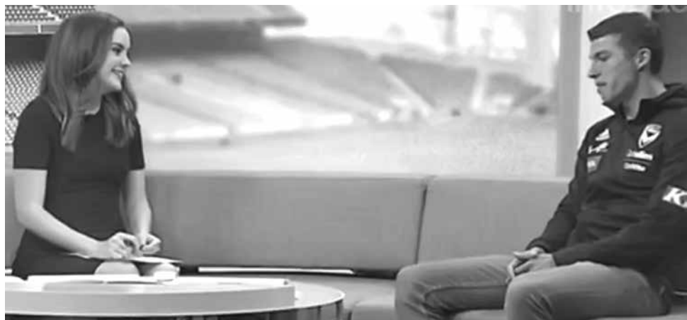
Ele precisou deixar o estúdio

Mais tarde, a explicação: “Tivemos um bom bate-papo fora do estúdio, mas ele está bem e estará no