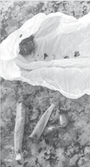
Na Delegacia, depois de uma busca pessoal, os policiais ainda encontraram com a jovem uma porção da mesma droga, além de frações de um “baseado”