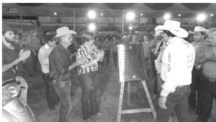
Descerramento da placa de inauguração da construção dos camarotes fixos, que ficará registrado como um grande marco da administração