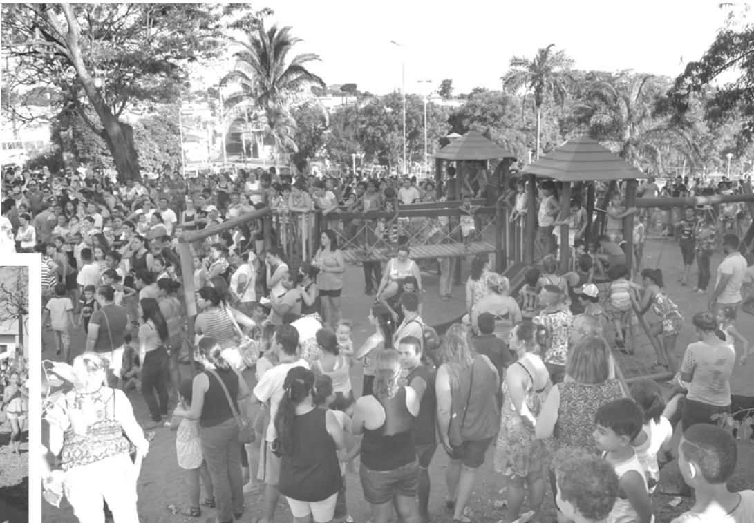
Centenas de crianças brincaram e se divertiram na praça: horas de diversão e a presença de grande público marcam FernanKids