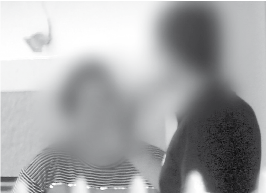
Médica conversa com professor de violão durante o horário de trabalho, segundo a PF

caminhado para Justiça. A médica, além de estar sendo acusada, criminalmente, por estelionato, também está sendo acusada civilmente por enriquecimento ilícito. A Polícia Federal disse que vai pedir ainda a devolução do dinheiro das horas pagas irregularmente. TEM MAIS! A médica é dona de uma empresa contratada pela Prefeitura de Jales e apesar dos ilícitos, o município da região resolveu prorrogar o contrato vencido em setembro e ainda concedeu reajuste de preço pelos serviços. Em contato com a Reportagem, a Prefeitura, por meio da assessoria de imprensa, apenas informou que não foi envolvida no inquérito em questão.