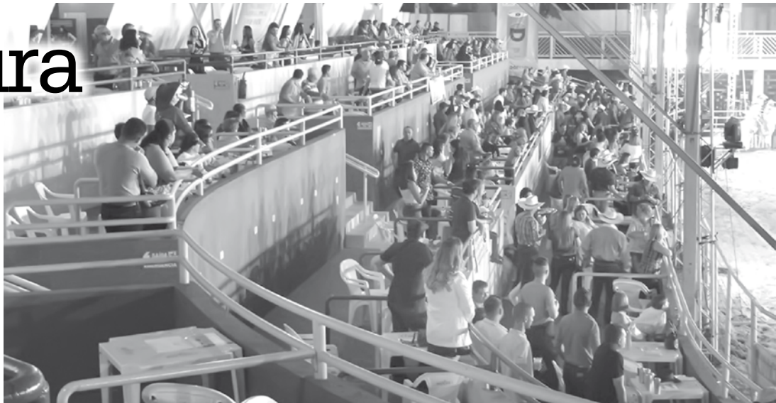
Foram inaugurados durante a programação da 21ª Festa do Peão de Ouroeste 71 camarotes fixos no Recinto Sela de Ouro