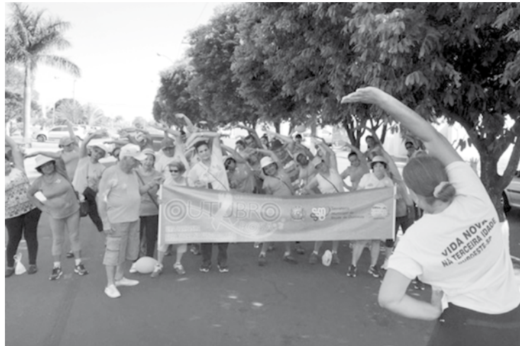
A Secretaria vem desenvolvendo durante o mês um trabalho para orientar as mulheres sobre a maneira correta de se prevenirem