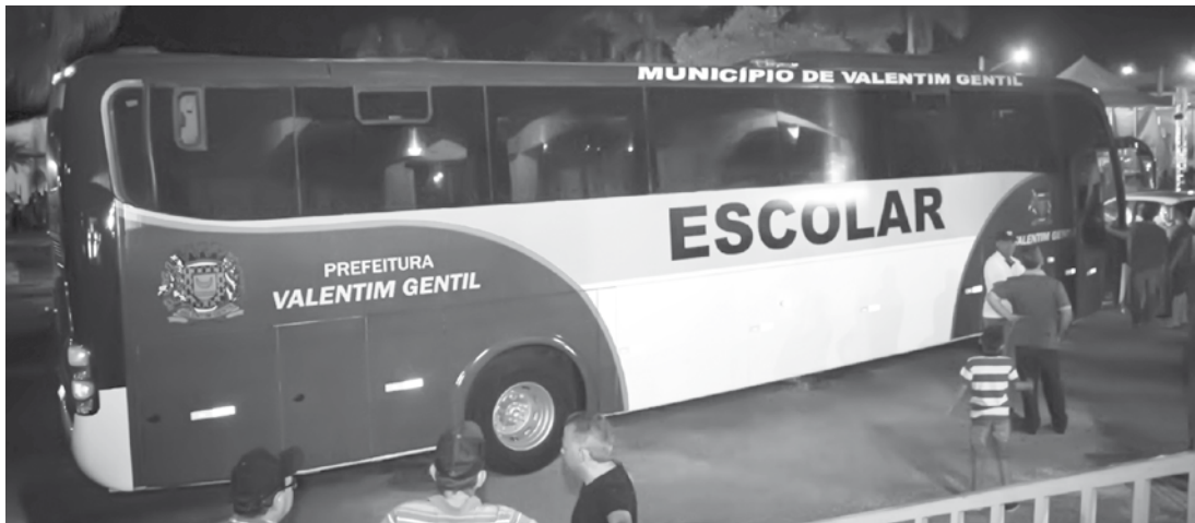
Ônibus com ar condicionado, banheiro e DVD adquirido pela Prefeitura de Valentim Gentil para o serviço de transporte de estudantes do município