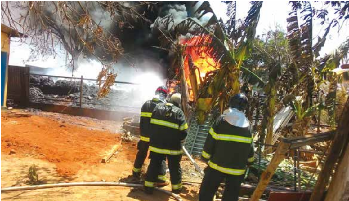
Investigação, para apurar origem do fogo, terá início após perícia técnica da Polícia Científica

residência vizinha da reciclagem. A sorte foi que os Bombeiros já estavam no local e logo apagaram o fogo que se alastrava pela armação de madeira do teto da casa. Não há registro de vítimas.