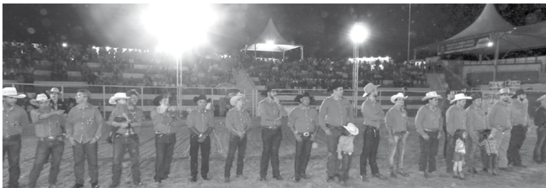
Membros da comissão organizadora, responsável pela programação da 21ª Festa do Peão de Ouroeste