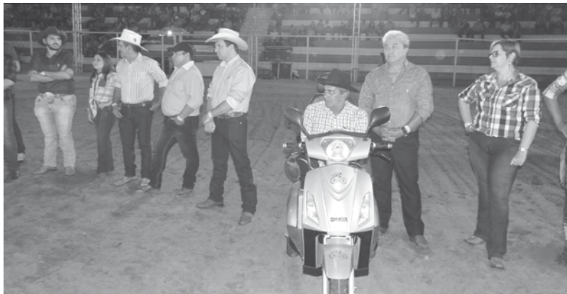
Os vereadores participaram da abertura oficial e da cerimônia de inauguração dos camarotes fixos