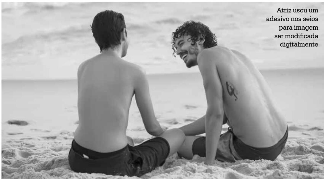
Atriz usou um adesivo nos seios para imagem ser modificada digitalmente