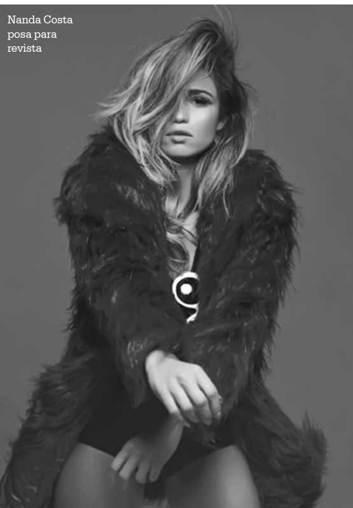
Nanda Costa posa para revista