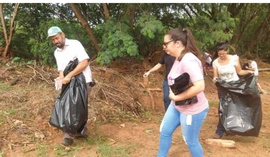
Santa Rita é o maior e principal ribeirão do município e região

alizaram uma pequena explicação sobre o serviço que estava sendo realizado, enfatizaram a grande importância do Ribeirão Santa Rita e da preservação dos recursos hídricos. A Secretaria Municipal de Meio Ambiente destaca que todo lixo retirado foi corretamente eliminado, com o importante apoio e comprometimento dos voluntários.