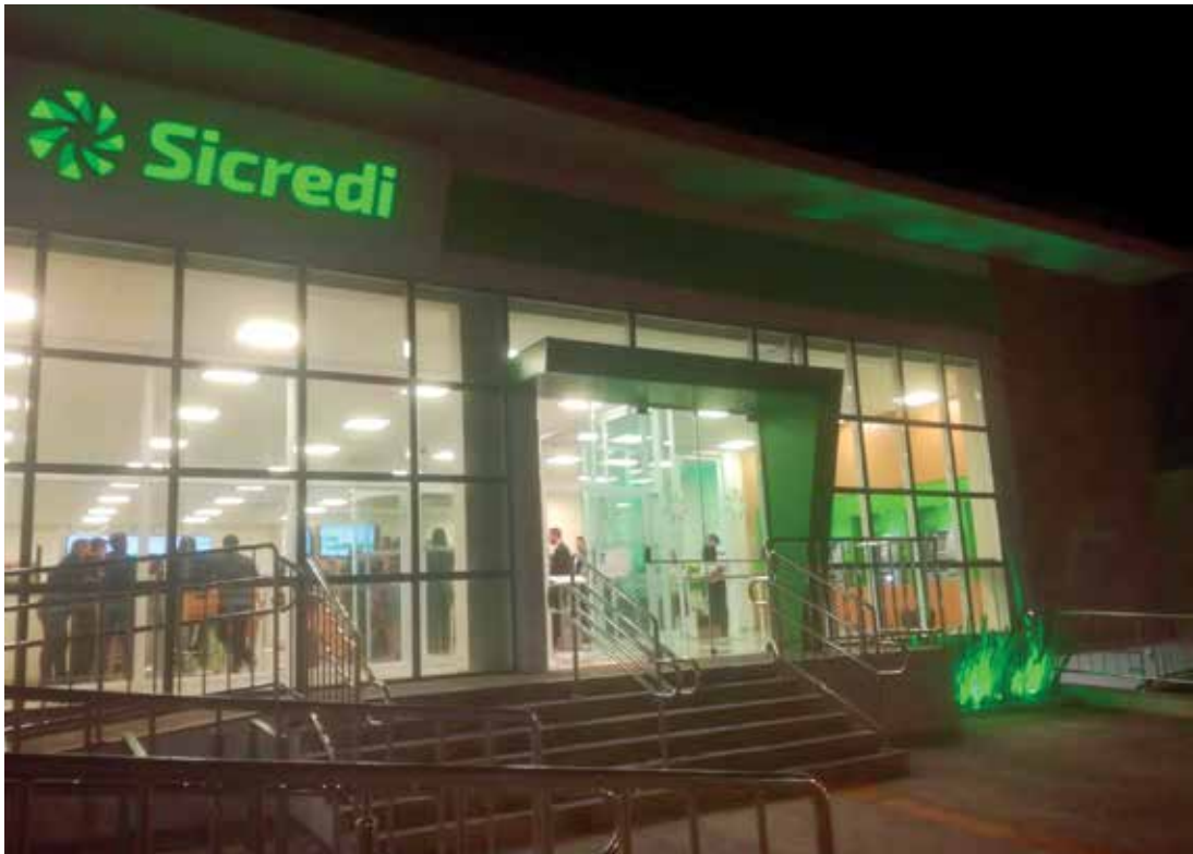
Inauguração aconteceu na noite desta sexta-feira

→ Da REDAÇÃO contato@oextra.net Foi inaugurada na noite de ontem, 28, em Fernandópolis, uma unidade da agência Sicredi. A chegada da instituição na cidade é uma iniciativa da Cooperativa Sicredi Planalto das Águas PR/SP, que investiu mais de R$ 2,5 milhões na nova unidade. A nova agência segue o conceito de ambientação arquitetônica, que busca explorar um dos principais diferenciais da instituição: o relacionamento. Com um espaço de 500 metros quadrados e amplo estacionamento, a agência traz um conceito moderno, com espaços de relacionamento, além dos tradicionais caixas eletrônicos e espaços de gerentes. A agência contará com 120 placas fotovoltaicas para a