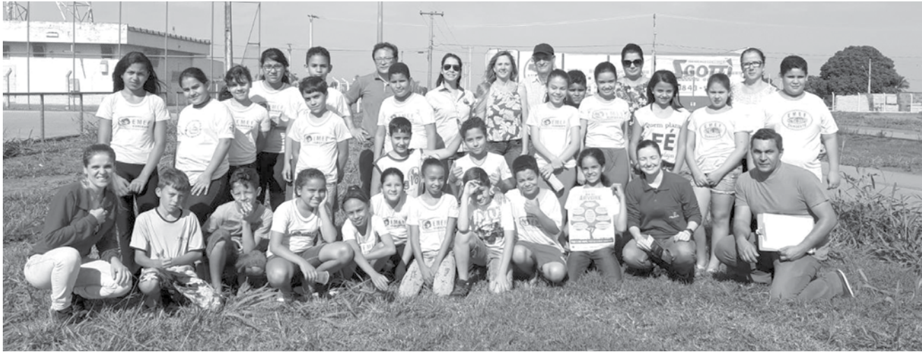
Local escolhido foi os canteiros da pista de caminhada

la construção da ferrovia norte/sul, e tem um compromisso com o impacto ambiental ocasionado pela obra. Foi a empresa quem fez a doação das 150 mudas. As obras da ferrovia têm como principal objetivo escoar a produção agrícola do país e já começaram a ser feitas no Estado de São Paulo. Em Ouroeste o caminho já foi aberto, construído as galerias e as pontes instaladas. "A educação ambiental é constituída de ações sempre com o cunho de conscientizar. Cada ação, por menor que seja, sempre irá fortalecer a consciência de preservação do meio ambiente", explicou a secretária, Elisabete Rodrigues.