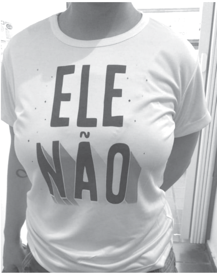
Camisetas com a escrita “Ele Não” foram confeccionadas por algumas participantes

De acordo com a estudante, a manifestação tem como objetivo demonstrar a indignação do grupo contra o candidato. “Seus comentários racistas, homofóbicos, machistas, entre outras atitudes desse cidadão nos causa repúdio. Esperamos abrir os olhos de quem dedica seu voto a ele e trazer consciência e reflexão a quem ainda não se decidiu”, argumenta. TUDO COMEÇOU NAS REDES SOCIAIS As mobilizações começaram a surgir depois do dia 13 de setembro, quando o grupo no facebook “Mulheres Unidas Contra Bolsonaro”, que reuniu mais de dois milhões de integrantes, sofreu um ataque cibernético por parte de apoiadores do candidato. O nome do grupo foi alterado e posteriormente apagado. No dia 16 de setembro, depois de uma investigação e intervenção do Facebook, o grupo foi devolvido às administradoras. Após a ação, as hashtags #EleNão e #MulheresContraoBolsonaro levaram o assunto a ser um dos mais comentados no ranking mundial da internet e receberam adesões de artistas e personalidades nacionais. A campanha che-