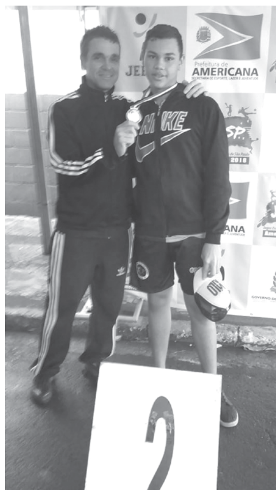
Jovem conquistou duas medalhas em uma final estadual