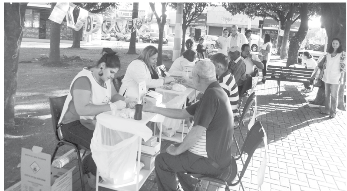
Equipe de profissionais atenderá a população gratuitamente no período da manhã

As pessoas podem ter: dores nos músculos, fadiga, febre, mal-estar ou perda de apetite. Na região genital: úlceras indolores. Também é comum: dor de cabeça, dor de garganta, erupção nos pés e nas mãos, inchaço dos gânglios ou perda de peso. O tratamento consiste no uso de penicilinas. Os parceiros sexuais também devem ser tratados.