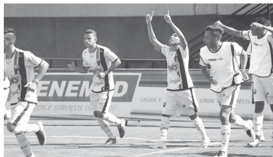
Votuporanguense, que fez a lição de casa no confronto de ida, encara neste sábado, novamente a Ponte Preta