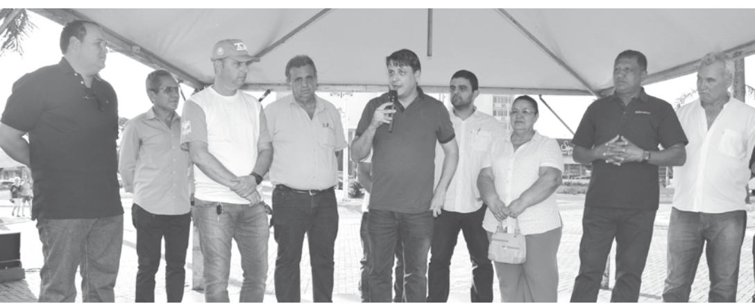
Autoridades, convidados e população prestigiaram primeiro dia da feira

mente ao consumidor. Toda equipe do Sindicato Rural e parceiros, organizadores da feira, participaram da solenidade festiva de lançamento do projeto.