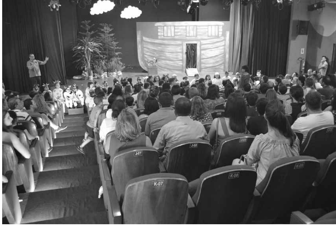
Atores em cena com o espetáculo o 'Embarque de Noe'

Todos os espetáculos têm duas apresentações, uma às 15h e a outra às 20h. Os convites poderão ser ad-