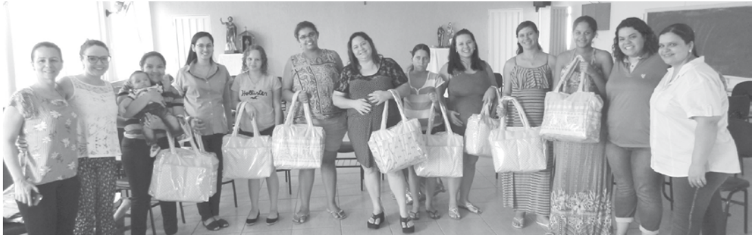
Vários temas foram abordados por uma equipe multidisciplinar de Saúde durante os encontros

A importância da atividade física; Palestra sobre cuidados com a saúde e higiene do bebê; Visita para conhecer a maternidade do município de Ouroeste; Palestra sobre “Saúde Bucal da Gestante e do Bebê”;