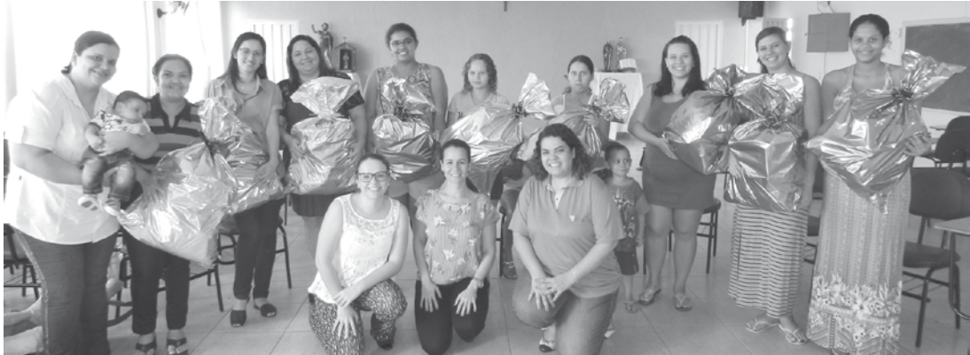
As futuras mães receberam “kits da gestante”, contendo produtos para o bebê