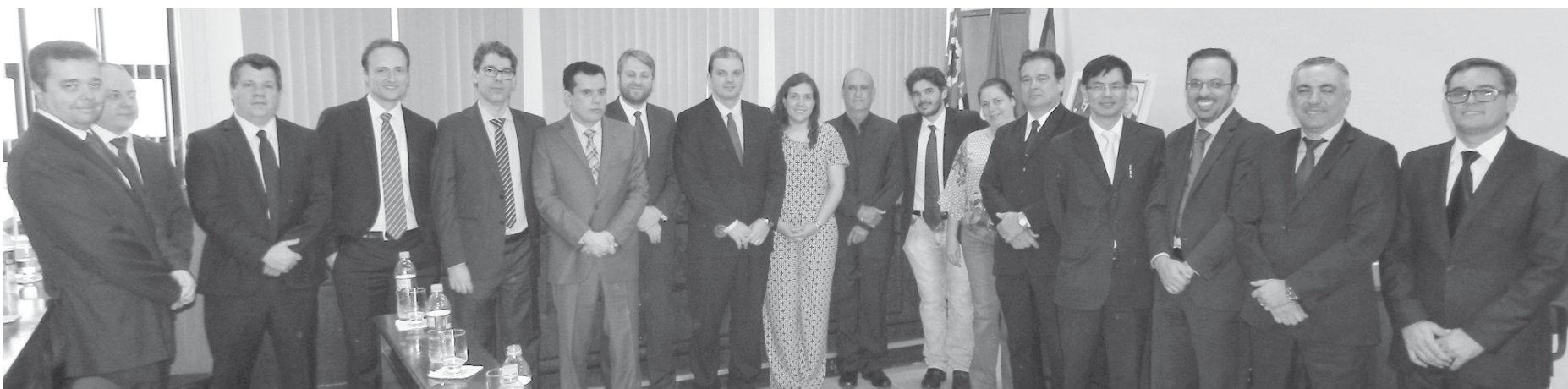
Foto histórica reunindo os principais convidados da cerimônia