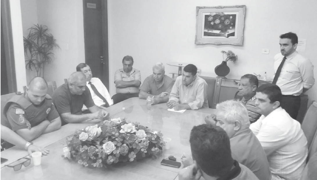
Reunião na Câmara Municipal apresentou detalhes do projeto de vigilância e instalação de câmeras em Fernandópolis

PARCERIA COM O PODER PÚBLICO Os pontos da cidade que contarão com câmeras de vigilância serão definidos pelas Polícias Civil e Militar. A Praça da Matriz, no Centro, será o próximo local a ser monitorado