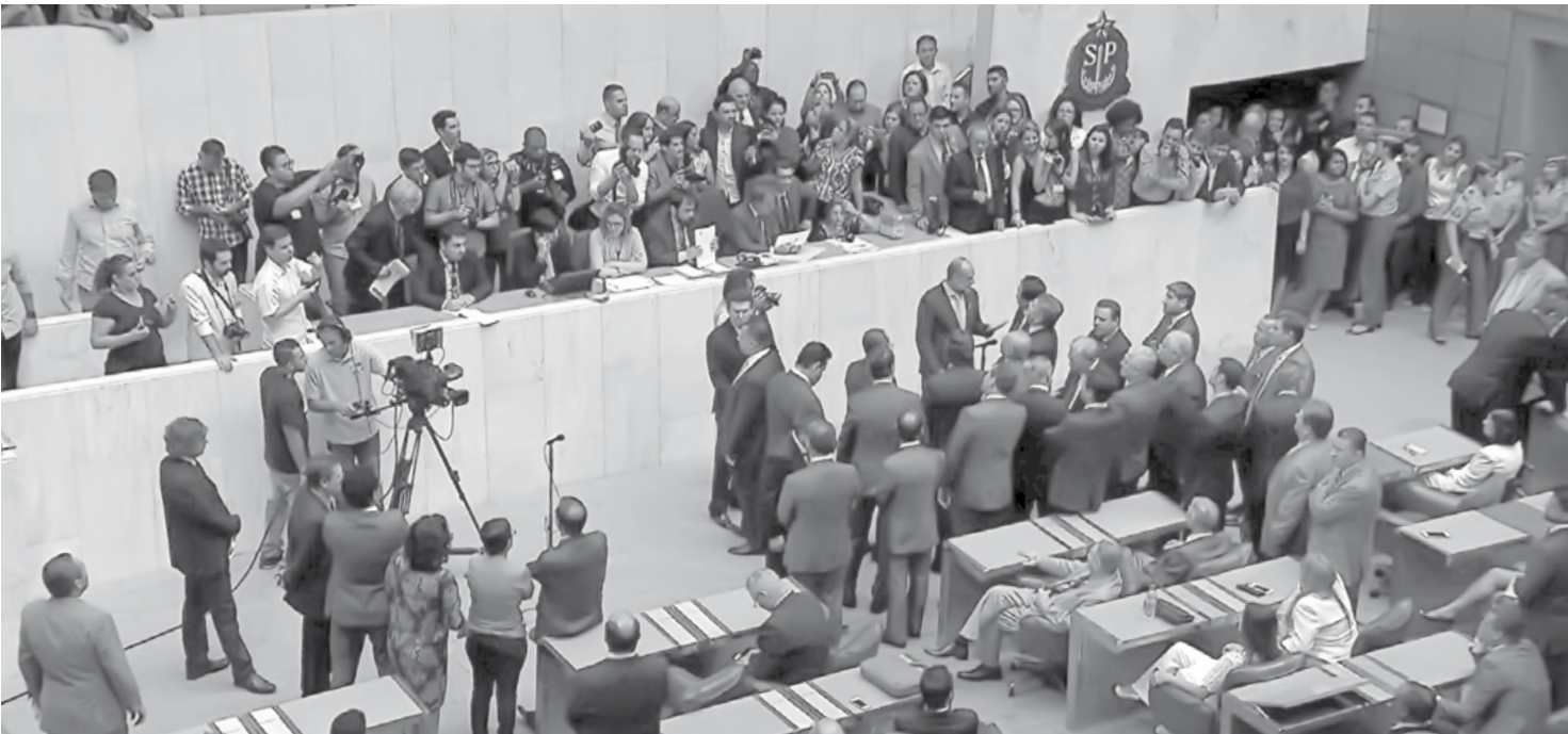
Projetos foram aprovados na Assembleia Legislativa

Paulo. Esse número vai crescer com a abertura de novos destinos e a multiplicação de atrativos como monumentos históricos, artesanato, belas paisagens, manifestações culturais, hospitalidade e boa gastronomia. Para receber a classificação de “Município de Interesse Turístico” é necessário ter potencial turístico; dispor de serviço médico emergencial e, no mínimo, dos seguintes equipamentos e serviços turísticos: meios de hospedagem no local ou na região, serviços de alimentação e serviço de informação turística; dispor de infraestrutura básica capaz de atender às populações fixas e flutuantes no que se refere a abastecimento de água potável e coleta de resíduos sólidos; possuir expressivos atrativos turísticos, plano di-