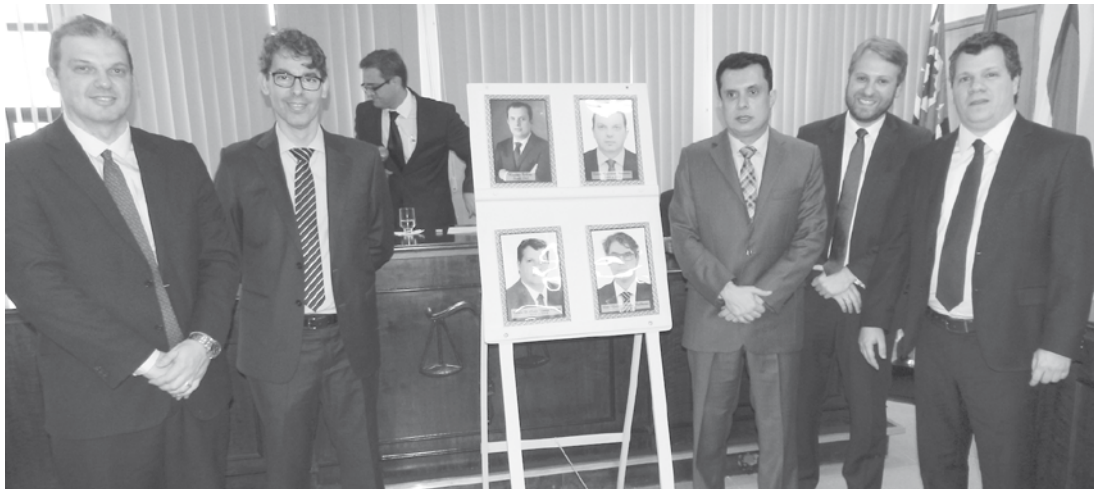
Galeria de retratos dos juízes, homenageando os magistrados que atuaram na Comarca pelos relevantes serviços prestados