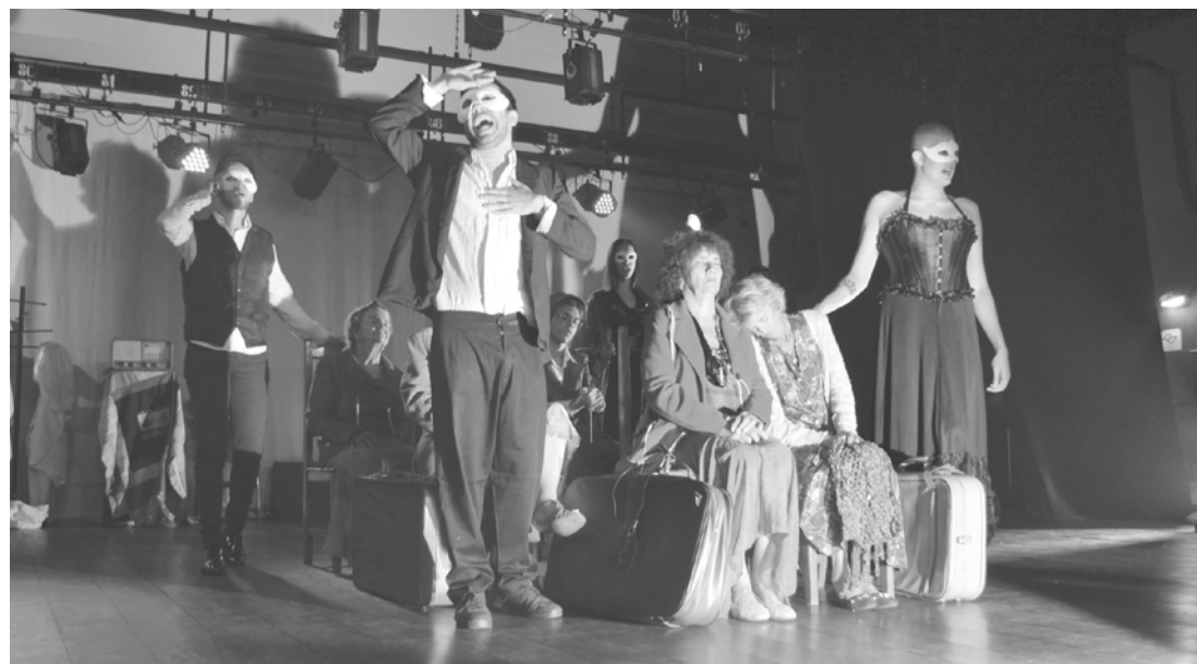
Crianças, jovens e idosos dividiram o palco em apresentação da Unati