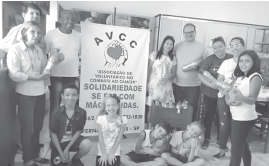
Alunos visitaram a sede da entidade e do Hospital do Câncer antes de oficializarem entrega dos lacres