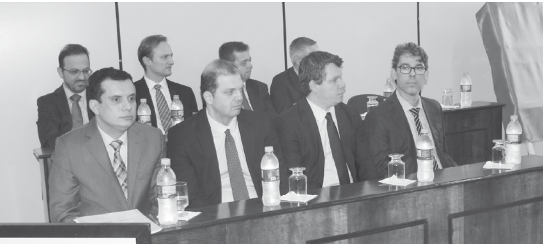
O Fórum de Ouroeste marcou os 10 anos de instalação com a homenagem de todos os magistrados que atuaram na Comarca

rum da cidade possui uma única vara, ou seja, tem competência geral para resolução de diversos tipos de processos. A unidade é totalmente informatizada e a terceira no Estado a utilizar o processo digital, sem nenhum papel.