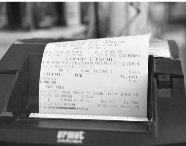
Empresas no Brasil gastam 1.958 horas ao ano para preparar documentos para recolher tributos