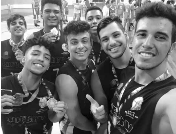
Atletas comemorando a terceira colocação conquistada no domingo passado