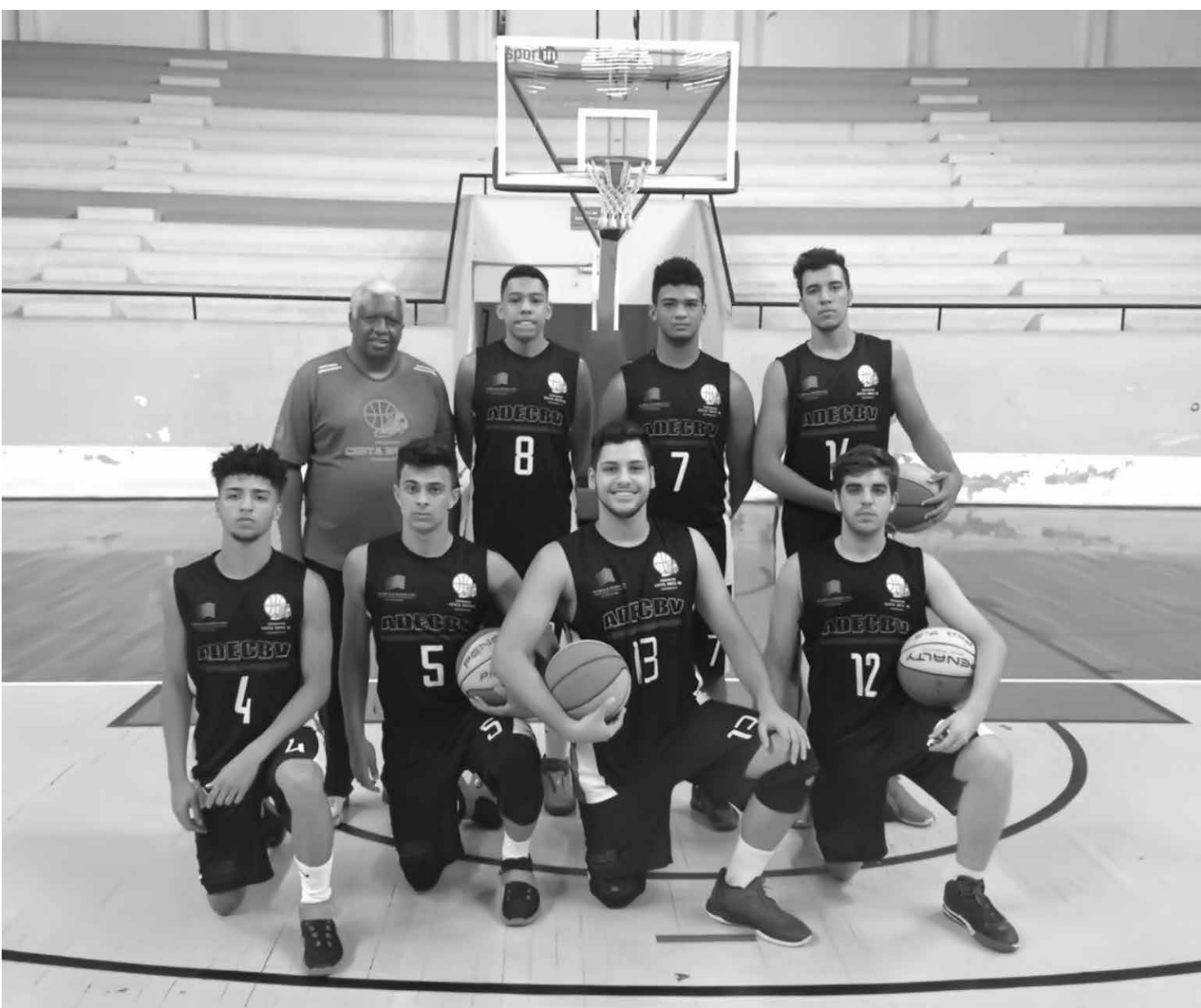
Time “Cesta Nota 10” de Fernandópolis, bronze no Basketball Paulista 2017 na categoria Sub-17

“A força vem da Fé, e Deus é quem nos sustenta e mantém a nossa luta. Ele é único digno de louvor, honra e glória. Deus é fiel em todos os momentos!”