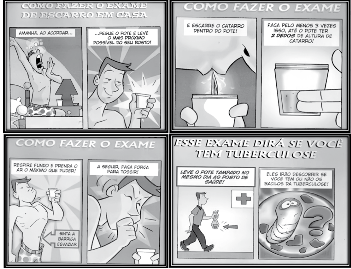
Ilustração de como fazer o exame de escarro

Sua transmissão é aérea, ou seja, ocorre a partir da inalação de aerossóis. Ao falar, espirrar e, principalmente, ao tossir, as pessoas com tuberculose ativa lançam no ar partículas em forma de aerossóis que contêm bacilos, sendo denominadas de bacilíferas. Os sintomas da doença são: tosse, perda de peso, sudorese noturna e febre. Toda pessoa com tosse a mais de duas semanas deve procurar uma unidade de saúde para fazer o exame de escarro.