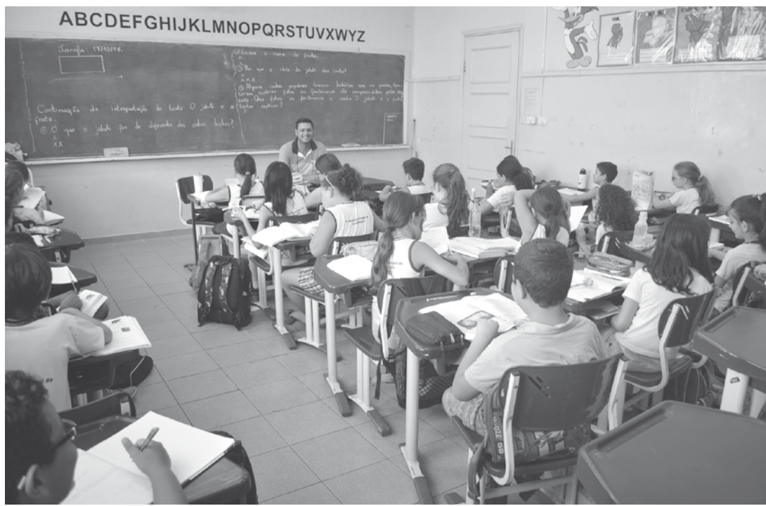
Professores foram capacitados para orientar e preparar alunos