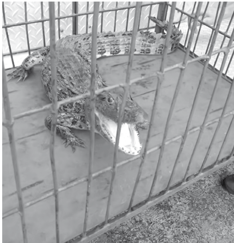
Jacaré é encontrado em tanque de propriedade rural de Estrela d'Oeste