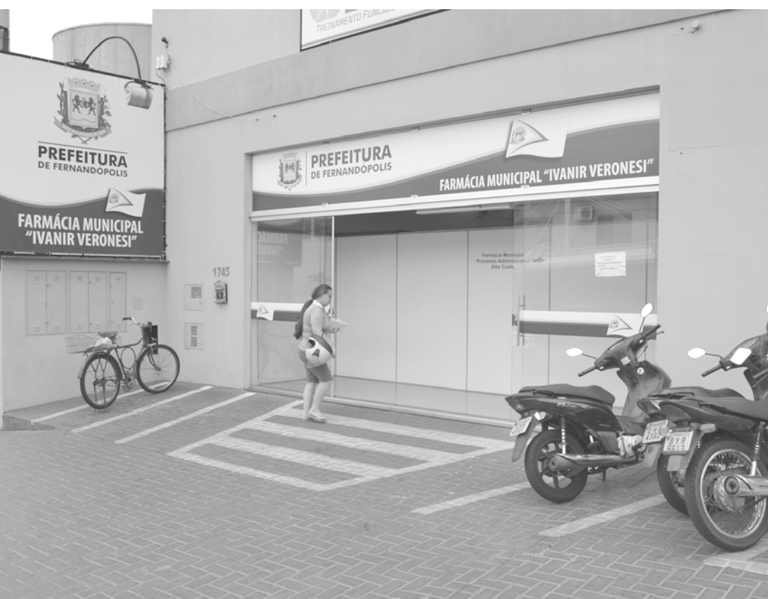
Prédio ficará fechado neste dia para adequações

Unidades de saúde vão distribuir medicamentos normalmente