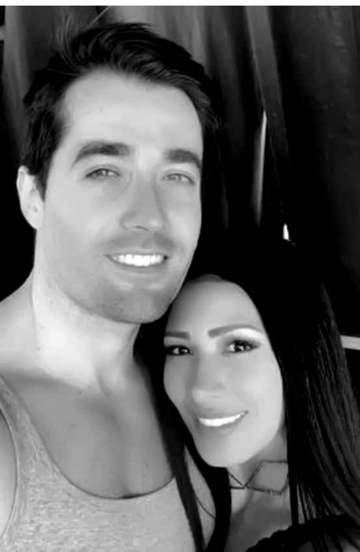
Cantora se declarou para o marido