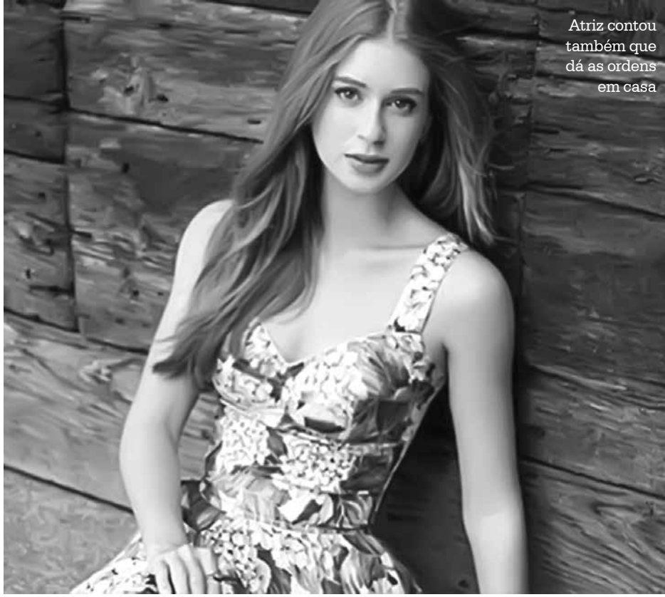
Atriz contou também que dá as ordens em casa

"A proposta era interessante, com uma equipe em que confio. O que eles me propuseram era a minha cara com o corpo da Gisele Bündchen e o papel enrolado (risos). Era para ser legal, mas acho que, cada vez mais, tudo pode virar uma polêmica na internet. Está tudo politicamente correto demais. As pessoas estão polemizando muito."