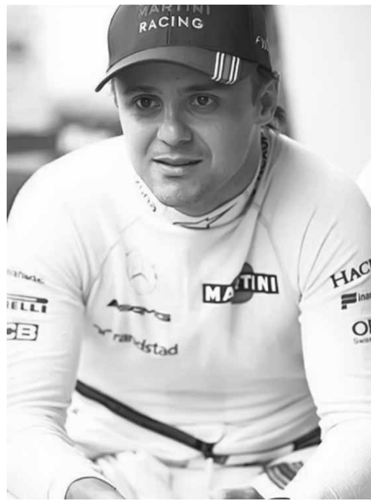
Piloto lembra episódio com Ayrton Senna

Durante o afastamento de Waack, a jornalista Renata Lo Prete comandará o Jornal da Globo. No início do telejornal desta madrugada (9), ela leu o texto do comunicado que anunciou o afastamento do apresentador.