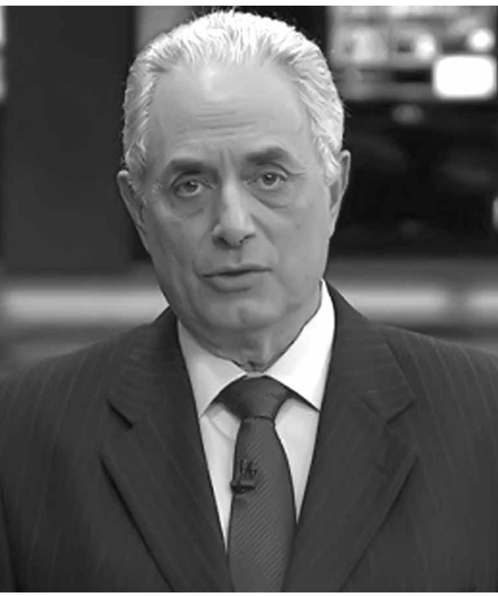
O âncora William Waack na bancada do Jornal da Globo: ele afirma não se lembrar de fala

O jornalista William Waack não apresentou o Jornal da Globo desta quarta-feira (8). E não voltará à bancada pelos próximos dias. A Globo decidiu afastar o âncora do jornalístico após vazarem na internet um vídeo em que Waack faria comentários racistas em um intervalo do programa. No comunicado divulgado à imprensa, a emissora afirma que é "visceralmente contra o racismo em todas as suas formas e manifestações" e aponta que o vídeo de Waack tem "comentários, ao que tudo indica, de cunho racista".