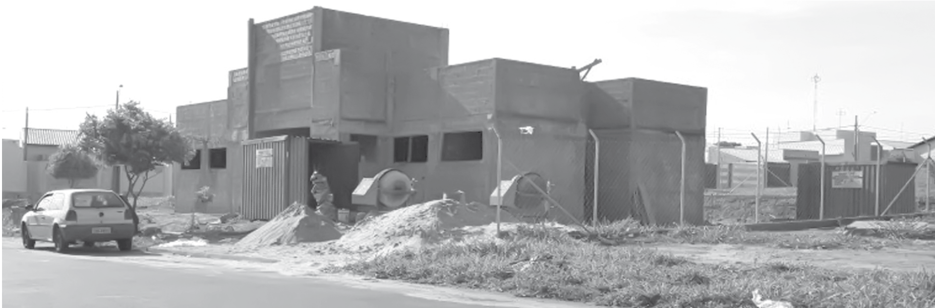
Com previsão de término no meio do ano que vem, o prédio já tem 95% da parte de alvenaria realizada

A empresa contratada para a execução da obra é Uni-con Obras e Instalações, que tem o prazo de 12 meses para a conclusão dos serviços,