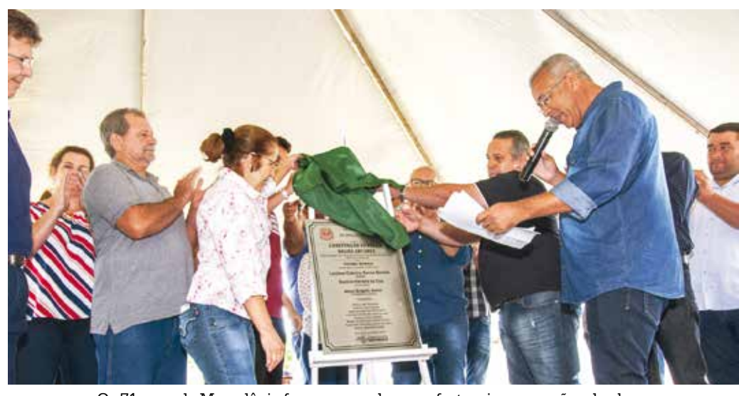
Os 71 anos de Macedônia foram marcados com festa e inaugurações de obras