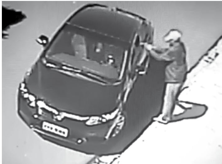
Suspeito atira contra o empresário

pessoa, que também foi presa, de cometer o crime. A tentativa de homicídio aconteceu na região central de Valentim Gentil. O suspeito foi encaminhado para Cadeia Pública de Santa Fé do Sul, na qual, até o fechamento desta edição, permanecia à disposição da Justiça.