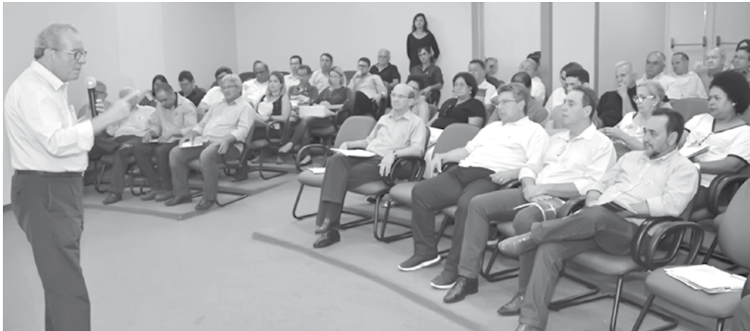
Senador e presidente do ITV fez palestra em Votuporanga a convite do deputado estadual Carlão Pignatari

O presidente do Instituto Teotônio Vilela (ITV), o suplente de senador José Aníbal (PSDB), fez uma palestra nesta sexta-feira (10), no auditório da Associação Comercial de Votuporanga, a convite do deputado estadual Carlão Pignatari (PSDB). A prefeitos, vereadores e políticos da região, Aníbal falou sobre a atual conjuntura da política nacional. Um dos pontos importantes de sua fala foi a sugestão feita aos prefeitos e gestores. “Fiquei impressionado com a cidade de Votuporanga, tudo bem arrumadinho, com um campus universitário invejável. Não vim aqui para trazer nenhuma receita, mas quero deixar uma sugestão para os prefeitos e gestores: que vocês se unam para atrair empresas e investimentos para a