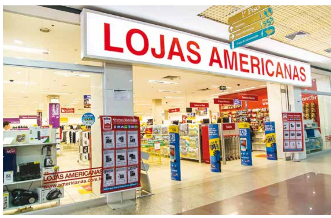
A Lojas Americanas foi fundada em 1929 e está presente em todos os estados do país

fundada em 1929 e está presente em todos os estados do país, com 1.200 lojas. A rede de lojas físicas comercializa mais de 60 mil itens de 2 mil fornecedores ativos, garantindo a seus clientes preços competitivos e oferecendo produtos de qualidade reunidos em cerca de 40 departamentos como bombonière, perfumaria, utilidades domésticas, brinquedos, games, celula-