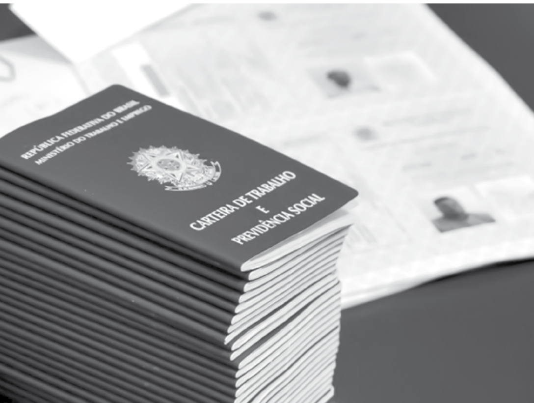
No melhor mês de outubro em 4 anos, Brasil cria 76 mil vagas formais de trabalho

O Ministério do Trabalho informou também que, nos últimos doze meses, porém, as demissões superaram as contratações em 294.305 vagas com carteira assinada.