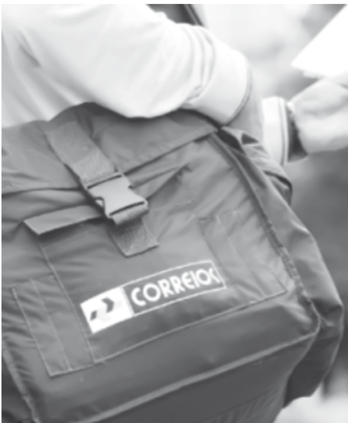
A oitava edição no Brasil, que ocorre no dia 24 de novembro, promete movimentar o comércio eletrônico

“Queremos proporcionar uma excelente experiência tanto para quem vende quanto para quem compra pela internet em qualquer época do ano. Como nesse