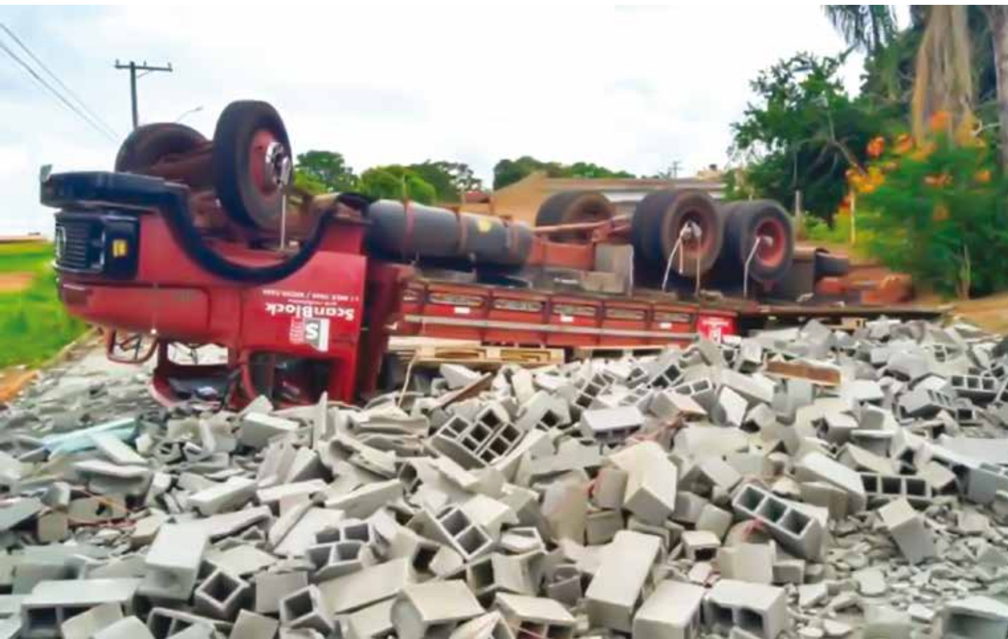
Fato aconteceu nesta segunda-feira

O motorista contou aos policiais militares que não sabe explicar o que aconteceu. O caso é investigado.