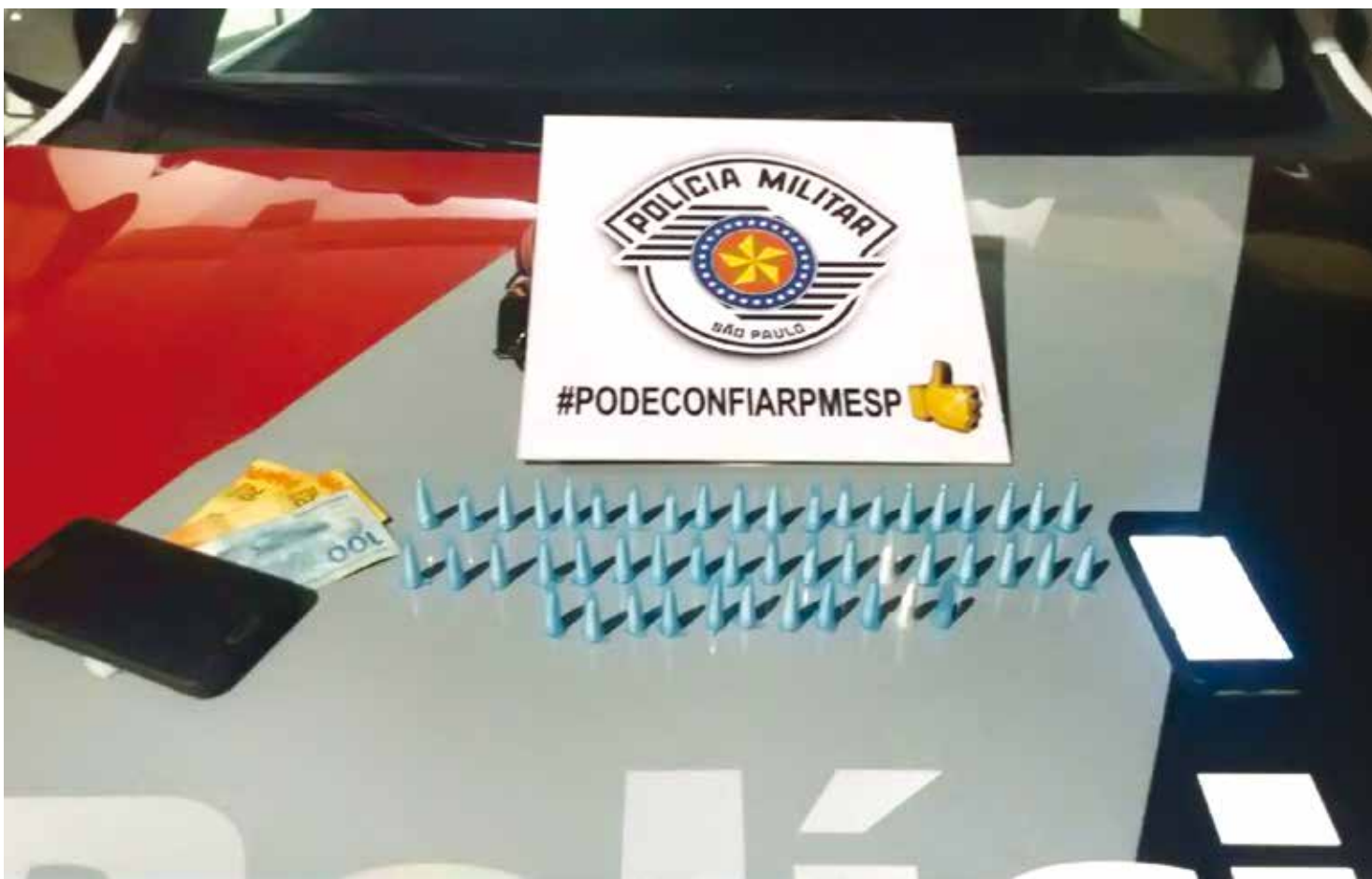
Entorpecentes, dinheiro e aparelhos celulares apreendidos pela PM durante o registro da ocorrência