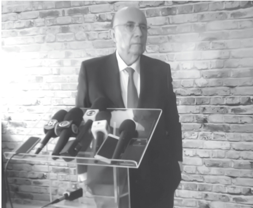
Ministro da Fazenda, Henrique Meirelles

Sobre a nova versão da reforma da previdência, Meirelles disse que o governo não irá abrir mão, ao menos, de três itens.