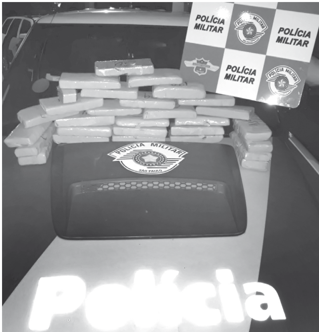
Dupla foi presa em flagrante transportando 29 tabletes da droga

A dupla foi presa em flagrante por tráfico de drogas. Eles ficarão detidos na cadeia de Santa Fé do Sul à disposição da justiça.