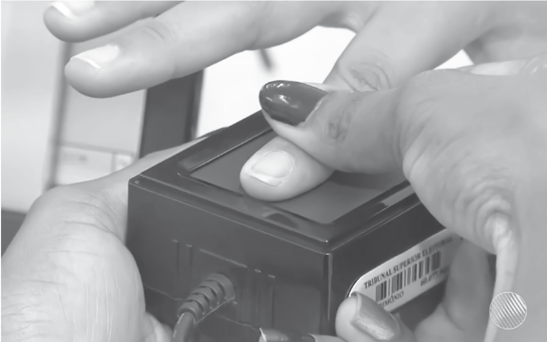
Biometria tem objetivo de tornar as eleições mais seguras

Segundo o TSE, o cadastramento biométrico ocorre em todo o país desde 2008, mas os prazos são estabelecidos em cada estado pelo Tribunal Regional Eleitoral (TRE). Veja a lista de endereços dos sites