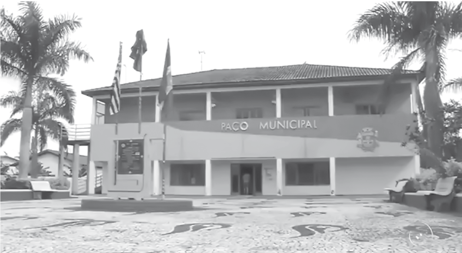
Ex-prefeito de Turmalina está envolvido em irregularidades, segundo a PF

blica, em 2010, para o tratamento de depressão. Porém, durante a licença, ele firmou contrato com diversos municípios e atuou prestando serviço de consultoria na área tributária. INVESTIGAÇÃO Durante a Operação Cajado, deflagrada pela Polícia Federal de Jales no dia 7 de novembro, os prefeitos de Turmalina e Guarani D'Oeste ficaram presos por 10 dias. A operação investigou fraudes e desvios de recursos públicos ocorridos durante a administração do ex-prefeito Odair Vazarin (PSD), de Guarani d'Oeste.