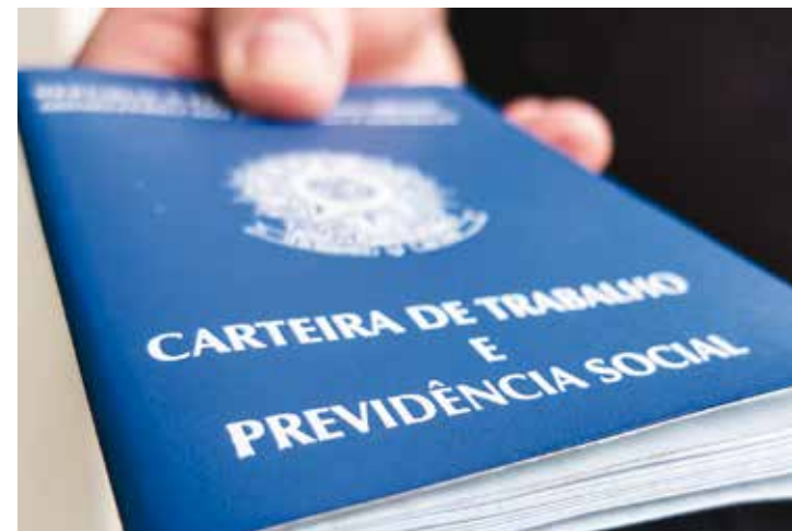
Outubro registrou 520 contratações

“Ficamos muito felizes com os resultados alcança-