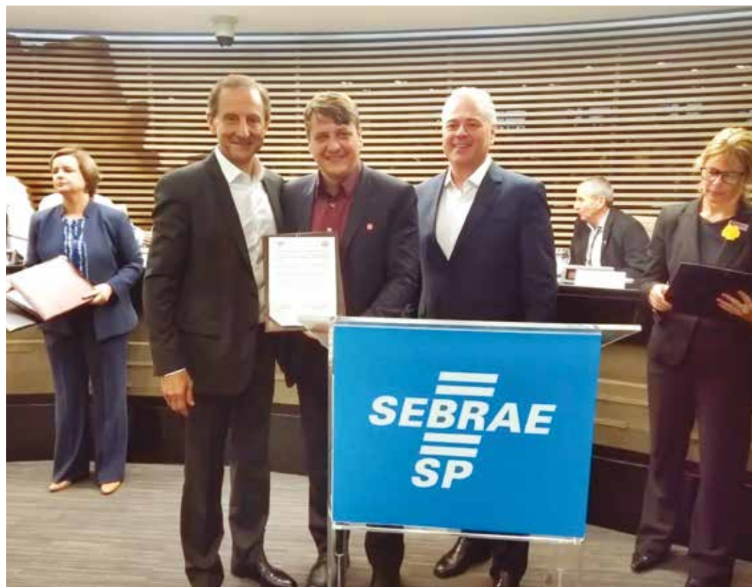
Momento pós assinatura na sede da FIESP em São Paulo