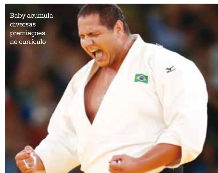
Baby acumula diversas premiações no currículo