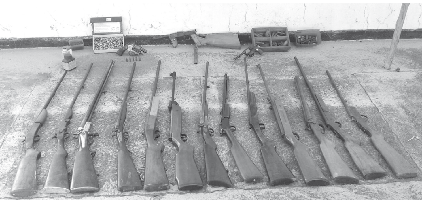
Armas apreendidas na oficina clandestina

chas que seriam vendidas. Os três foram presos em flagrante e encaminhados para a Cadeia Pública de Santa Fé do Sul, na qual, até o fechamento desta edição, permaneciam à disposição da Justiça.