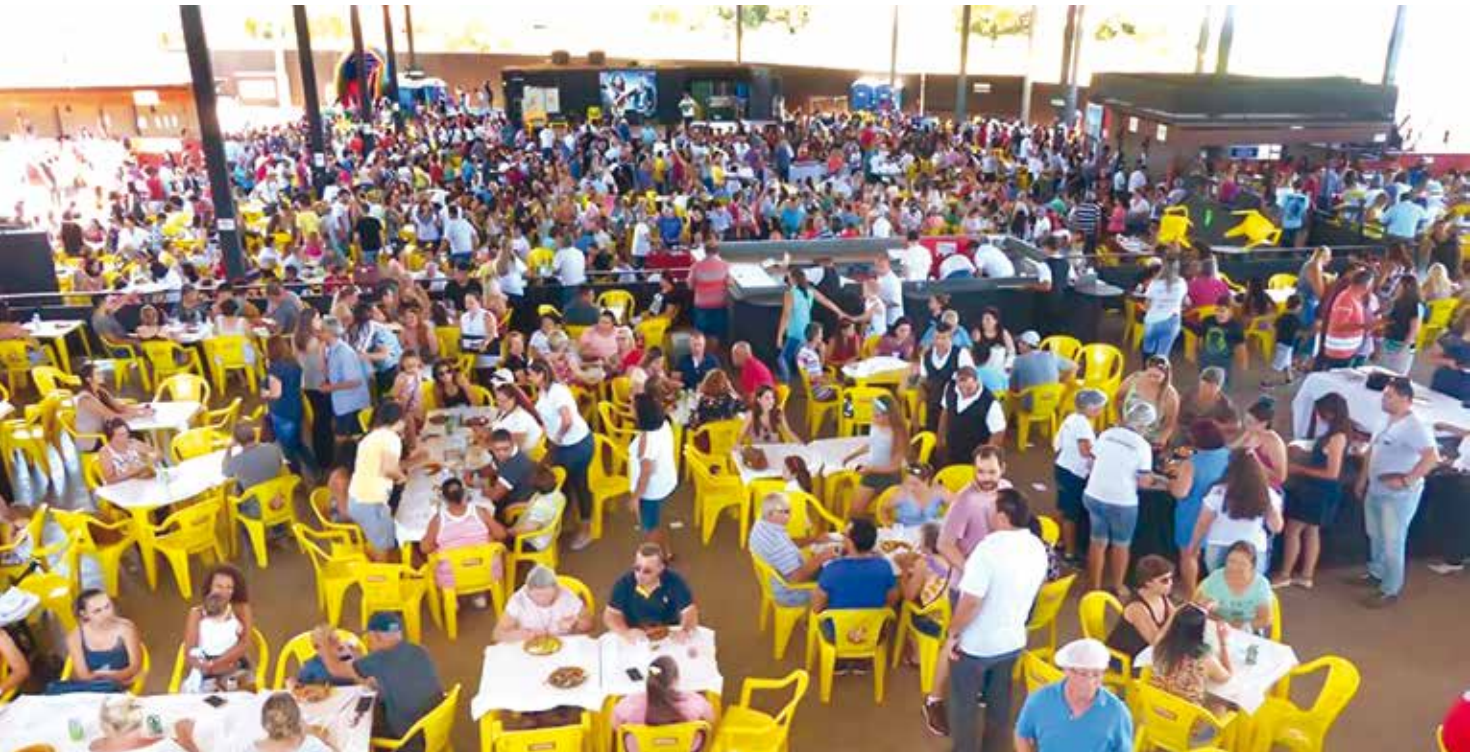
Ao todo, cerca de 2,5 mil pessoas participaram do evento

evento poder apresentar esse importante resultado a nossa comunidade. Em nome da nossa Santa Casa, só temos a agradecer aos diversos colaboradores, voluntários, doadores, compradores e nossa população, que não mediu esforços e foi parte essencial para o sucesso do Leilão".