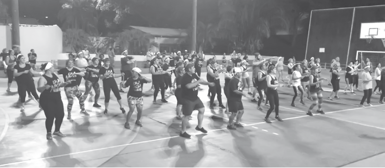
Vista-se de azul, colabore e participe da aula