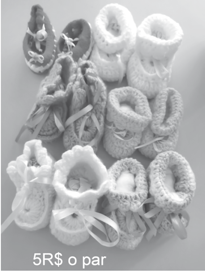
Produtos artesanais, lembrancinhas, quadros e enfeites são alguns dos itens disponíveis

lazer, exercício dos direitos civis e fortalecimento dos laços familiares e comunitários. O CAPS também oferece atendimento aos usuários em seus momentos de crise; e apoia eles e suas famílias na busca de independência e responsabilidade