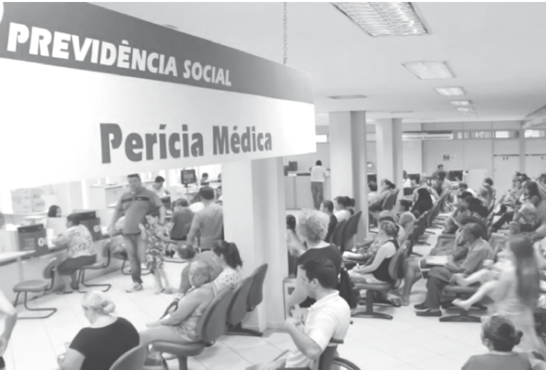
MPF quer saber da Gerência Executiva do INSS de Rio Preto quais medidas administrativas estão sendo tomadas nas agências de Jales, Fernandópolis, Santa Fé do Sul e General Salgado