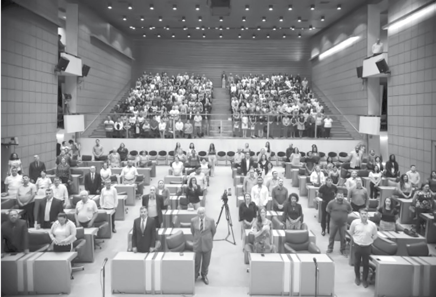
Centenas de conselheiros tutelares e ex-conselheiros foram homenageados pelos serviços prestados no exercício da função