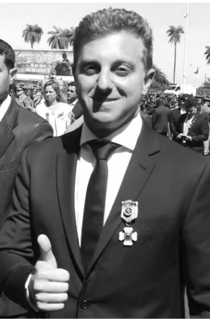
O apresentador da TV Globo Luciano Huck

O apresentador da TV Globo e empresário Luciano Huck confirmou nesta segunda-feira que não será candidato à Presidência da República, em 2018. Ele afastou as especulações sobre a sua candidatura e ressaltou que está fora da corrida presidencial. Ele destacou que seus pais, sua mulher Angélica, seus filhos, seus familiares e seus amigos próximos o impediram que o “deixasse levar pelos sons dos chamados quase irresistíveis”. “Quem se interessa pelo que sou e faço pode acreditar: vou atuar cada vez mais, sempre de acordo com minhas crenças, em especial com a fé enorme que tenho neste país. Contem comigo. Mas não como candidato a presidente”, escreveu o apresentador, que prometeu ir “além da voz amplificada pela televisão, do eco das redes sociais e do instituto que criou para ajudar e agregar ao país. “E, para isso, não são necessários partidos, cargos, nem eleições”.