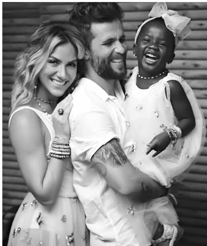
Socialite chamou a filha dos atores de “macaca”

O apresentador ressaltou que sua reação natural ao ver seu nome apontado, sem tê-lo oferecido, foi “tentar entender melhor do que se tratava”. Ele voltou a frisar que sua geração hoje trabalha e inova “com vigor em muitas frentes”. “Mas, pela política, tem feito pouco”, reconheceu.