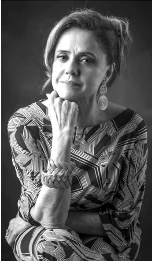
Marieta condena o preconceito racial: “Temos que ser inclementes com o racismo, não dá para relativizar”