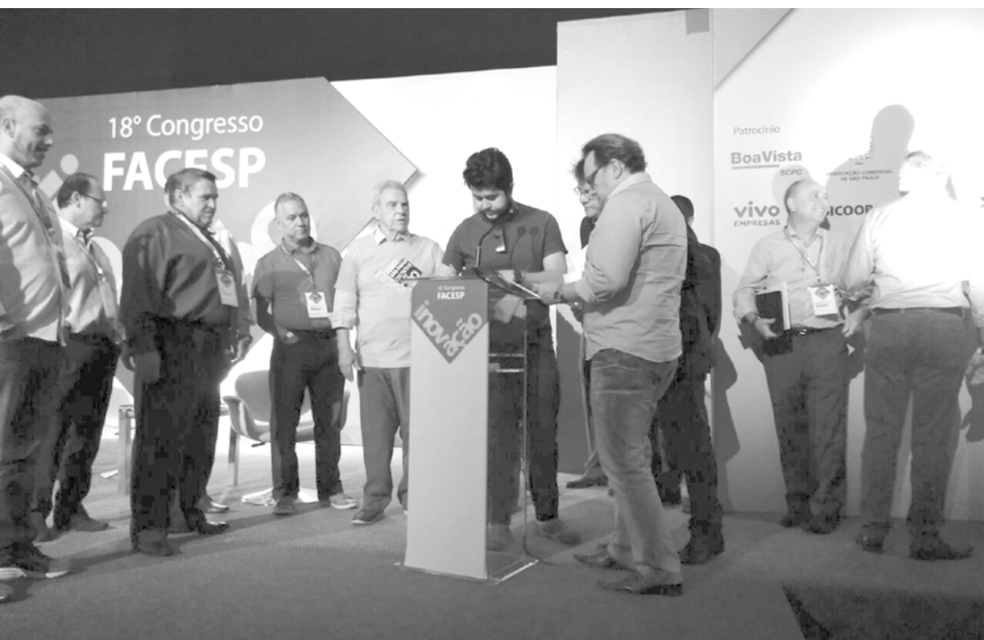
Congresso foi realizado de 22 a 24 de novembro com o tema "Inovação" para mais de mil pessoas