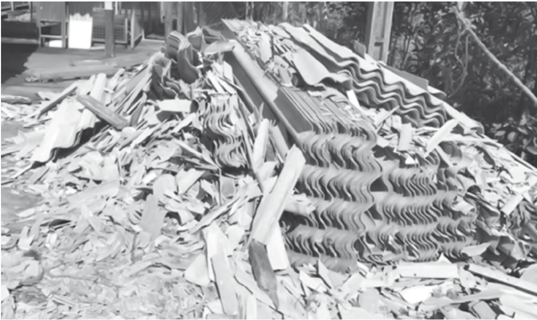
Vários estados já proíbem a comercialização deste produto

No entanto, ao julgar essas ações nesta quarta, a Corte decidiu banir o uso do amianto na indústria da construção civil.