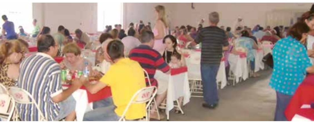
Evento terá início a partir das 11h30

*Com informações da Secretaria de Comunicação