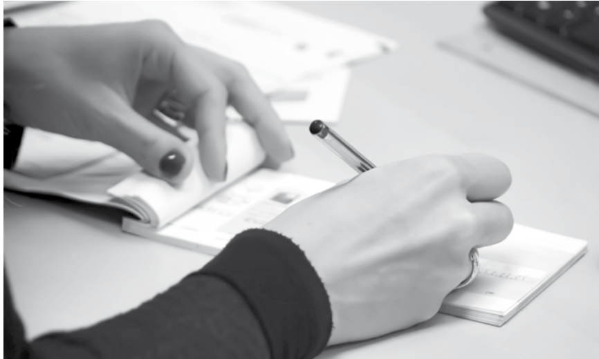
O BC explica que a redução do uso desse meio de pagamento faz com que não seja mais justificável a existência de prazos diferentes para a compensação

Enquanto o volume de cheques compensados caiu drasticamente, o uso do cartão cresceu exponencial-