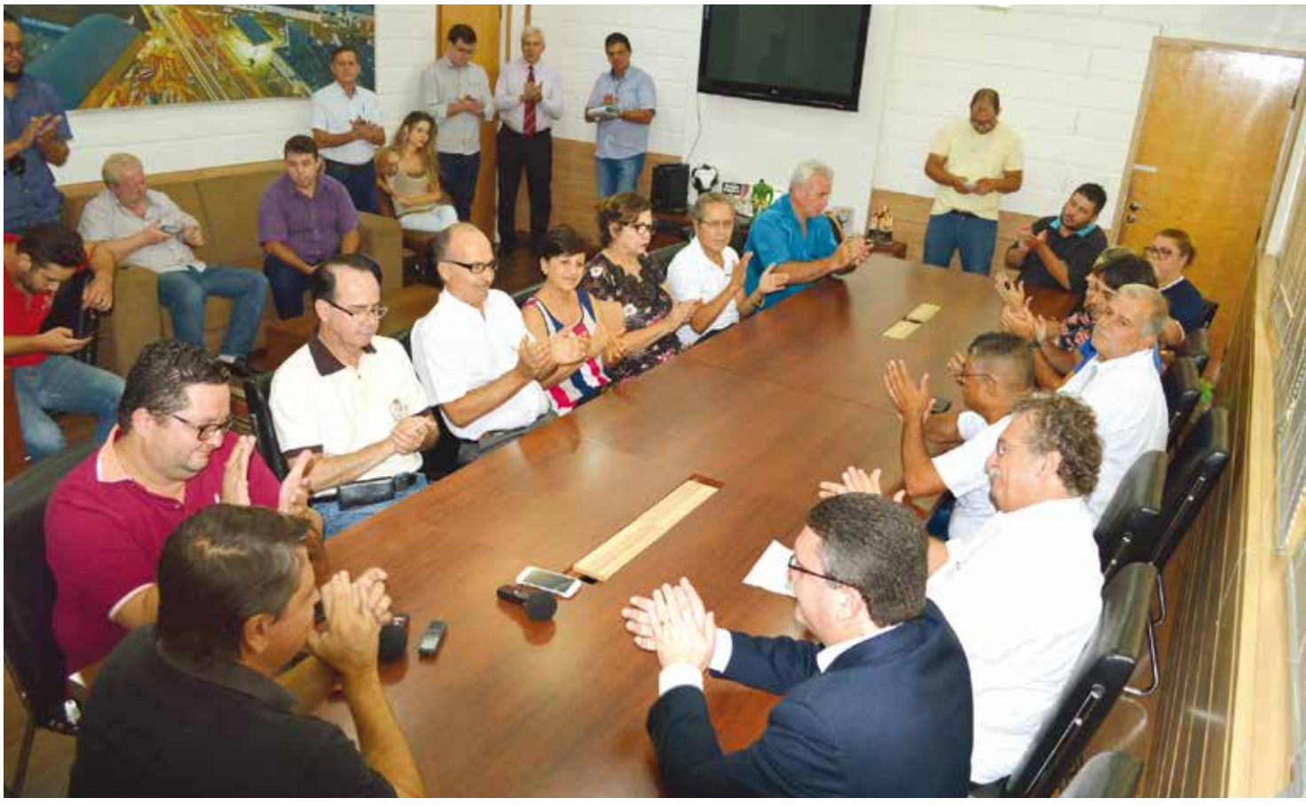
Coletiva de divulgação das novas vagas realizada no gabinete do prefeito