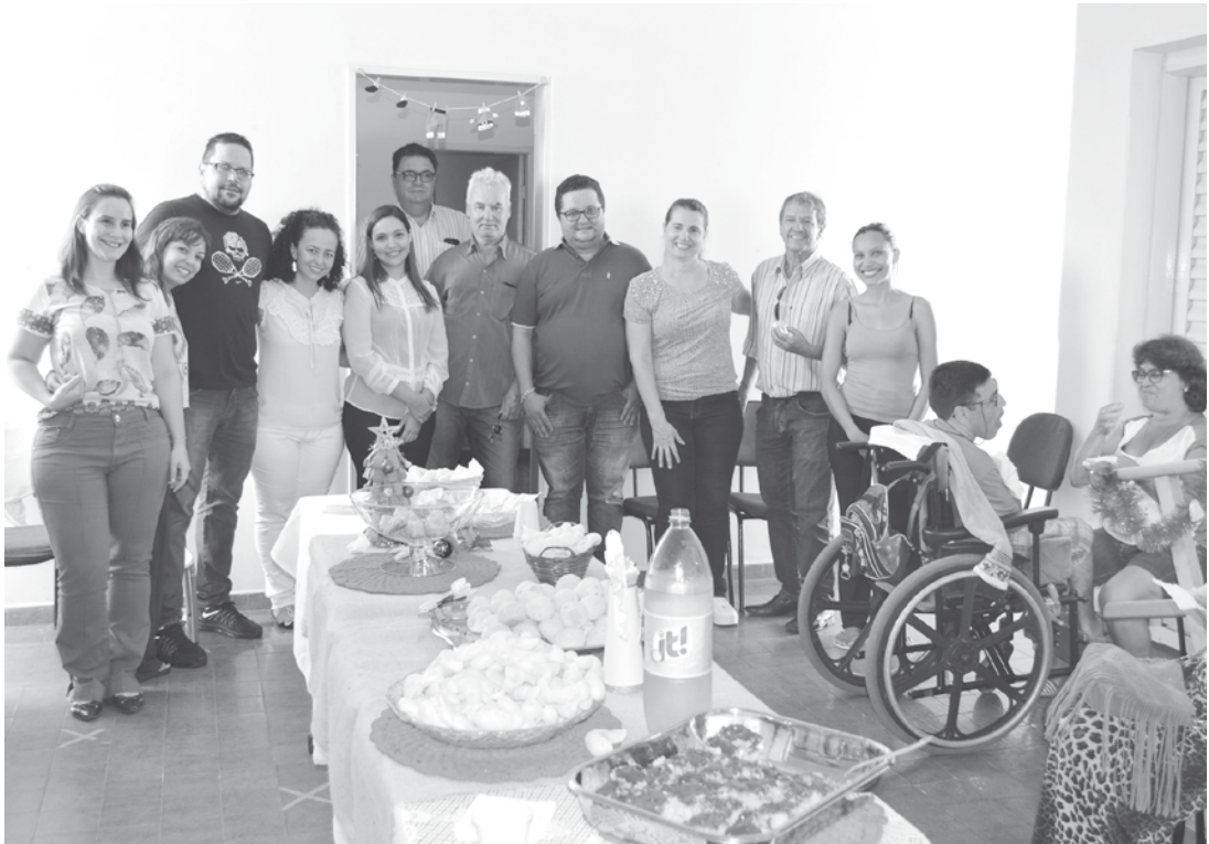
Primeira etapa do projeto foi encerrada com café da manhã oferecido aos participantes

O final da primeira etapa do projeto foi comemorado com um café da manhã nesta quarta-feira, 29, oferecido aos participantes. O vice-prefeito Gustavo Pinato fez questão de prestigiar o momento e parabenizar os organizadores pela iniciativa, bem como todos os participantes, uma oportunidade que tiveram de conhecer mais a doença e suas consequências e sintomas, sabendo enfrentar as dores e sensações causadas. Também foi um momento de interação da equipe, troca de experiências e muitos aprendizados. Agora já nos preparamos para atender