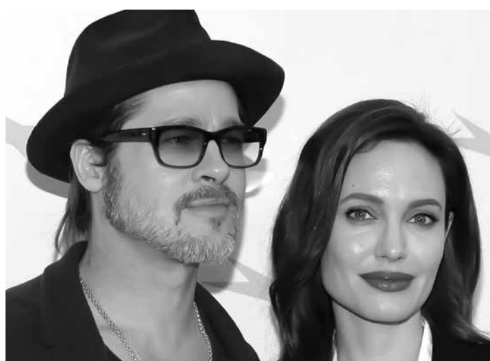
A atriz estaria arrependida em relação à separação

Mais de um ano após a separação, Angelina Jolie e Brad Pitt ainda enfrentam desacordos em relação à assinatura do divórcio. Segundo o site “Hollywood Life”, dessa vez, a atriz teria recusado um acordo de cerca de R$ 327 milhões.