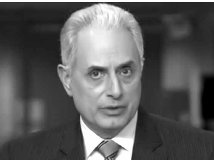
O âncora continua afastado da bancada do Jornal da Globo

Após polêmico afastamento da Rede Globo, William Waack já tem portas abertas na concorrência, no SBT mais precisamente. Silvio Santos, dono do canal, já declarou que o jornalista tem lugar na sua emissora. E mais: que ele o colocaria imediatamente para trabalhar.