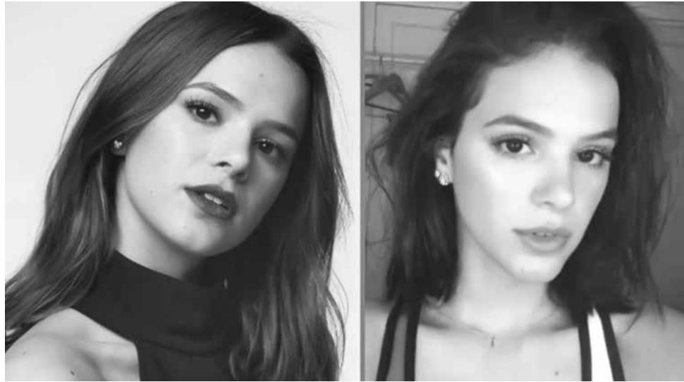
À esquerda, Bruna Marquezine em foto no primeiro semestre; à direita, a atriz cinco quilos mais magra