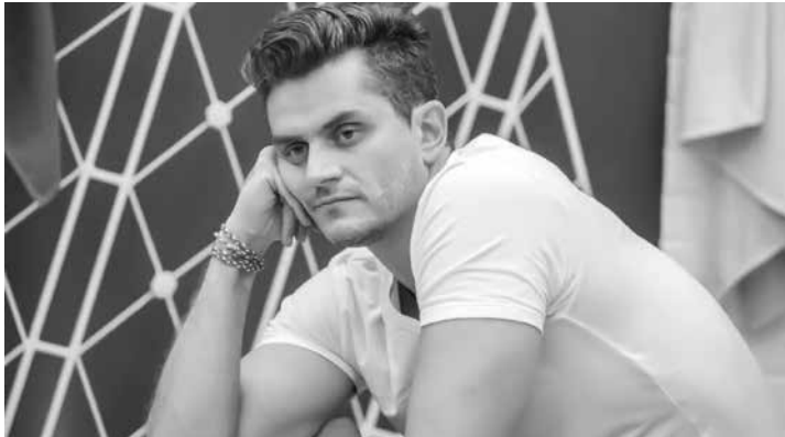
Ele foi acusado de agredir sua namorada durante o reality show da Globo