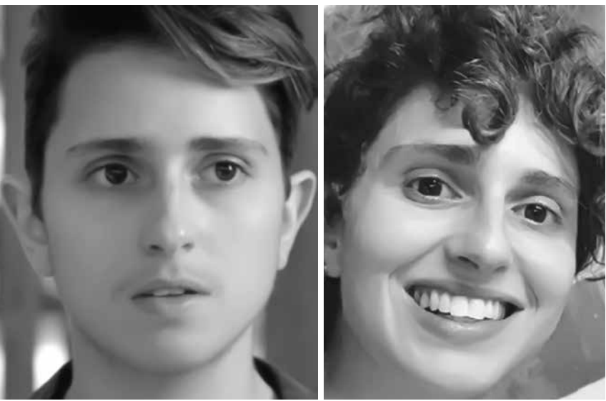
À esquerda, Carol Duarte como Ivan e, à direita, com novo visual