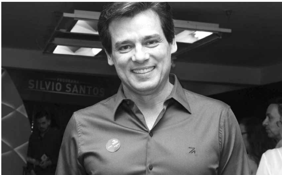
O apresentador sofreu algumas reviravoltas no decorrer deste ano

de volta, em 2018, as horas que perdeu no ‘Domínio Legal’ para um programa da Disney. Cercado de especulações, Portioli afirmou que não tem intenção de substituir Raul Gil aos sábados, numa vaga que pode ficar aberta em breve.