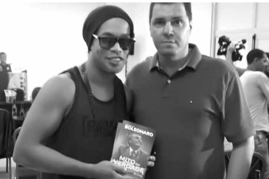
Craque vai se candidatar ao Senado em 2018