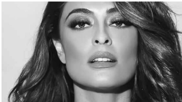
A atriz aplica o produto a cada 15 dias nas madeixas

te quando você pinta, ou faz algum outro procedimento químico, eleva muito o pH do cabelo. O vinagre ajuda a abaixar e a selar as escamas dos fios”, disse em entrevista. Confira a fórmula da atriz: “A cada 15 dias faço uma mistura de água com uma colher de vinagre (de maçã). Borriço nos fios e deixo secar naturalmente. Na hora tem cheiro, mas depois que seca você não sente nenhum resquício”, conta.