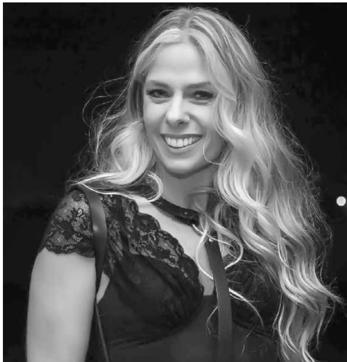
A apresentadora sofreu a perda aos 15 anos