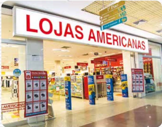
A Lojas Americanas foi fundada em 1929 e está presente em todos os estados do país

A Lojas Americanas foi fundada em 1929 e está presente em todos os estados do país, com 1.200 lojas. A rede de lojas físicas comercializa mais de 60 mil itens de 2 mil fornecedores ativos, garantindo a seus clientes preços competitivos e oferecendo produtos de qualidade reunidos em cerca de 40 departamentos como bombonière, perfumaria, utilidades domésticas, brinquedos, games, celulares, eletrodomésticos, eletrônicos, CD's e DVD's, livros, vestuário e papelaria. A rede conta ainda com quatro Centros de Distribuição localizados em São Paulo/SP, Rio de Janeiro/RJ, Recife/PE e Uberlândia/MG.