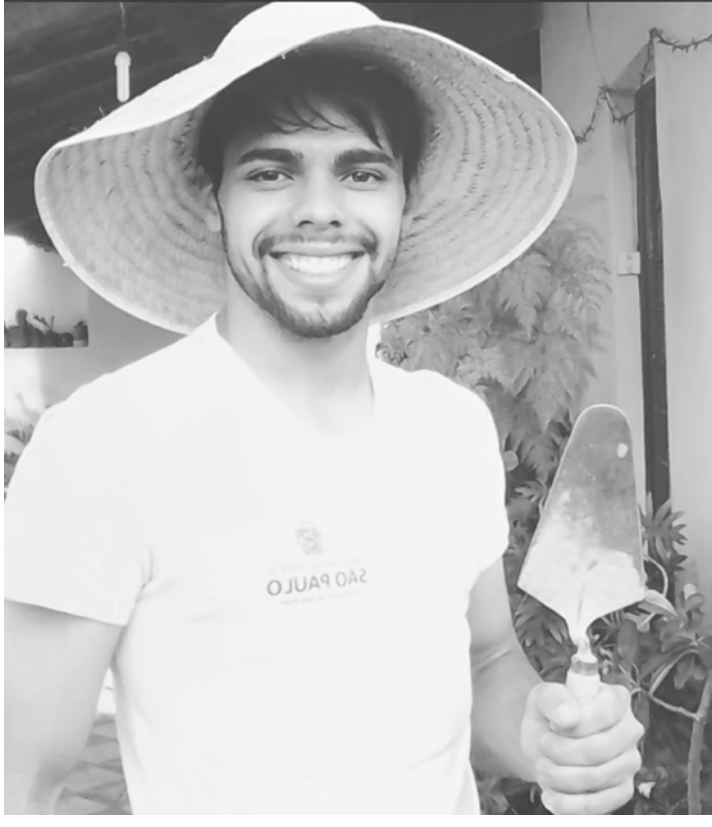
“Trabalhar não é sacrifício para ninguém, muito pelo contrário: é um prazer que nos torna parte do mundo”

O jovem conta que já trabalhou como ajudante de pedreiro para pagar os estudos e atualmente é pintor, além de cursar Educação Física. E não para por aí. Nas horas vagas ele ainda encontra um tempinho para administrar uma página que criou no Facebook, denominada “O Menino Pedreiro”, sucesso nas redes sociais e seguida por mais de 8 mil pessoas. “Ao criar a página eu quis demonstrar o orgulho que sinto em realizar um trabalho digno. Estamos em um momento em que o país enfrenta inúmeros escândalos de