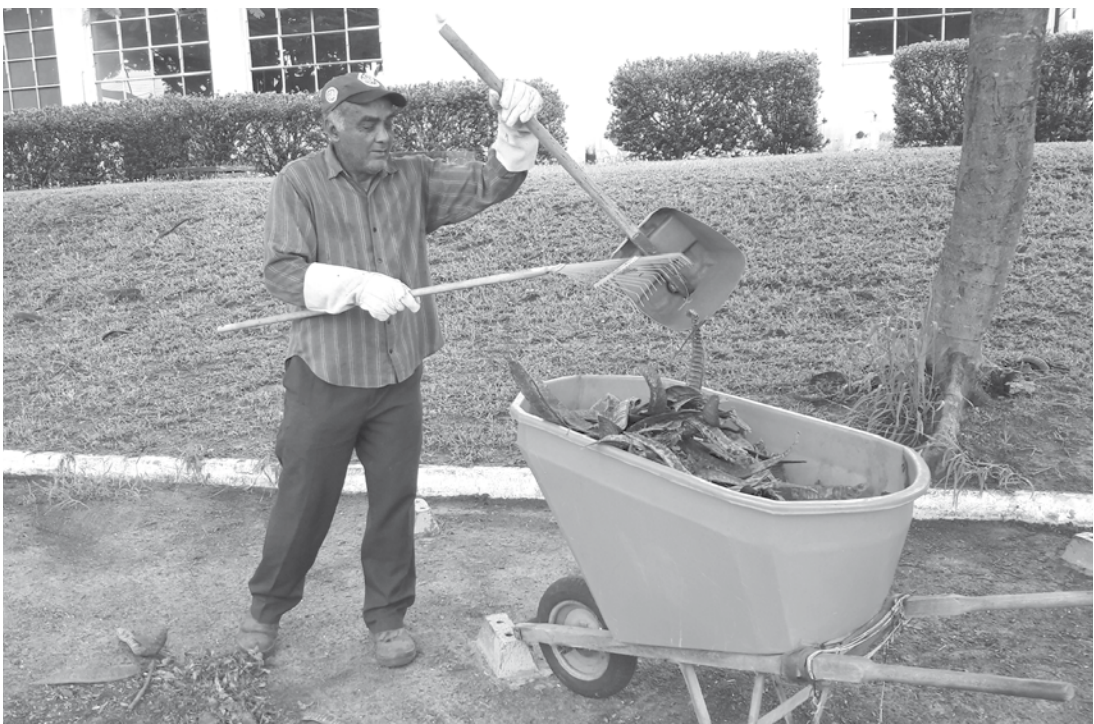
Seu trabalho também está relacionado com a limpeza das plantas

O EXTRA: Você acha que o seu trabalho apresenta algum tipo de risco?