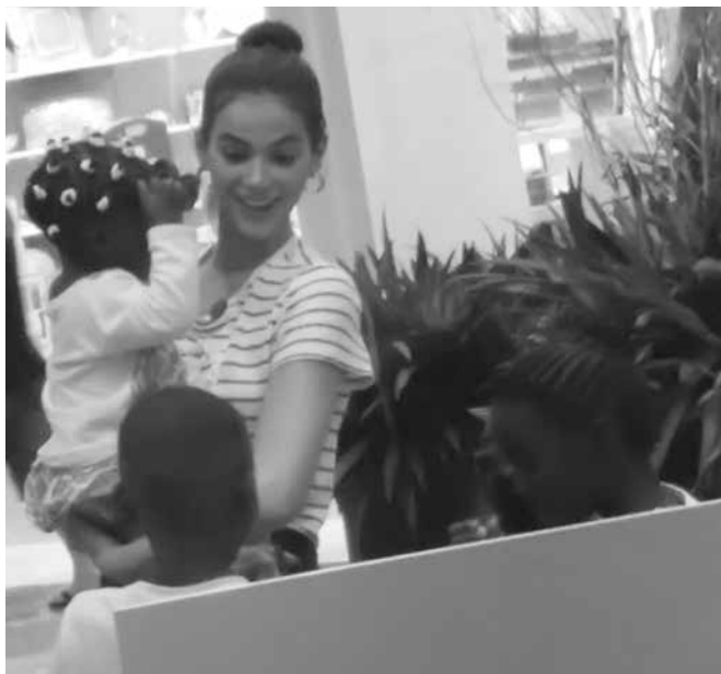
Marquezine passeou no shopping e levou as crianças para passar o Natal com ela

ram famílias de refugiados para suas casas neste Natal.