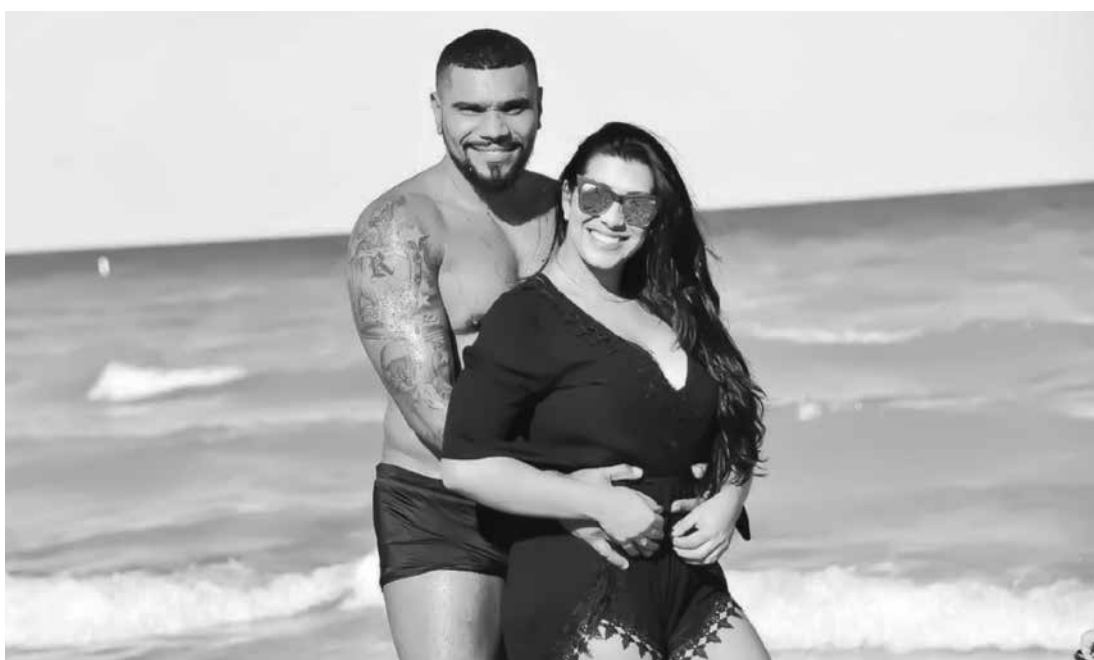
Ela falou sobre a decisão em publicação nas redes sociais