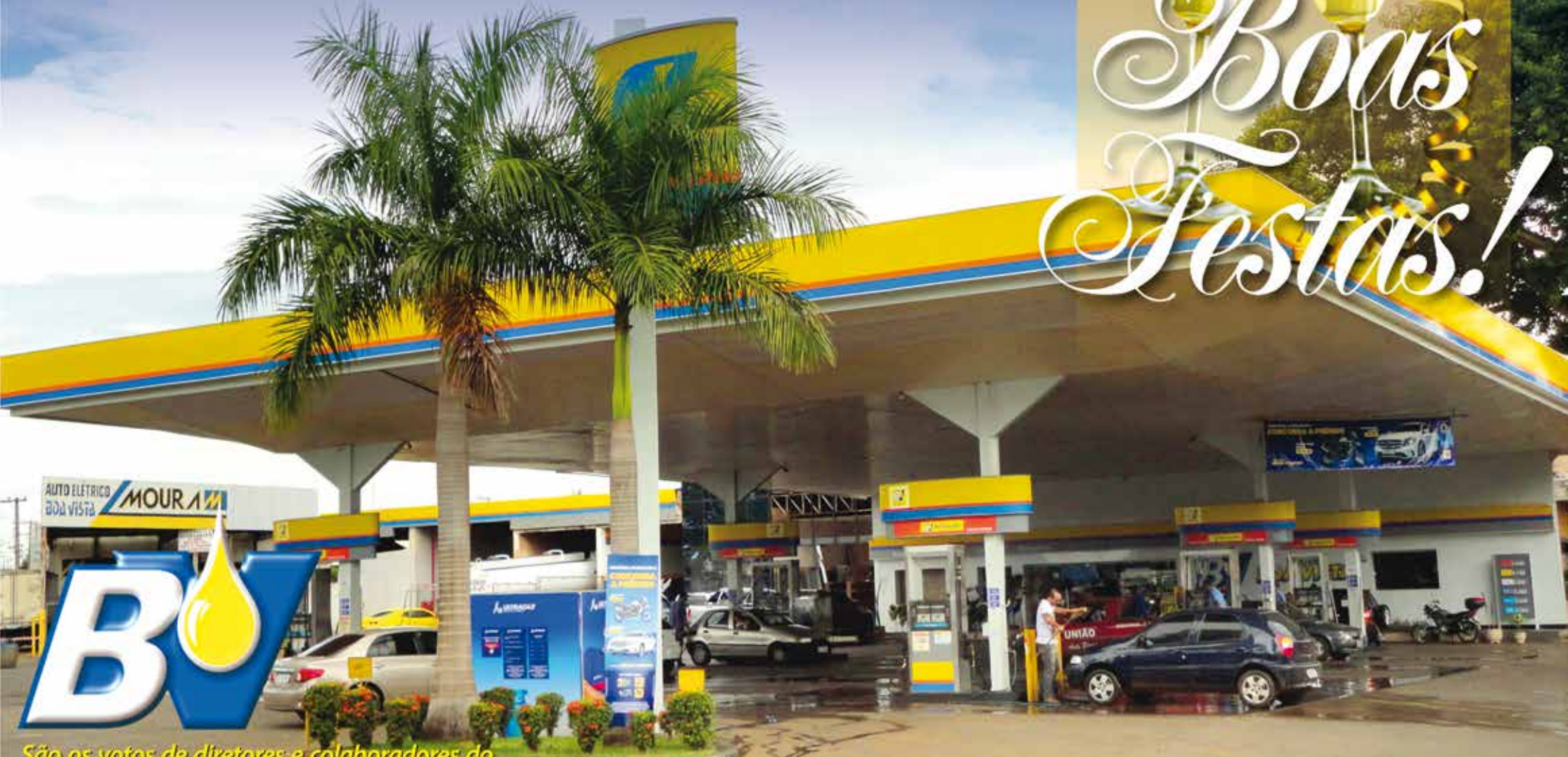
São os votos de diretores e colaboradores do