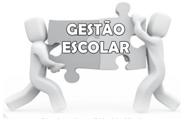
Lista de escolas escolhidas foi publicada no Diário Oficial nesta quinta-feira

de três anos, o profissional deverá participar do Curso Específico de Formação ministrado pela Escola de Formação e Aperfeiçoamento dos Professores do Estado de São Paulo (Efap). O programa tem carga horária de 360 horas e é voltado às habilidades de gestão. Estão previstas ainda avaliações anuais sobre comprometi-