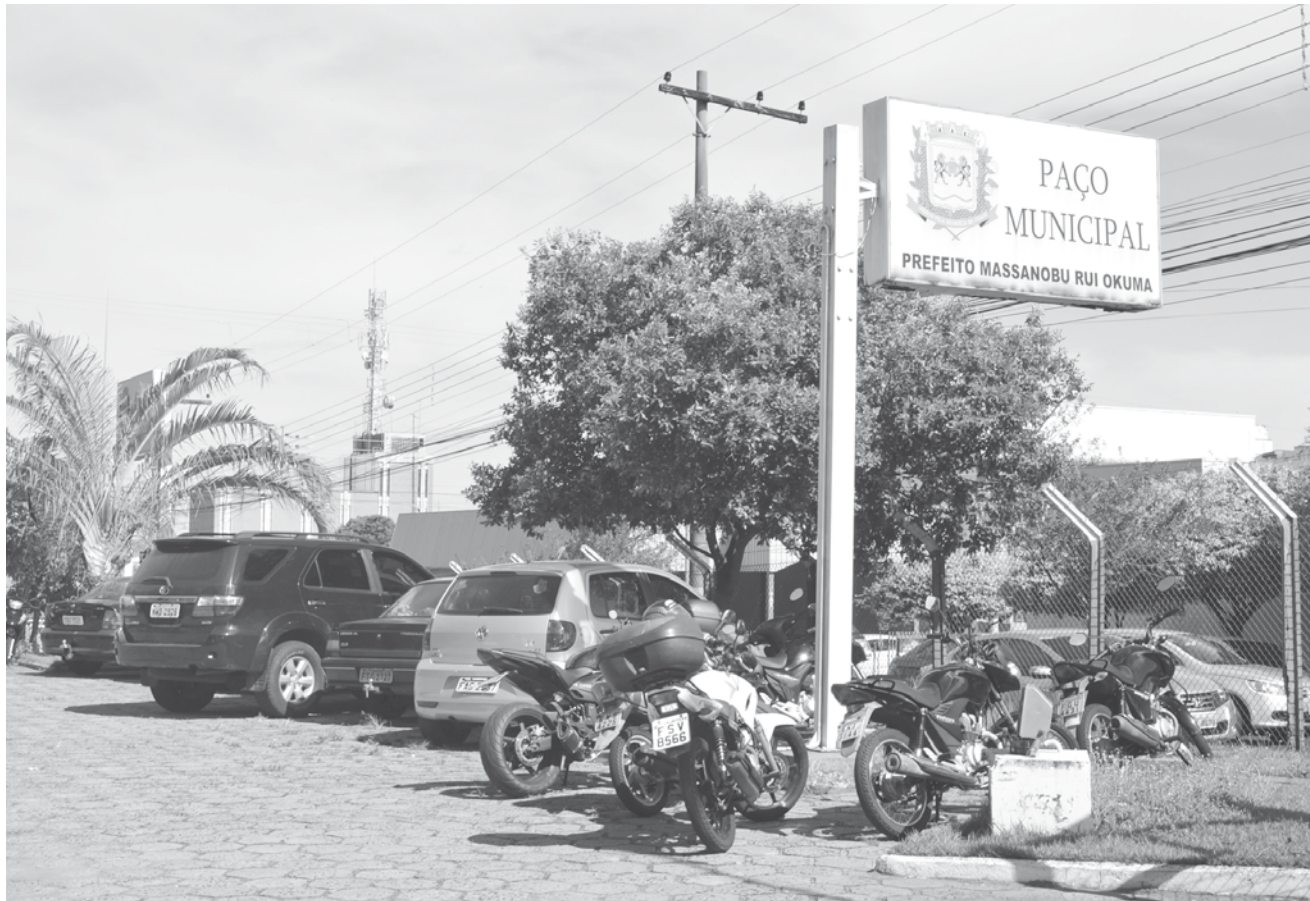
A Prefeitura reabre no dia 02 a partir das 12h

O documento ainda institui como Ponto Facultativo nas repartições públicas municipais os dias anteriores ao dia 25 de Dezembro e 1º de Janeiro quando caírem em dias úteis. Quando algum dos feriados ocorrerem na terça ou quinta – feira, também será declarado ponto facultativo nas repartições públicas na segunda ou na sexta-feira respectivamente, não se aplicando este dispositivo as repartições cuja natureza houver a necessidade de funcionamento ininterrupto.