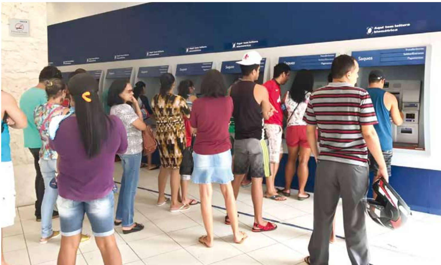
Clientes poderão pagar as contas em caixas eletrônicos usando o código de barras

Entre as alternativas, os clientes podem utilizar caixas eletrônicos, internet