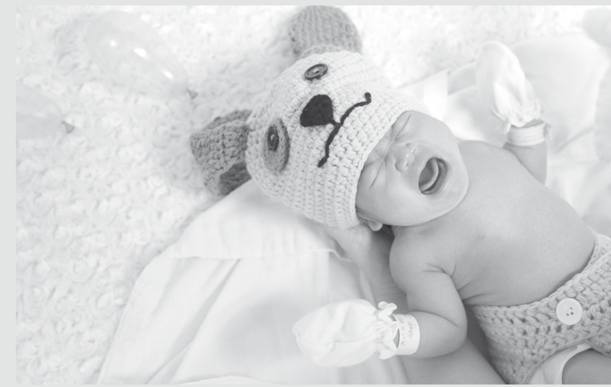
imagem do dia

Um bebê recém-nascido é visto com uma roupinha de cachorro para celebrar o Ano novo do Cachorro em uma maternidade do hospital Paolo Chokchai 4, na Tailândia.