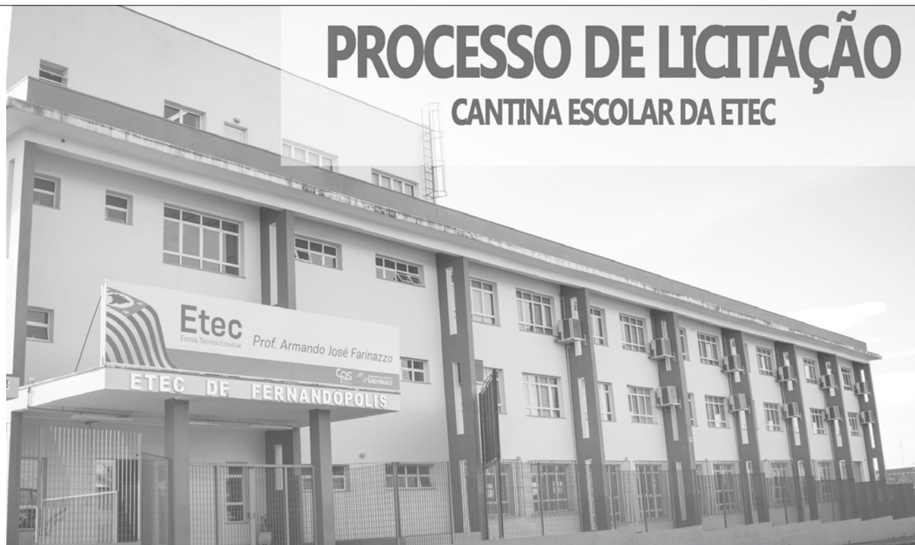
Propostas deverão ser encaminhadas à escola até o dia 17 de Janeiro

A globalização priorizou interesses específicos de ganhos, descuidando do equilíbrio entre as nações. O populismo nacionalista se aproveitou do descontentamento geral para galgar o poder. Ambos descuidam da boa administração, abandonando a busca da continuada melhora das condições de vida.