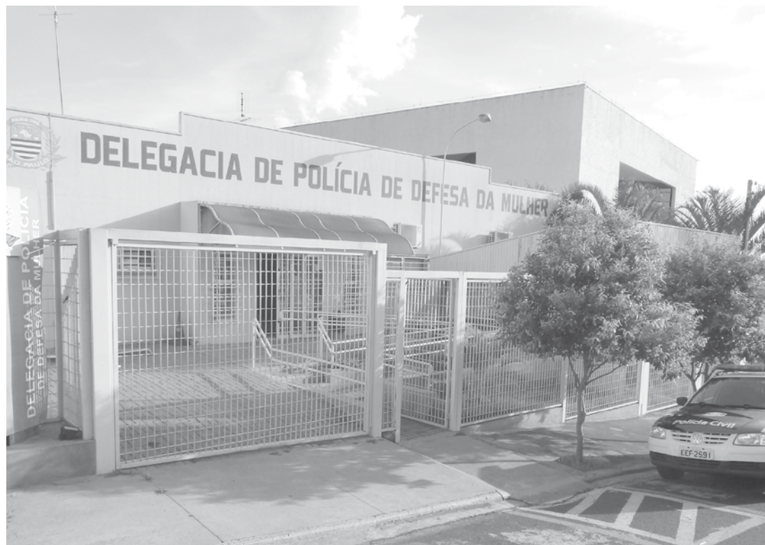
O caso é investigado pela DDM (Delegacia de Defesa da Mulher) de Fernandópolis

ma, durou cerca de 40 minutos. Durante o crime o filho da vítima, um garoto de 9 anos, que estava no quarto ao lado, escutou o barulho e foi checar o que acontecia. Ao ver a mãe sendo agredida, o garoto tentou defendê-la, mas também foi agredido pelo homem, que fugiu na sequência. A Polícia Militar foi acionada e o agressor foi preso no interior de sua residência, mi-