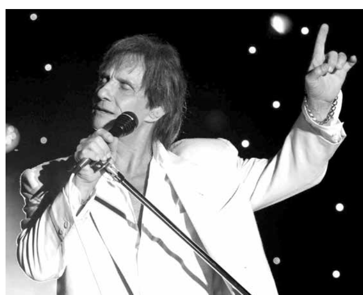
Cantor deixou vizinhos assustados com atitudes estranhas por causa do TOC