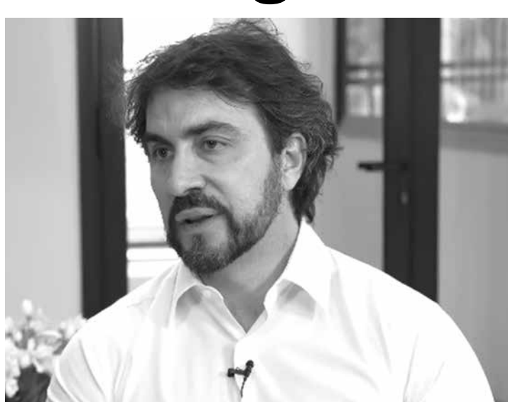
“Gosto de não ter a responsabilidade da alegria do fim de ano”

“O pior lugar do mundo é o litoral no interior. Fila para a padaria, fila para o restaurante, e vê aquele mar de gente, fingindo estar feliz. Um dia comecei a tomar coragem de estar onde achei que era mais interessante.