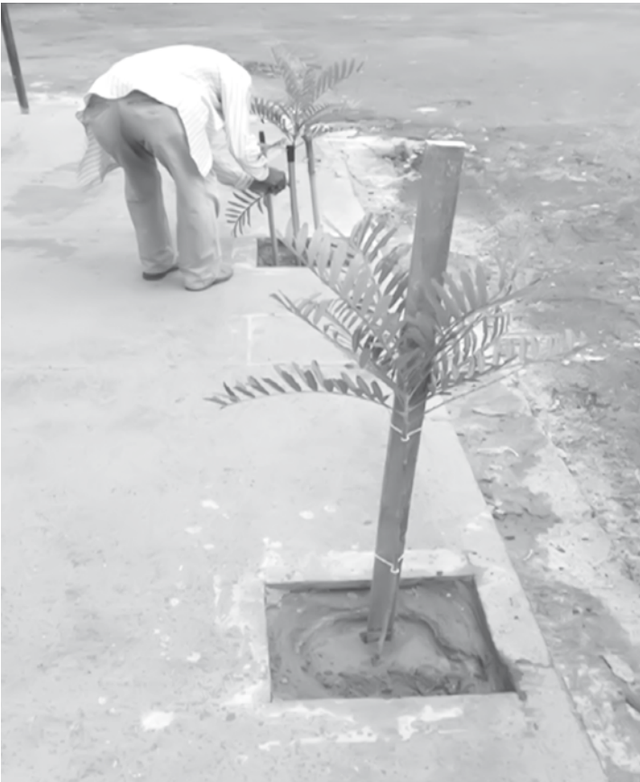
Para participar o morador solicita o plantio de uma árvore na calçada de sua casa, por meio do telefone 3463-9014, ou pessoalmente na Secretaria de Meio Ambiente

E 74% disseram ainda que conseguiram realizar pelo menos um projeto esperado para 2017, sendo que entre as metas estiveram o cuidado com a saúde (24%), ter mais tempo livre (15%) e poupar dinheiro (13%).