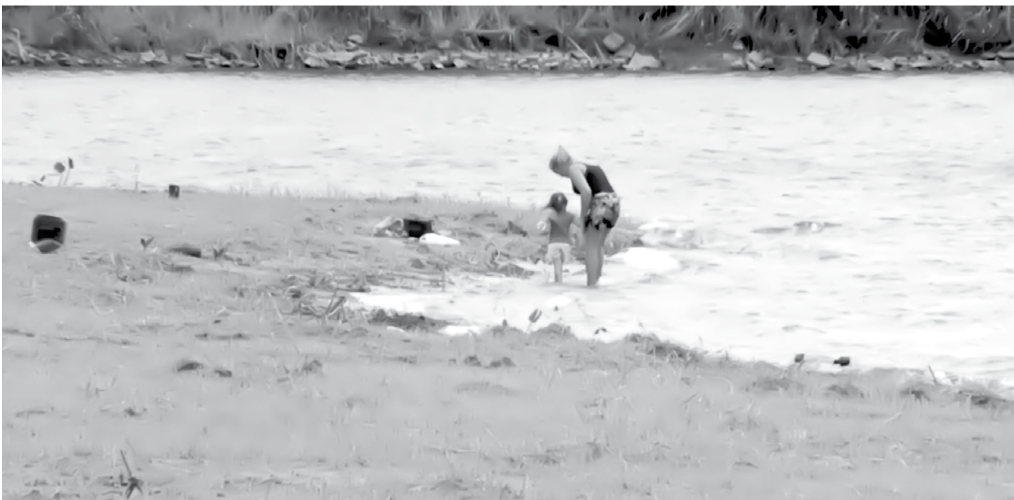
Bombeiros orientam crianças a estar sempre acompanhadas nas prainhas