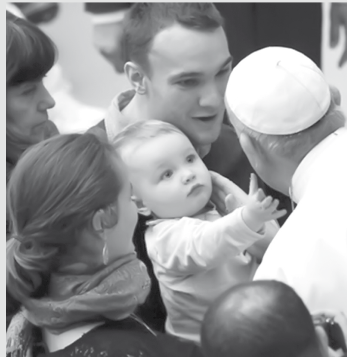
Combinação de fotos mostra um bebê fazendo carinho no rosto do Papa Francisco no Vaticano