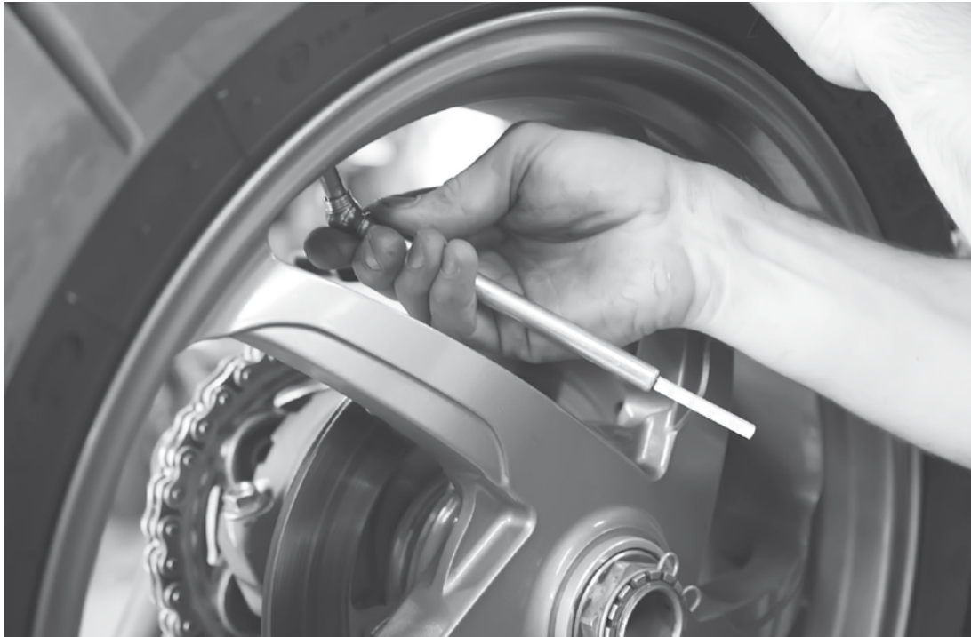
Manutenção do automóvel é essencial para uma viagem tranquila

A PM ainda recomenda relações de boa vizinhança. Sabendo que o morador ao lado está ausente, o vizinho precisa ficar atento a barulhos e movimentações estranhas até que ele volte. Verificando qualquer anormalidade fora disso, a orientação é ligar ao 190 para denunciar.