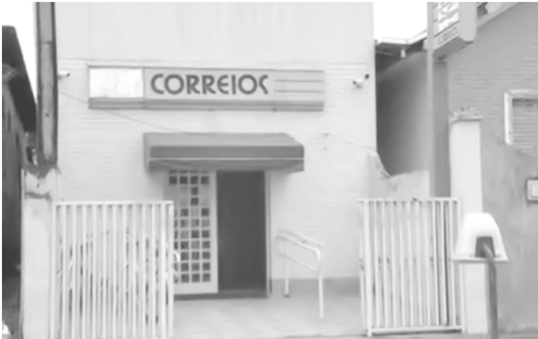
Agência dos Correios de Riolândia

deral e com órgãos municipais e estaduais. Há, inclusive, um acordo de cooperação com a PF, que, por meio de análise de inteligência, consegue mapear quadrilhas, seu modo de atuação e, por consequência, realizar ações e apreensões de criminosos que praticam crimes contra os Correios”.