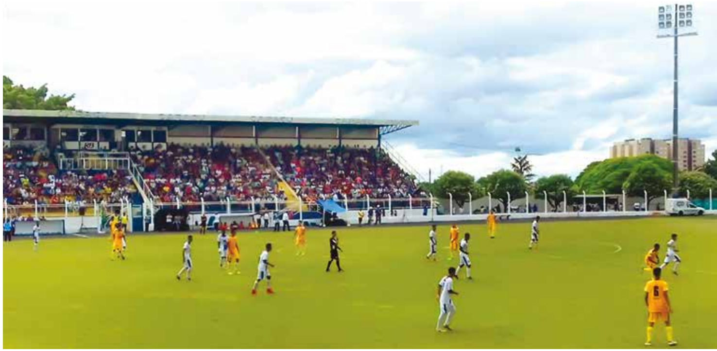
Partida aconteceu no municipal Cláudio Rodante, nesta quarta-feira

No próximo sábado, 06, às 16h, no estádio Claudio Rodante, o Fefecê tentará