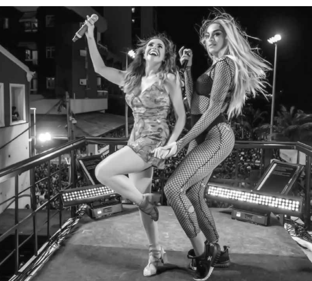
"A Pablo é carismática, inteligente e ama estar no palco", comenta Daniela.