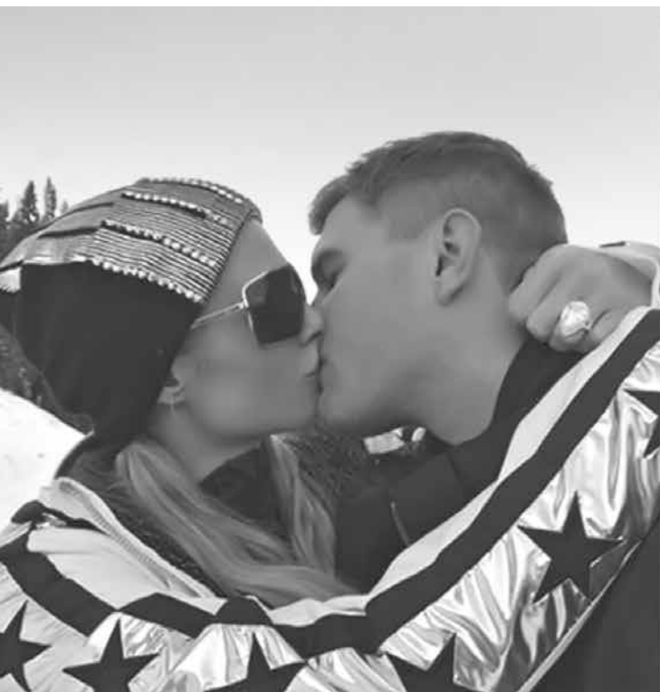
Paris Hilton mostra fotos do momento em que foi pedida em casamento

sinto como a garota mais sortuda do mundo! Você é meu sonho se tornando realidade! Obrigada por me mostrar que os contos de fadas existem", disse ela.