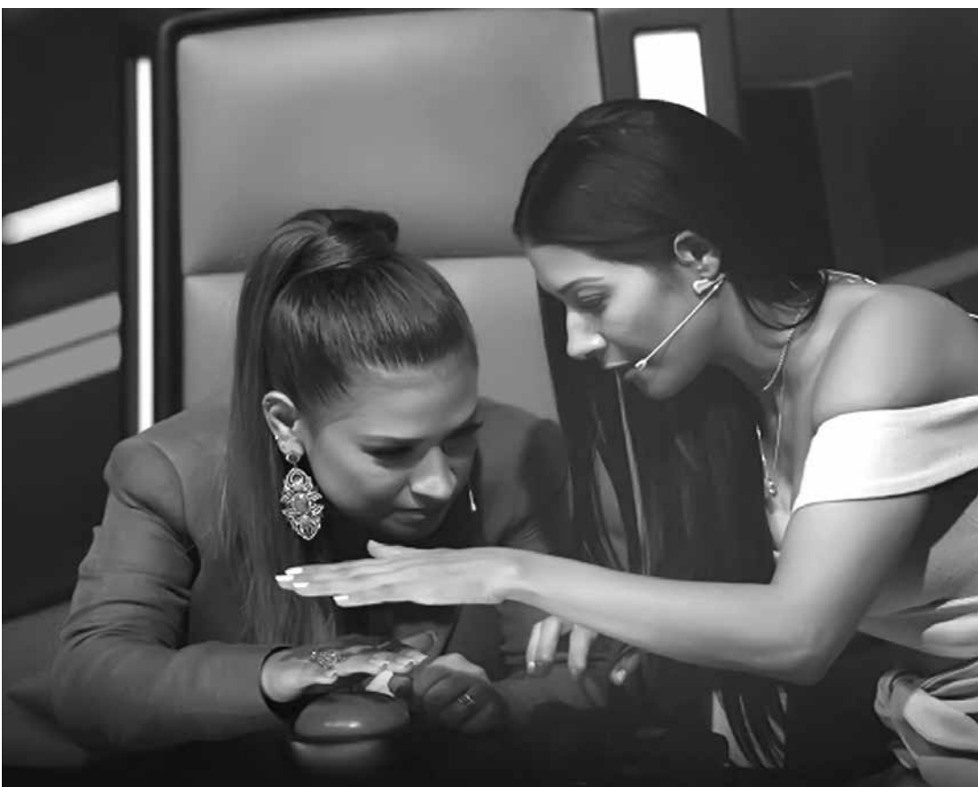
Pouco depois de lançar o vídeo feito para a música Paga de Solteiro Feliz, a dupla estreou no time de técnicos do The Voice Kids

É, pelo visto, 2018 vai ser mais um ano de muito sucesso para as Coleguinhas!