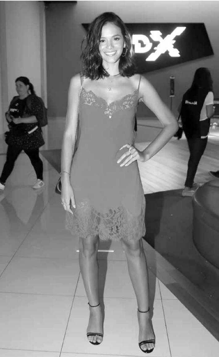
Ela só descobriu ao emagrecer para a nova personagem