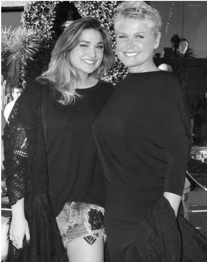
“Seja feliz, aproveite o momento como se fosse o último”, declara Xuxa

aconselhar a filha quando o assunto é o coração. “Seja feliz, aproveite o momento como se fosse o último. Se arrepende de algo que você fez e não do que você não fez. Ame, ame, ame muito. A vida fica mais linda quando amamos”, declarou ela, há cinco anos realizada em seu relacionamento com o cantor Junno Andrade.