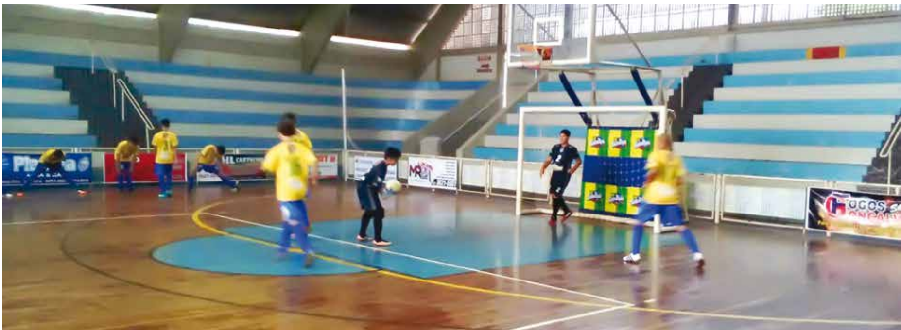
O próximo desafio de Fernandópolis será contra a cidade de Iturama/MG

As partidas seguem até a primeira semana de fevereiro. O campeonato é dividido em dois grupos e as duas melhores equipes de cada um deles serão classificadas para a semifinal. O próximo desafio de Fernandópolis será contra a cidade de Iturama/MG, no dia 24 de janeiro, às 19h30, na cidade de Jales.