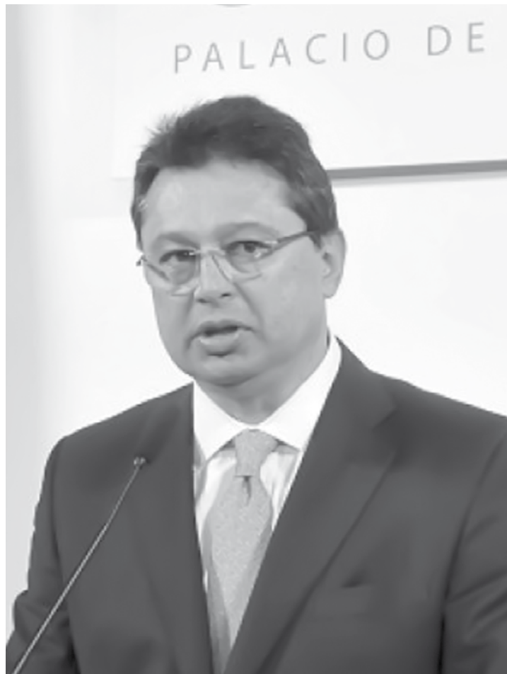
Gustavo Leite, Ministro da Indústria e Comércio do Paraguai

Gustavo Leite é formado em Administração de Empresas pela Universidade da Califórnia, nos Estados Unidos, e tem mestrado em Marketing Internacional, na Escócia. Teve uma