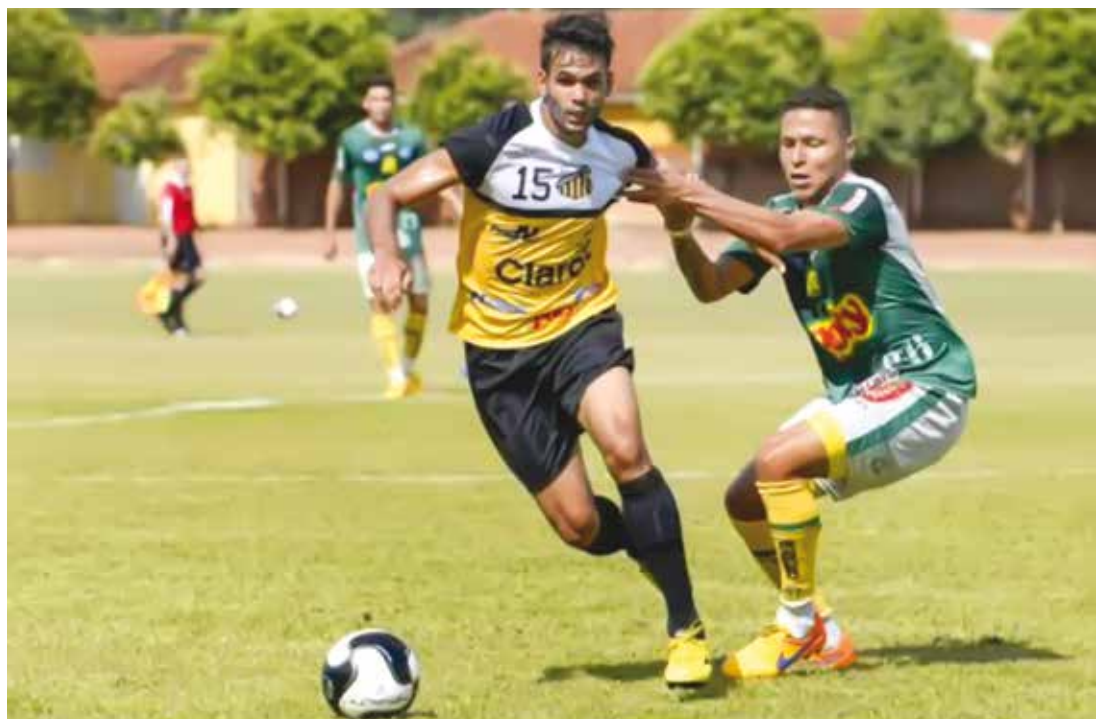
Novorizontino e Mirassol fazem clássico regional na estreia do Paulistão 2018

A direção do Tigre apresentou no final de semana os uni-