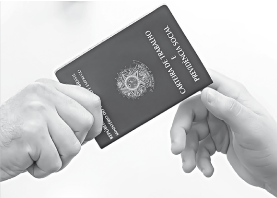
Taxa de crescimento de 0,3% foi a maior registrada desde novembro de 2014

No entanto, os demais indicadores de novembro são negativos. O faturamento