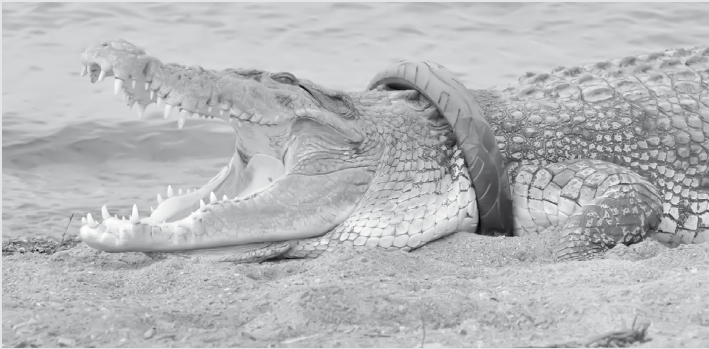
Um crocodilo está com um pneu de moto preso no pescoço há pelo menos 2 anos toma um banho de sol em uma praia na cidade de Palu, na Indonésia