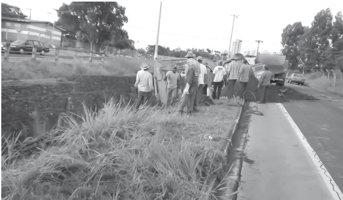
Equipes da Prefeitura desenvolvendo serviços de limpeza em avenidas da cidade

Mesmo em período chuvoso, a Prefeitura de Fernandópolis realiza serviços de manutenção e reparos em diversos bairros da cidade. A Secretaria de Obras está com sua equipe nas ruas desenvolvendo ações de limpeza em avenidas, terrenos baldios, praças e galerias. Na Avenida dos Arnaldos e avenidas do Jardim Universitário, trabalhadores realizaram nos últimos dias a capinação dos canteiros centrais, a fim de manter os locais mais limpos e evitar a proliferação de insetos e animais peçonhentos. Em resposta rápida às ocorrências e danos causados pelas fortes chuvas, o grupo também efetua a recuperação e reparos em diversas vias do município e tapa buracos, trabalhando diuturnamente para a reestruturação dos locais danificados. Os moradores dos bairros atendidos até o momento têm se mostrado bastante satisfeitos com a atenção por parte do poder público. Os trabalhos terão continuidade em diversas regiões e visam deixar a cidade, em todos seus bairros, mais bonita e com acesso livre de tráfego aos pedestres e motoristas.