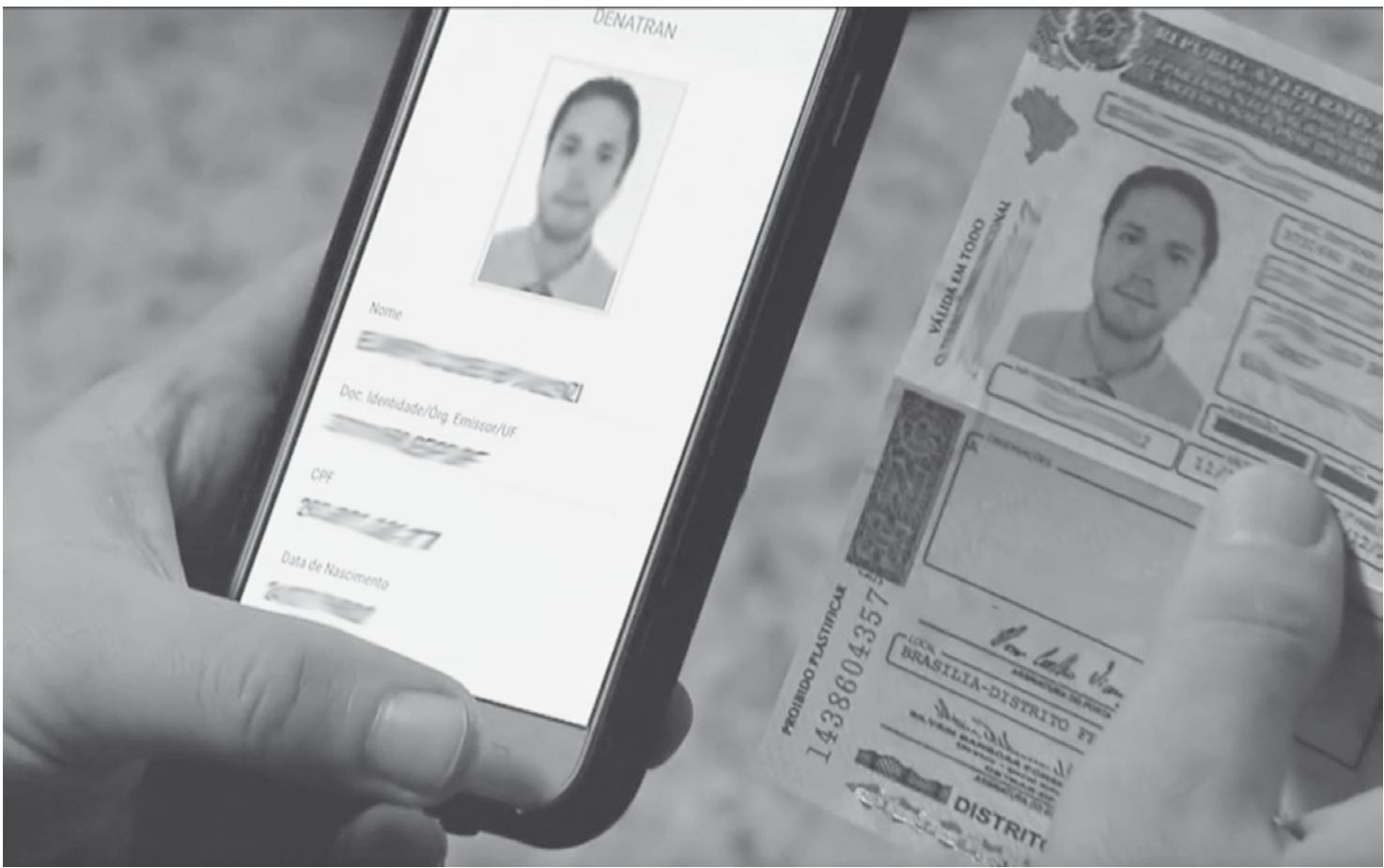
Não há definição com relação ao custo do documento digital

O novo formato do documento funcionará como um aplicativo de celular e estará disponível nas lojas oficiais da Apple e do Google (para aparelhos Android). De acordo com Rodrigo Mourad, sócio da Cobli - startup especializada em controle de frotas, telemetria e roteirização - o novo modelo trará diversas vantagens. "Além da economia de papel, os condutores mais es- quecidos também terão uma boa economia no bolso, já