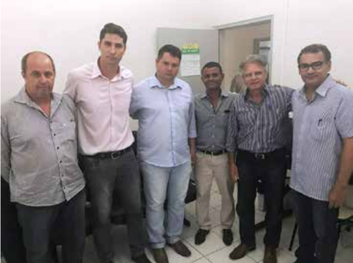
Parlamentar foi recepcionado por autoridades de Guarani d'Oeste