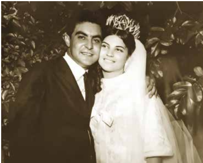
FOTOS ANTIGAS: Recordações do casamento estão em um álbum de fotografias muito bem guardado pelo casal