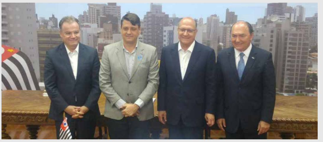
■ Praticamente “concluir” as obras do DISTRITO INDUSTRIAL VI

Com um financiamento, através do programa Desenvolve SP, foram liberados para Fernandópolis R$ 2 milhões visando a viabilização das obras de infraestrutura do Distrito Industrial VI, com a implantação de tubulação de água, esgoto, guias, sarjetas, pavimentação asfáltica, galeria de águas pluviais e iluminação pública. A área fica ao lado da Rodovia Euclides da Cunha (sentido Meridiano/Fernandópolis) e terá infraestrutura completa para receber novas indústrias e empresas para o município, gerando emprego e renda aos fernandopolenses. Sendo assim, os R$ 3 milhões que o município economizaria com a redução dos salários dos vereadores seriam suficientes para praticamente concluir o restante das obras do Distrito Industrial VI.