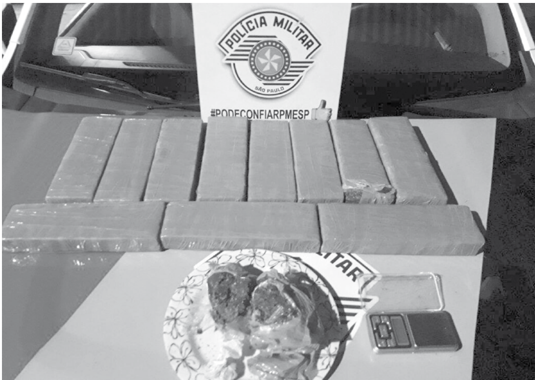
Entorpecente e balança de precisão foram apreendidos pela Polícia durante a ocorrência

O caso foi registrado no Plantão Policial e posteriormente repassado à DI-SE (Delegacia de Investigações Sobre Entorpecentes), responsável em apurar os fatos. Até o fechamento desta edição, nenhum suspeito foi preso.