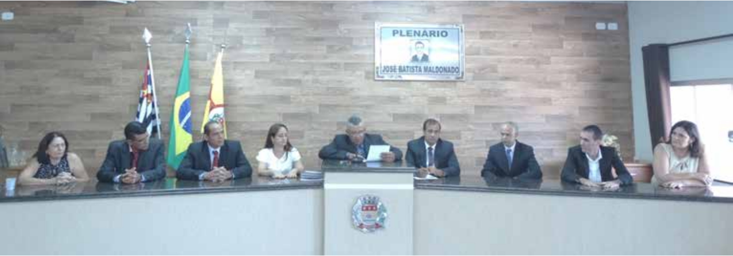
Medidas permitiram a devolução aos cofres da Prefeitura a importância de R$ 78 mil