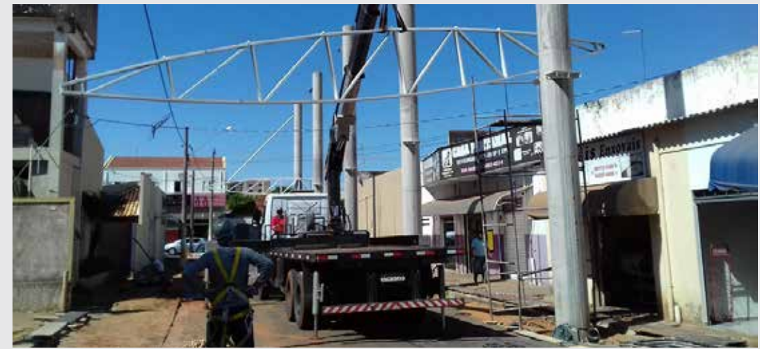
■ Realizar 4 vezes a cobertura da feira livre, no entorno do “Mercadão”, uma obra orçada em R$ 700 mil

uma delas -, que poderiam ser realizadas na cidade se, de fato, o referido projeto for aprovado na Câmara Municipal nas próximas semanas. Vale ressaltar que esta economia nos cofres públicos só será possível entre os anos de 2021 e 2024, já que a redução salarial entrará em vigor na próxima legislatura. Até lá, cada um dos 13 vereadores de Fernandópolis continuarão recebendo um salário de R$ 5 mil por mês.