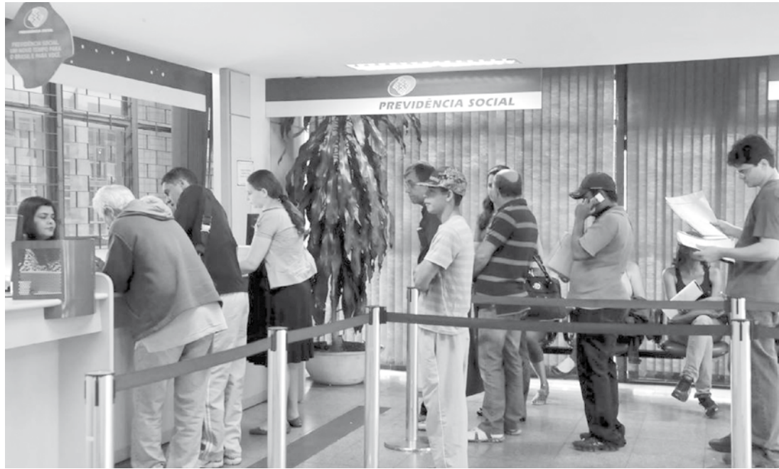
Segundo o INSS, estão sendo dotadas medidas para correção de possíveis distorções em seus sistemas e cadastros

As análises foram realizadas tendo referência a legislação que trata das espécies de benefícios e a maciça (folha de pagamento de benefícios do INSS) de março de 2017. Assim, os técnicos puderam verificar a existência de pagamentos acumulados de forma incompatível.