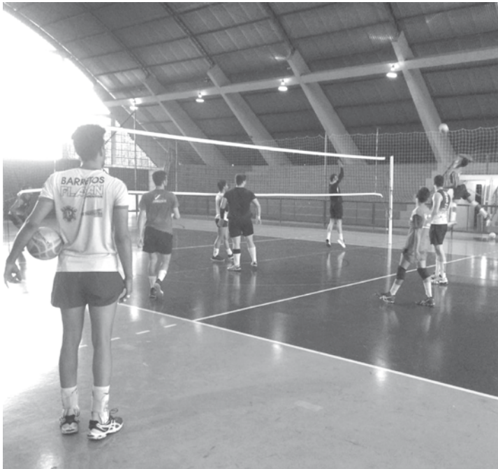
Competição reúne mais de 200 atletas da região

Como disse: no dos outros... é refresco.