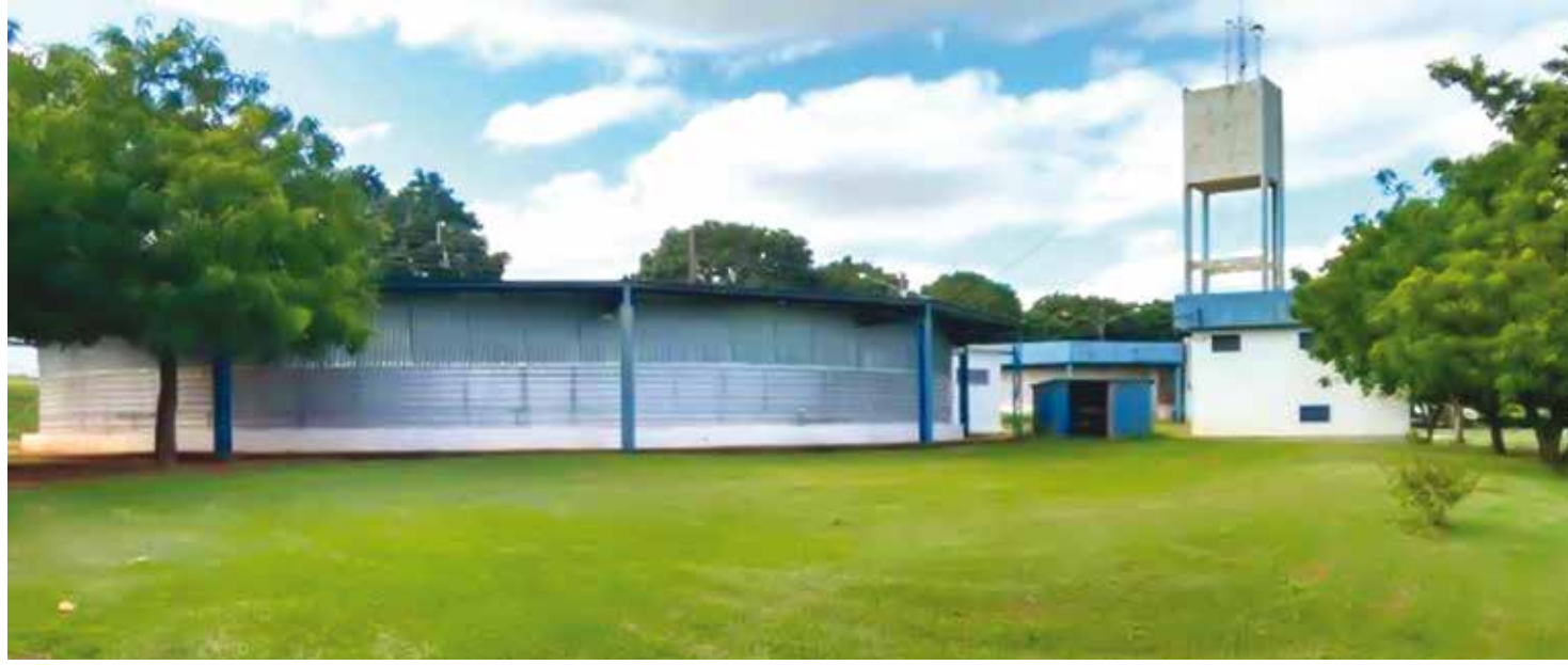
Premier Foods comanda as atividades da unidade fernandopolense

Segundo a direção e chefia de Departamento de Pessoal da Premier, a empresa já está administrando o frigorífico há 18 meses e, durante todo esse período, o ocorrido neste mês foi a única exceção e se deve às peculiaridades do período natalino e virada do ano. Mesmo assim a empresa já havia quitado um vale – correspondente a 40% da remuneração de cada um – no dia 15 de dezembro e também avisado pre-