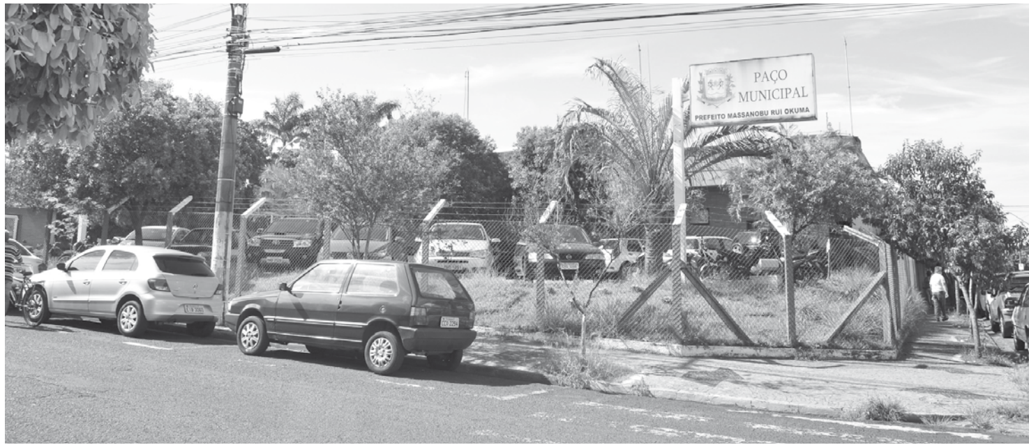
Reunião foi realizada na tarde desta sexta-feira no gabinete da Prefeitura

Também foi alertado pela MetaPública que devido ao percentual do limite legal, a Administração Municipal ficou impedida pela Lei de Responsabilidade Fiscal de conceder reajuste inflacionário. A reunião foi produtiva, na qual devido a este impedimento legal, foi encontrada uma alternativa através da concessão do vale-alimentação na qual cada servidor receberá o valor de R$ 1.440,00, por ano, R$ 120,00 mensal.