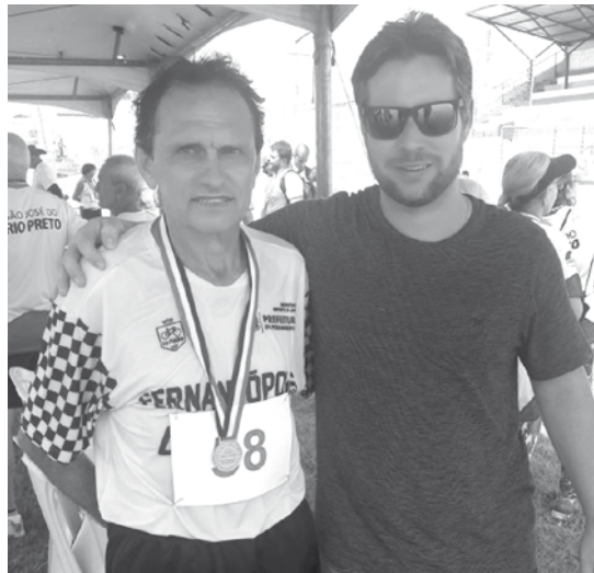
Fernandopolenses medalhistas no JORI

ção que conta com cerca de 2.800 pessoas, entre atletas, árbitros, técnicos e equipes de apoio. Nessa fase serão selecionados os dois melhores colocados em cada modalidade para participarem da grande final estadual, que