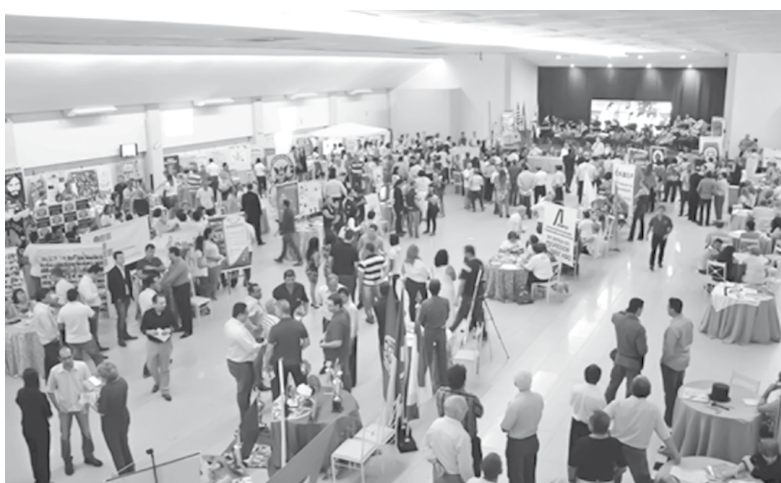
No ano passado, 85 organizações expositoras foram exaltadas pelo público

De acordo com a organização, a cada edição, o evento visa alertar e atrair cada vez mais entidades e organizações locais à iniciativa, em prol da sociedade fernandopolense.