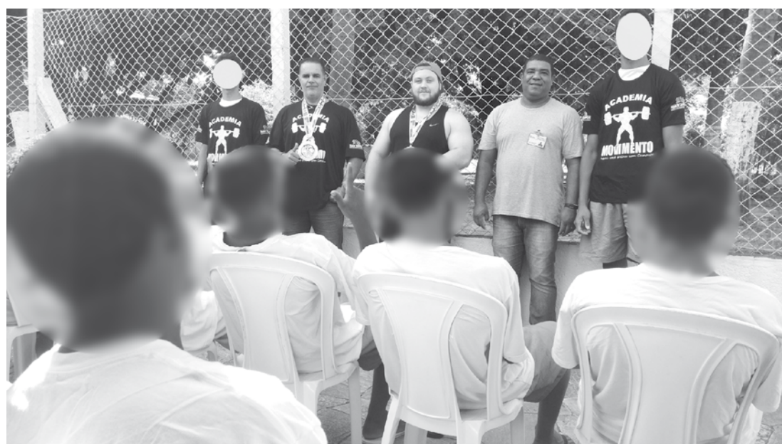
Atletas puderam compartilhar com os jovens suas dificuldades