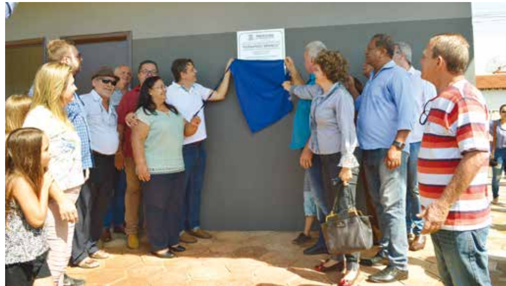
Local será um dos núcleos do projeto “Bom de Escola, Bom de Esporte”