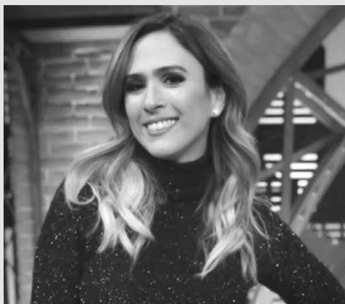
Apresentadora no comando do programa Lady Night, no Multishow