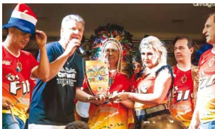
Bloco Campeão: Os Filés, com cerca de 120 membros