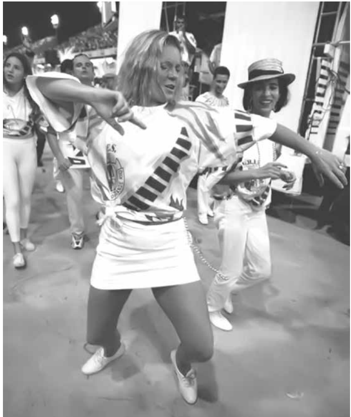
Vera Fischer no carnaval de 1997

não gostam mais ver tanta gente pelada. Eu, particularmente, prefiro as fantasias”, opina.