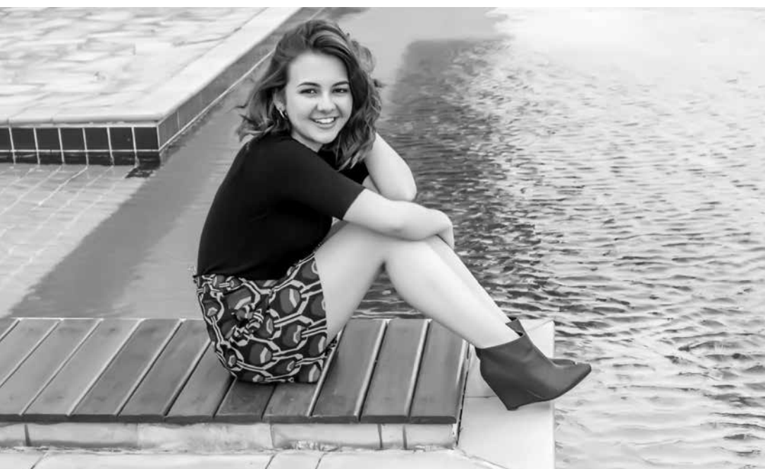
A atriz foi emancipada aos 17 anos