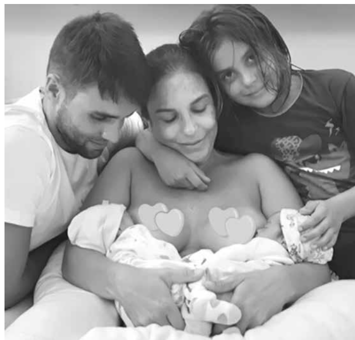
A cantora mostrou foto com o marido e os três filhos

Ela falou que ficará um pouco afastada das redes sociais e contou como tem sido a amamentação. "Mando essa foto para matar a saudade e dizer que ficarei um pouquinho mais ausente das redes sociais em função da grande atenção que eles precisam nesse momento. A amamentação é uma das coisas mais prazerosas e saudáveis para elas e para mim. Elas crescem felizes e bem alimentadas", disse.