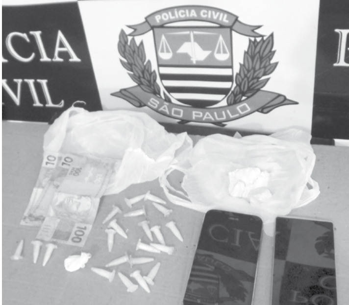
Material apreendido pela polícia

→ Da REDAÇÃO contato@oextra.net Dois homens de 31 e 41 anos foram presos por tráfico de drogas na noite desta quarta-feira, 21, em Valentim Gentil. A dupla estava sendo investigada pela venda dos entorpecentes na cidade. De acordo com a polícia, durante investigação policial da Delegacia de Investigações Sobre Entorpecentes (DISE) de Votuporanga foi constatado que eles comercializavam a droga, diretamente com dependentes químicos da cidade. Em abordagem foi encontrado no interior do veículo de um deles três microtubos com cocaína. Na casa, foram encontrados mais entorpecentes. O carro utilizado pe-