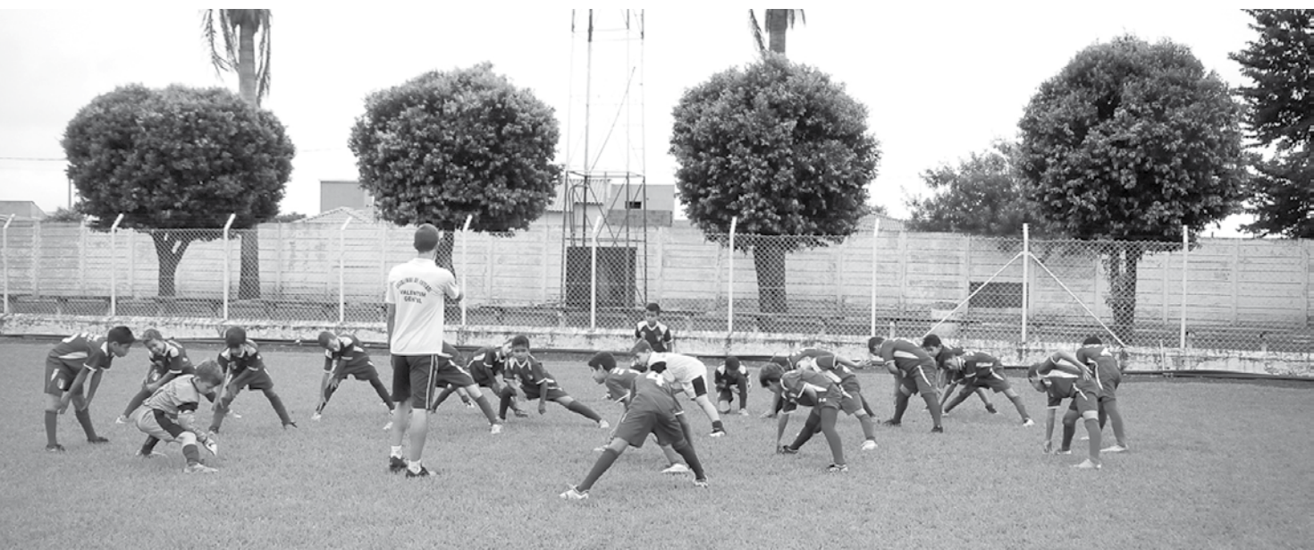
No ano passado, o Sub-10 da Escolinha de Futebol de Valentim Gentil foi campeão da Copa União de Base