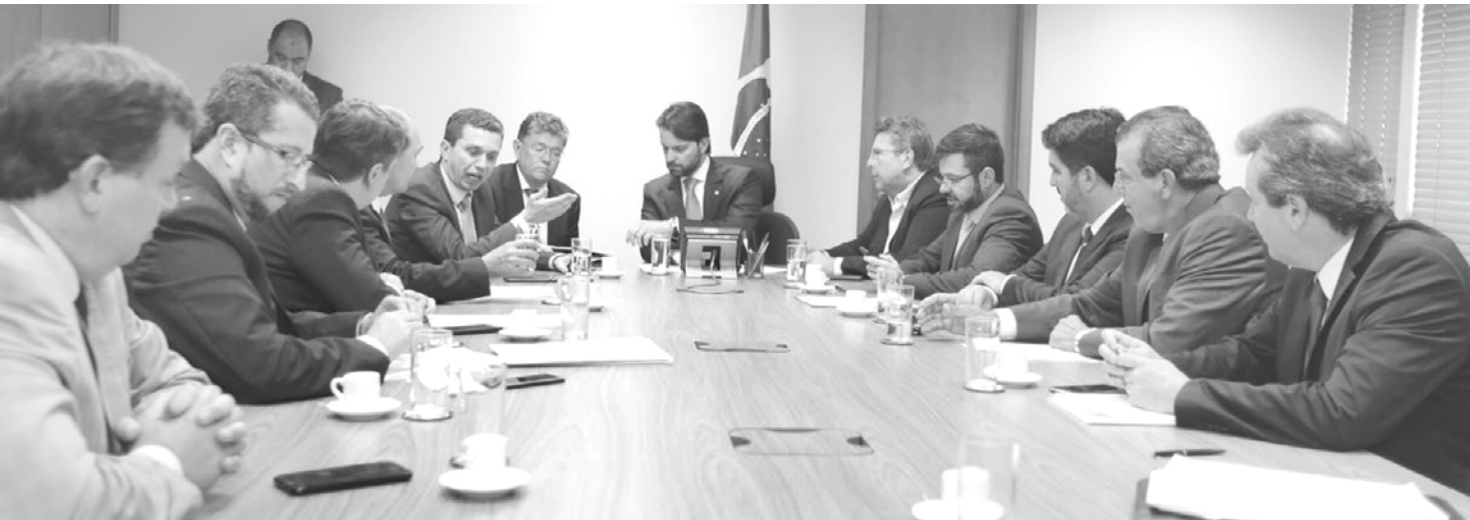
Encontro reuniu prefeitos de cidades da região

bitação a saneamento básico. Os gestores também solicitaram acelerar projetos de financiamentos nestas áreas, com os quais já tramitam entre o Ministério e a Caixa Econômica Federal. "A missão do nosso mandato é aproximar os gestores, oferecer um ponto de apoio. O Ministério das Cidades é estratégico pois tramita todas as demandas em infraestrutura, asfalto, casa popular e programas sociais importantes. O ministro, mais uma vez, foi muito coerente sobre a viabilidade de cada demanda", comentou o parlamentar.