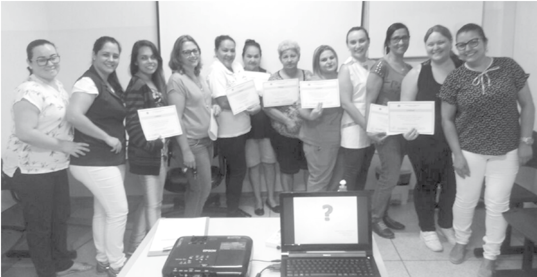
Equipe da Vigilância Sanitária e profissionais que participaram do treinamento

lentim Gentil, o minicurso foi realizado com o objetivo de treinar os profissionais que manipulam alimentos em casa, informalmente, e que trabalham na produção, comercialização, transporte e oferecimento de alimentos. Os profissionais foram capacitados, visando a prepará-los para a melhor forma