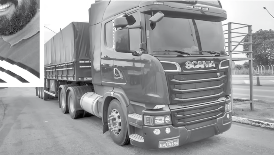
Caminhão roubado era rastreado via satélite. No detalhe, o casal que estava desaparecido desde segunda-feira