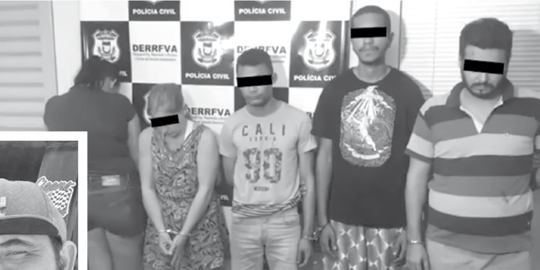
Cinco pessoas suspeitas de envolvimento no crime foram presas pela Polícia