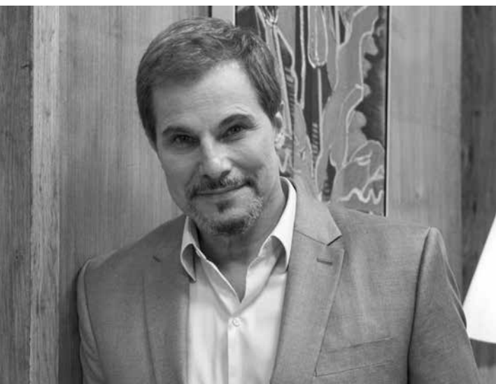
“Aqui, o ponto de vista é o que esse tipo de fato causa na família, na filha, na mãe, na esposa, até na funcionária”, relata o ator