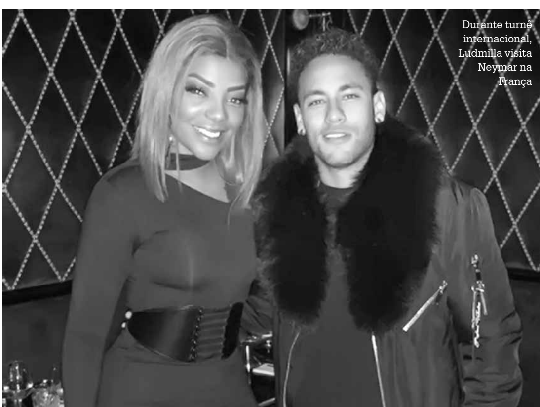
Durante turnê internacional, Ludmilla visita Neymar na França

não encontrar o rei dela não teria graça haha bom te re-encontrar amigo”, disse ela. Ludmilla está na Europa para fazer uma turnê de shows, que começará no próximo final de semana.