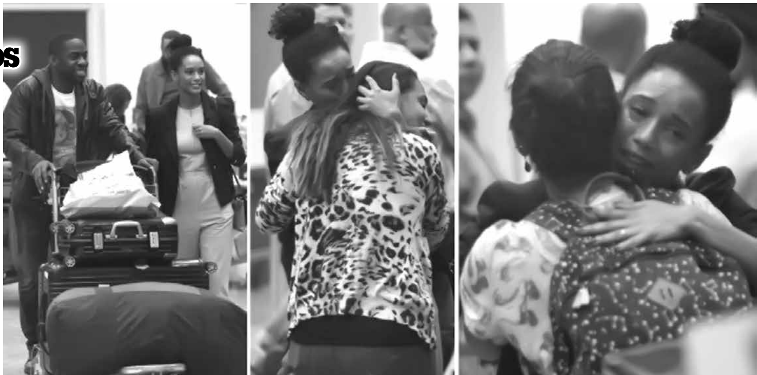
O casal ficou seis dias em Luanda