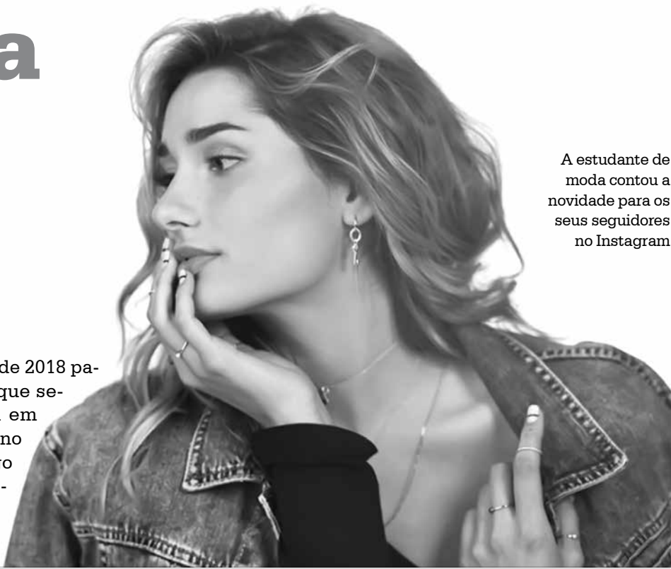
A estudante de moda contou a novidade para os seus seguidores no Instagram

campanha de 2018 para HStern que será lançada em maio, aqui no Brasil e logo mais no México e Israel!”.